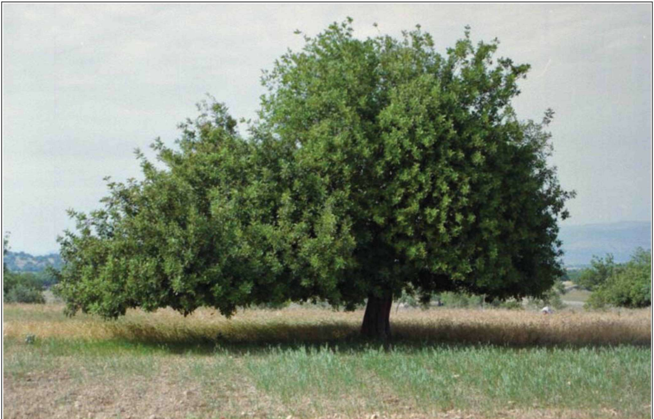
Εικόνα 1. Το δέντρο της χαρουπιάς ( Ceratonia siliqua ).

σπέρματά του χρησιμοποιούνταν στην Αφρική ως σταθμά για να ζυγίζουν τα μπαχαρικά, ενώ στην Ινδία για το χρυσάφι και τα πετράδια. Από το γεγονός αυτό πήρε το όνομά της και η μονάδα βάρους «καράτι» (= κεράτι), που χρησιμοποιείται σήμερα για τα κοσμήματα. Το βάρος του κάθε σπέρματος χαρουπιάς κυμαίνεται μεταξύ 189 mg και 205 mg, ενώ το «καράτι» έχει επίσημα καθοριστεί στα 200 mg (Kavvadas 1956, Gennadios 1959).