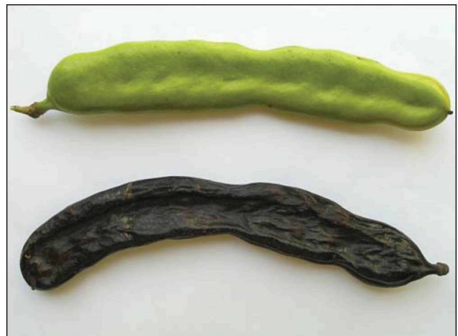
Εικόνα 2. Ο καρπός της χαρουπιάς (χαρούπι).

Ο Πλίνιος, μοναδικός συγγραφέας Φυσικής Ιστορίας στην εποχή των Ρωμαίων αναφέρει ότι οι γλυκοί λοβοί της χαρουπιάς, τα χαρούπια, αποτελούν τροφή για τους χοίρους. Τα χαρούπια κατάφεραν να θρέψουν τον Ιωάννη τον Βαπτιστή στην έρημο, όπως αναφέρεται στη Βίβλο, και γι' αυτόν το λόγο σε ορισμένα μέρη παγκοσμίως το δένδρο της χαρουπιάς είναι γνωστό ως δένδρο του Αγ. Ιωάννη του Βαπτιστή (Wikipedia 2010). Επίσης, χιλιάδες παιδιά κατά τη διάρκεια του Β' Παγκοσμίου Πολέμου επέζησαν, διατρεφόμενα με χαρούπια. Πολλοί άνθρωποι, την ίδια ακριβώς περίοδο, τα φούρνιζαν, τα άλεθαν και ανακάτευαν το άλευρο που προέκυπτε, το οποίο είναι