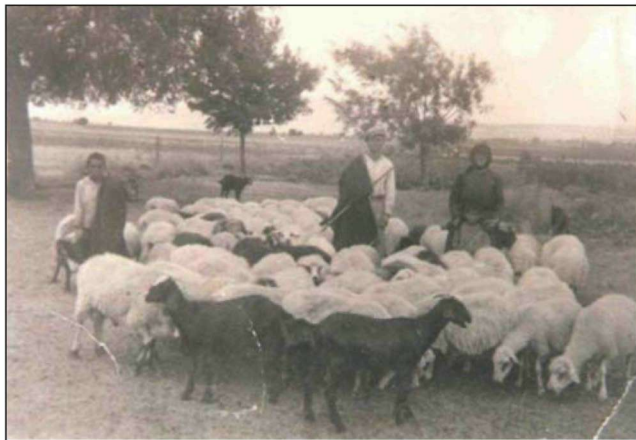
Figure 1. A family tending a flock of sheep in Boeotia (archival photo).

Εικόνα 1. Οικογένεια με κοπάδι προβάτων στη Βοιωτία (φωτ. αρχείου).