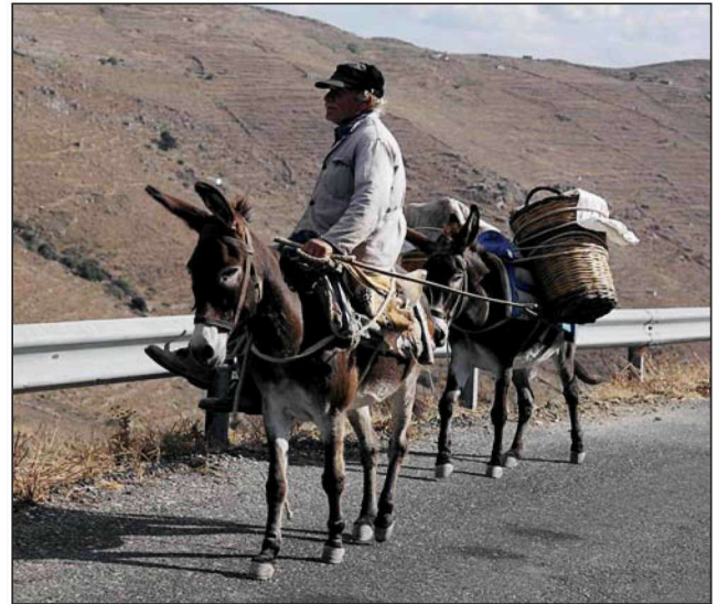
Figure 2. Animals as a transportation means for men and goods on Serifos

Οι άνθρωποι ανέπτυσαν με τα ζώα ιδιαίτερες σχέσεις και έναν κώδικα επικοινωνίας μεταξύ τους «μια μιλιά τους λείπει, έλεγαν». Ιδιαίτερα τα μεγάλα οικόσιτα ζώα (βόδια, αγελάδες, άλογα, μουλάρια)