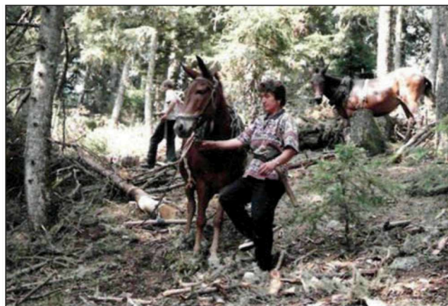
Figure 3. Horses used as a production and transportation means for timber in the fir tree forest on mount Mainalon.

Εικόνα 2. Τα ζώα ως μεταφορικό μέσο ανθρώπων και προϊόντων στη Σέριφο.