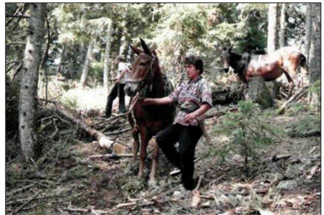
Figure 3. Horses used as a production and transportation means for timber in the fir tree forest on mount Mainalon.

Εικόνα 2. Τα ζώα ως μεταφορικό μέσο ανθρώπων και προϊόντων στη Σέριφο.