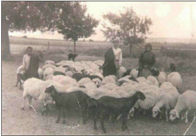
Figure 1. A family tending a flock of sheep in Boeotia (archival photo).

Εικόνα 1. Οικογένεια με κοπάδι προβάτων στη Βοιωτία (φωτ. αρχείου).