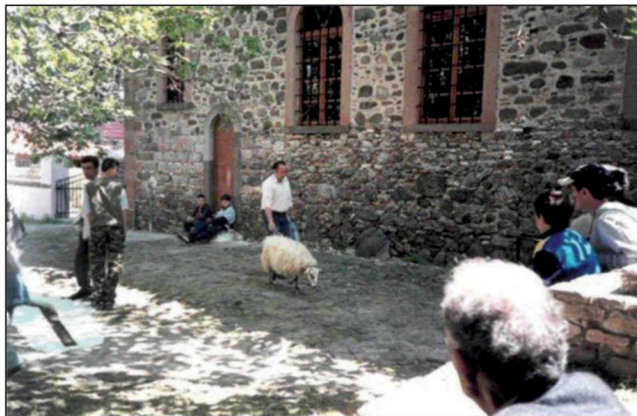
Figure 8. A sheep is taken as an offering to Saint Taxiarchis in Madamado – Lesbos (photo. E. Alexakis 1995-6).

Εικόνα 8. Πρόβατο οδηγείται ως προσφορά στον Αγ. Ταξιάρχη στο Μανταμάδο Λέσβου (φωτ. Ε. Αλεξάκης 1995-6).