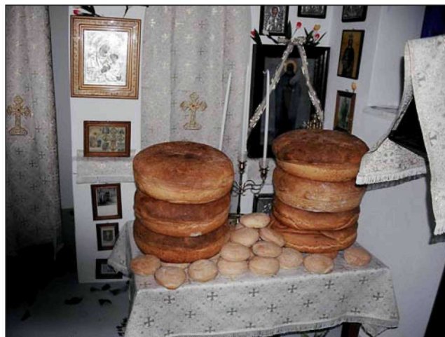
Figure 6. “Artoklasia”, or the parceling of leavened loaf blessed by the priest, and offerings at the celebration of Saint Mamas on the island of Serifos.

Ο Άγιος Μάμας (2 Σεπτεμβρίου) θεωρείται προ-