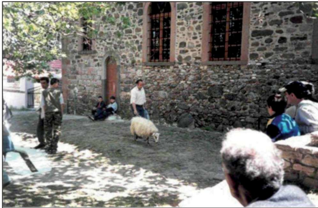
Figure 8. A sheep is taken as an offering to Saint Taxiarchis in Madamado – Lesbos.

Εικόνα 8. Πρόβατο οδηγείται ως προσφορά στον Αγ. Ταξιάρχη στο Μανταμάδο Λέσβου.