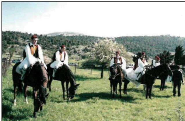
Figure 4. Horse men at the fair in honour of Saint George in Villia – Attica.

Εικόνα 4. Καβαλλάρηδες στο πανηγύρι του Αϊ-Γιώργη στα Βίλια Αττικής.