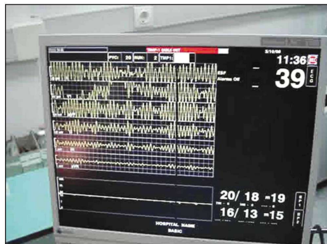
Figure 1. Ventricular fibrillation in swine. The typical electrocardiographic trace and the pressures of the thoracic aorta (BP1) and the right atrium (BP2) are illustrated

Γίνεται, βέβαια, κατανοητό ότι οι πραγματικές συνθήκες ΚΑ στον άνθρωπο είναι εξαιρετικά δύσκολο να προσομοιωθούν, καθώς η στεφανιαία νόσος