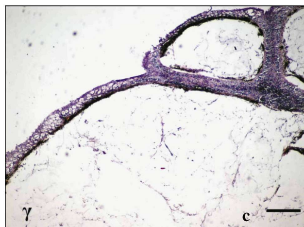
Εικόνα 2. α) Τομές υπερμεγέθων δερματικών πτυχών από χρυσόψαρο Oranda με υπερπλασία και σπογγίωση της επιδερμίδας (ΑΕ, Ράβδος = 200 μm), β) υπερπλασία της επιδερμίδας και αυξημένος αριθμός βλεννογόνιων κυττάρων (ΑΕ, Ράβδος = 200 μm), γ) αυξημένη εναπόθεση λίπους στον υποδόριο ιστό (ΑΕ, Ράβδος = 400 μm).

Figure 2. Section of overgrown skin holds at a goldfish Oranda: a) hyperplasia and spongiosis of epidermis (HE, Bar = 200 μm), b) hyperplasia of epidermis and increased number of mucous cells (HE, Bar = 200 μm), c) increased deposition of adipose tissue in the subcutaneous layer (HE, Bar = 400 μm).