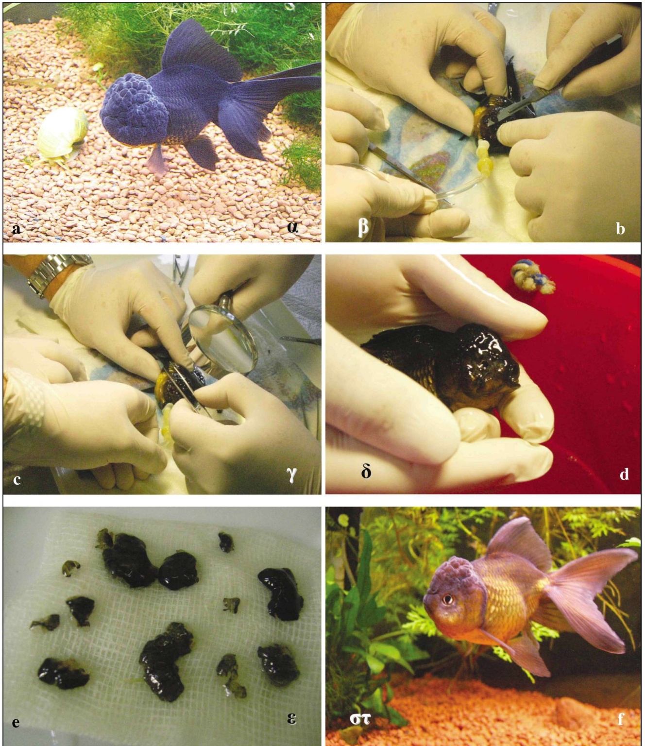
Εικόνα 1. α) Το Oranda πριν από τη χειρουργική επέμβαση με υπερμεγέθεις δερματικές πτυχές στην κεφαλή, β) διεγχειρητική χορήγηση αναισθητικού με καθετήρα, γ) έλεγχος της εκτομής των πτυχών με μεγεθυντικό φακό, δ) το Oranda μετά το πέρας της επέμβασης και πριν από την ανάνηψη, ε) τεμάχια δείγματος που αφαιρέθηκαν και εξετάστηκαν ιστολογικώς, στ) το Oranda 15 ημέρες μετά την επέμβαση.

Figure 1. a) Oranda goldfish prior to surgery, b) administration of anaesthetic using a tube, c) observing the excision of the skin using a magnifying glass, d) Oranda goldfish after the operation and before recovery, e) excised skin tissues used for histological examination, f) goldfish Oranda 15 days after surgery.