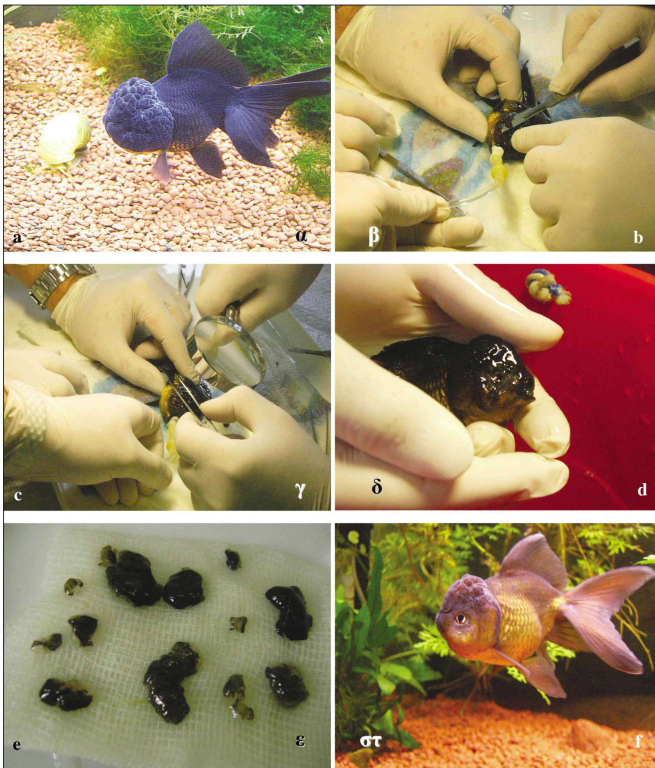
Εικόνα 1. α) Το Oranda πριν από τη χειρουργική επέμβαση με υπερμεγέθεις δερματικές πτυχές στην κεφαλή, β) διεγχειρητική χορήγηση αναισθητικού με καθετήρα, γ) έλεγχος της εκτομής των πτυχών με μεγεθυντικό φακό, δ) το Oranda μετά το πέρας της επέμβασης και πριν από την ανάνηψη, ε) τεμάχια δείγματος που αφαιρέθηκαν και εξετάστηκαν ιστολογικώς, στ) το Oranda 15 ημέρες μετά την επέμβαση.

Figure 1. a) Oranda goldfish prior to surgery, b) administration of anaesthetic using a tube, c) observing the excision of the skin using a magnifying glass, d) Oranda goldfish after the operation and before recovery, e) excised skin tissues used for histological examination, f) goldfish Oranda 15 days after surgery.