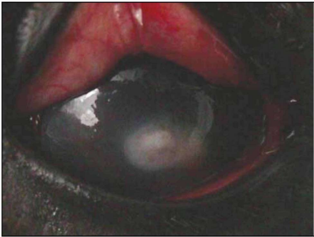
Εικόνα 1. Οίδημα κερατοειδούς και παρουσία υπόπτων σε περιστατικό οξείας ραγοειδίτιδας σε άλογο (δική μας περίπτωση).

Τέλος, το πρωτόζωο Toxoplasma gondii , που έχει τελικό ξενιστή τη γάτα (Lavach 1990, Schwink 1992), μπορεί να προκαλέσει ραγοειδίτιδα ύστερα από τη μηχανική διεύθυνση κατά τη διάρκεια της μετανάστευσης των ταχυζωϊτών του ή λόγω της ανοσολογικής αντίδρασης στα διάφορα αντιγόνα του.