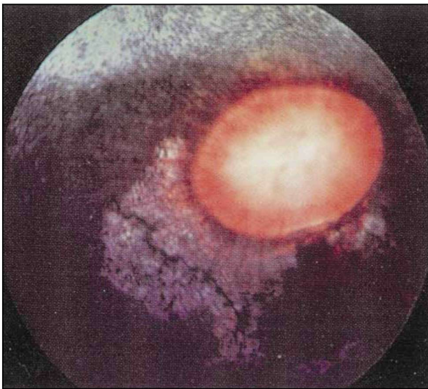
Εικόνα 3. Αποχρωματισμός (εκφύλιση) του αμφιβληστροειδή χιτώνα σε σχήμα «πεταλούδας» γύρω από τον οπτικό δίσκο σε άλογο με ΥΡ (K.C. Barnett 1990).

τιδα. Τίτλος από 1/400 και πάνω υποδηλώνει προηγούμενη μόλυνση από λεπτόσπειρες, αν και η εξέταση θα πρέπει να επαναλαμβάνεται μετά από 2-4 εβδομάδες (Schwink 1992). Η ορολογική αυτή εξέταση καλό είναι να γίνεται ταυτόχρονα και στο υδατοειδές υγρό, ενώ η δοκιμή PCR για την ανίχνευση του ίδιου του βακτηριδίου μέσα στον οφθαλμό παίζει καθοριστικό ρόλο. Η παρακέντηση του πρόσθιου θαλάμου για τη λήψη υδατοειδούς υγρού πρέπει να περιορίζεται σε ειδικές περιπτώσεις εξαιτίας των δυσμενών επιπτώσεών της στο φλεγμαίνοντα οφθαλμό (ύφαιμα, ρήξη πρόσθιου περιφάκιου, βλάβη του ενδοθηλίου, γλαύκωμα) (Gelatt 1999).