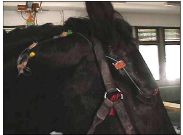
Εικόνα 4. Τοποθέτηση υποβλεφαρικού καθετήρα για την εντατική τοπική χορήγηση οφθαλμικών σκευασμάτων (δική μας περίπτωση).

Η θεραπεία εφόδου επιβάλλεται προκειμένου να αποκατασταθεί η μειωμένη όραση ή έστω να αποφευχθεί η τύφλωση του ζώου. Η τελευταία συνήθως οφείλεται στη δημιουργία οπίσθιων συνεχειών, στον καταρράκτη και στην ατροφία του αμφιβληστροειδή χιτώνα. Σκοπός της θεραπείας είναι η διατήρηση της όρασης, η αντιμετώπιση του