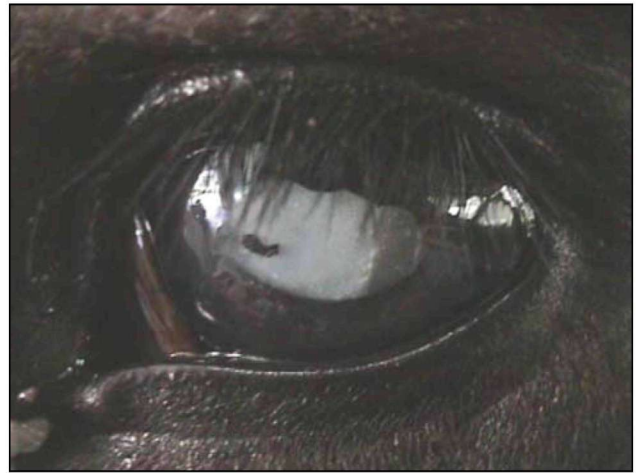
Εικόνα 2. Δευτερογενής καταρράκτης και ανάπτυξη οπίσθιων συνεχειών σε άλογο με χρόνια ραγοειδίτιδα. Διακρίνεται η εναπόθεση μελανίνης στο πρόσθιο περιφάκιο (δική μας περίπτωση).

Τα συμπτώματα της ΥΡ, που ποικίλουν ανάλογα με το στάδιο εξέλιξης της νόσου, συνήθως αφορούν στον έναν οφθαλμό και μόνο στο 20% των περιστατικών έχουν αμφοτερόπλευρη εντόπιση (Brooks 2002). Στο οξύ στάδιο παρατηρούνται βλεφαρόσπασμος, φωτοφοβία, δακρύρροια, πόνος, προβολή του τρίτου βλεφάρου, συμφόρηση του σκληρού χιτώνα και του επιπεφυκότα, οίδημα του κερατοειδούς, θολερότητα του υδατοειδούς υγρού και υπόπτων (εικόνα 1), μύση, πάχυνση και διήθηση της ίριδας, ανάπτυξη πρόσθιων και οπίσθιων συνεχειών, εναπόθεση ινικής και χρωστικής στο πρόσθιο περιφάκιο, μείωση της ενδοφθάλμιας πίεσης και χοριοειδίτιδα με εστιακή ή διάχυτη αποκόλληση του αμφιβληστροειδή χιτώνα, που συνήθως εντοπίζεται στο μη ταπητιακό βυθό (Mathews και