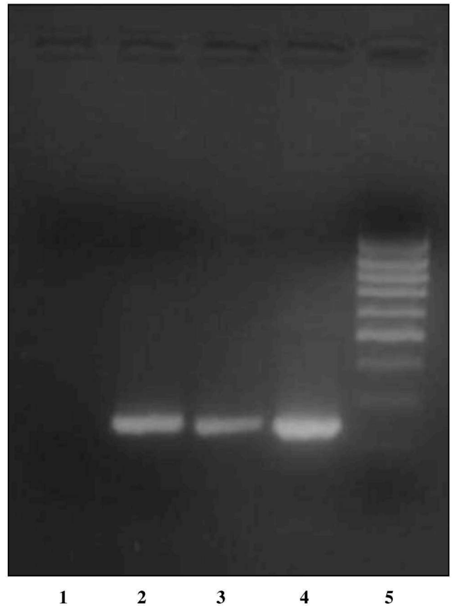
Εικόνα 3. Ανίχνευση ιϊκού RNA με nested RT-PCR. Θέση 1: αρνητικός μάρτυρας, Θέση 2 ~ 4: εγκέφαλοι ιχθύων, Θέση 5: Δείκτης μοριακών βαρών (100-1000 ζβ).

Σε αντίθεση με τα ευρήματα αυτά, συγγραφείς (Thiery et al., 1999β) αναφέρουν δύο απομονώσεις του