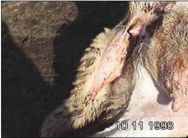
Εικόνα 3. Φλύκταινες και εφελκίδες στο εσωτερικό της ουράς και στο μαστό Figure 3. Vesicles and crusts on the inner surface of the tail and the udder.