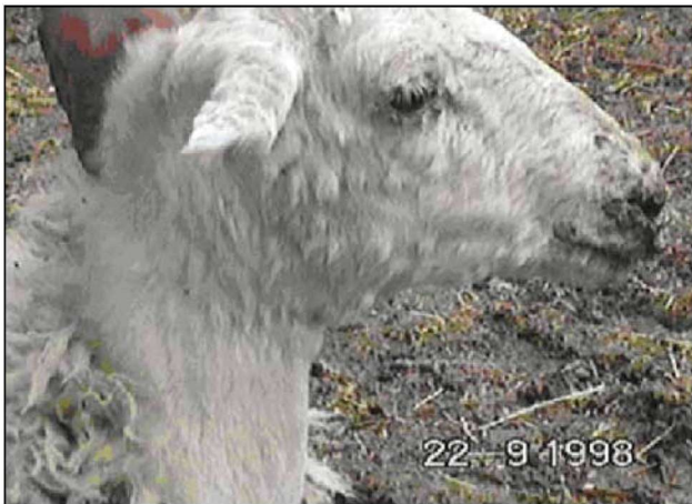
Εικόνα 4. Οξίδια στην κεφαλή και τα αυτιά, εφελκίδες στα χείλη, δακρύρροια. Figure 4. Nodules at head and ears, crusts at lips, lacrimation.