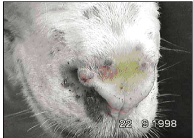
Εικόνα 6. Φλύκταινες στη μύτη προβάτου. Figure 6. Vesicles at the nose of the sheep.