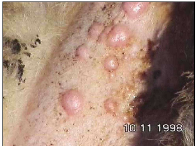
Εικόνα 2. Φλύκταινες στο εσωτερικό της ουράς

Figure 1. Conjunctivitis, lacrimation, nasal secretions, photophobia, depression.