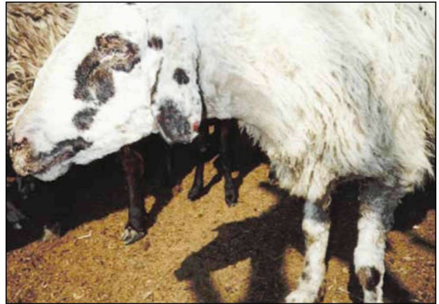
Εικόνα 1. Επιπεφυκίτιδα, δακρύρροια, ρινικό έκκριμα, φωτοφοβία, κατάπτωση.

Οι αλλοιώσεις είναι καλύτερα εμφανείς στα άτριχα μέρη του σώματος, την κοιλιά, τις μασχάλες, το μαστό, το λαιμό, το περίνεο, τα εξωτερικά γεννητικά όργανα, τα χείλη, τα βλέφαρα και το εσωτερικό μέρος της ουράς. Στα σημεία αυτά διαπιστώνεται η εμφάνιση κηλίδων και βλατίδων που έχουν κόκκινο χρώμα. Στο στάδιο αυτό παρατηρούνται διεσπαρμένα ερυθρά στίγματα στα σημεία του