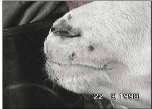
Εικόνα 5. Εφελκίδες στο άνω χείλος και στη μύτη προβάτου. Figure 5. Crusts at the upper lip and the nose of the sheep.