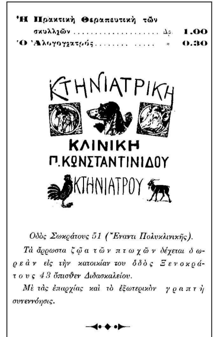
Εικόνα 7. Το οπισθόφυλλο του Αγελαδάρο κτηνιάτρους, είχαν ως αντικείμενο την Ιπποθεραπευτική και την Ιππολογία 21 .

Από διαφημιστικές αγγελίες των εσωφύλλων και των οπισθοφύλλων των δύο τελευταίων του βιβλίων λαμβάνο-