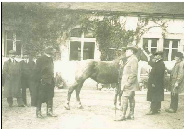
Εικόνα 8. Η τελευταία φωτογραφία του Π.Κ. Το 1912, ως μέλος Επιτροπής Ιππωνείων στο Εξωτερικό, για την επείγουσα προμήθεια μονόπλων, εν όψει των Βαλκανικών πολέμων.