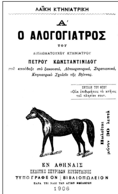
Εικόνα 5. Το δεύτερο κατά σειρά βιβλίο του Π.Κ. Έχει διαστάσεις 18X12 και 66 σελίδες