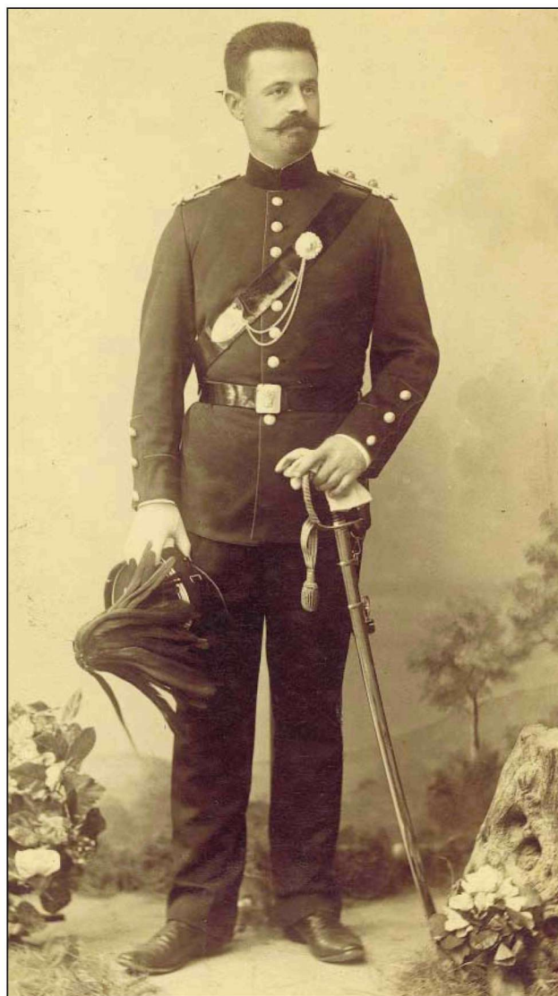
Εικόνα 3. Ο Π.Κ. ως υπολοχαγός με επίσημη στολή.

Κατά την εποχή εκείνη γίνονταν, επίσης, αξιόλογες προσπάθειες για τη μόρφωση των ασθενέστερων οικονομικώς τάξεων με την έκδοση ωφελίμων βιβλίων. Η στάθ-