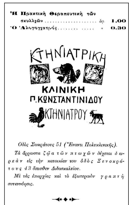
Εικόνα 7. Το οπισθόφυλλο του Αγελαδάροη κτηνιάτρους, είχαν ως αντικείμενο την Ιπποθεραπευτική και την Ιππολογία 21 .

Από διαφημιστικές αγγελίες των εσωφύλλων και των οπισθοφύλλων των δύο τελευταίων του βιβλίων λαμβάνο-