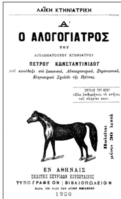
Εικόνα 5. Το δεύτερο κατά σειρά βιβλίο του Π.Κ. Έχει διαστάσεις 18X12 και 66 σελίδες