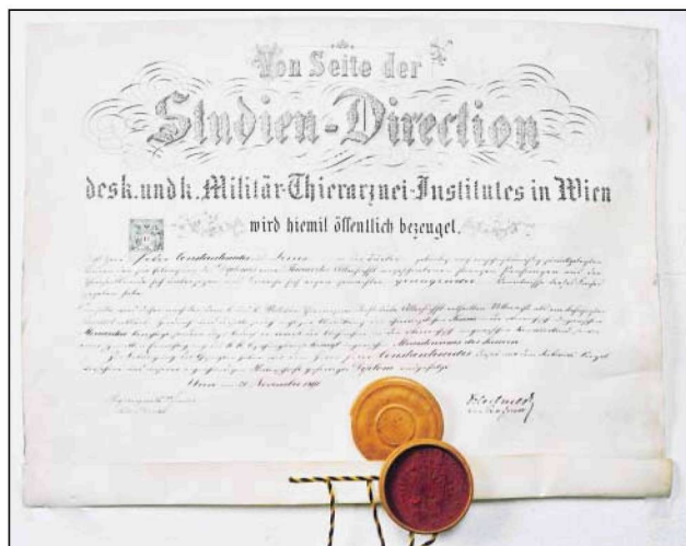
Εικόνα 2. Το πτυχίο του Π.Κ. Βρίσκεται σε πολύ καλή κατάσταση χάρις στο κυλινδρικό από σκληρό χαρτόνι κάλυμμα του. Αξιοσημείωτη είναι η περίτεχνη ξυλόγλυπτη σφραγίδα του γνησιότητας. Ήδη κοσμεί την αίθουσα διαλέξεων της Ε.Κ.Ε.

ο αριθμός τους, να είναι, για οικονομικούς λόγους πάντα πολύ μικρός.