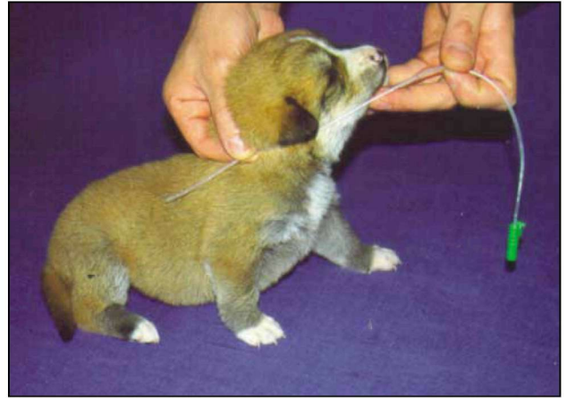
Εικόνα 5. Χορήγηση τροφής με στομαχικό καθετήρα: προσδιορισμός του μήκους του καθετήρα.