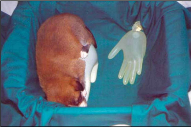
Εικόνα 2. Φωλιά νεογνού θερμαινόμενη με χειρουργικά γάντια