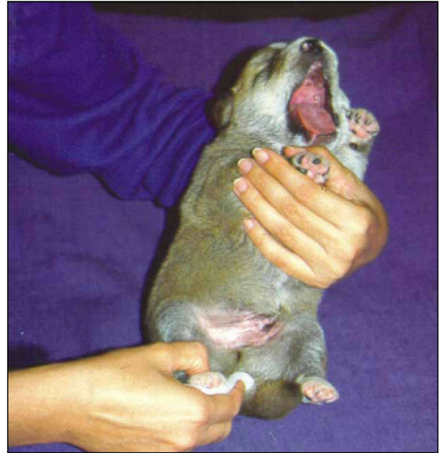
Εικόνα 8. Καθαρισμός νεογνού.

Η ενδεδειγμένη καθαριότητα των νεογνών είναι σημαντική. Οι μάλαξεις της πρωκτικής και περιγεννητικής περιοχής, εκτός του ότι υποβοηθούν την ούρηση και την αφόδευση, συμβάλλουν και στην καθαριότητα της περιοχής. Επίσης, απαιτείται καθάρισμα της κεφαλής με βρεγμένο ύφασμα μετά από κάθε γεύμα, ώστε να απομακρύνεται κάθε ίχνος γάλακτος. Επιπλέον, δύο φορές την εβδομάδα