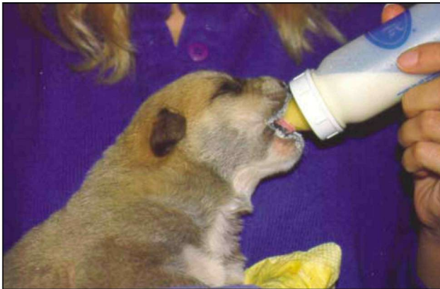
Εικόνα 4. Χορήγηση τροφής με θήλαστρο