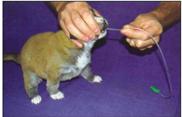
Εικόνα 6. Χορήγηση τροφής με στομαχικό καθετήρα: εισαγωγή του καθετήρα

Για τη χορήγηση του υποκατάστατου γάλακτος, το νεογνό συγκρατείται σε όρθια θέση, παρόμοια με αυτή που λαμβάνει κατά το θηλασμό της μητέρας του (Εικόνα 4). Σε καμιά περίπτωση δεν πρέπει να συγκρατείται σε ύπτια στάση, επειδή ο κίνδυνος εισρόφησης είναι μεγάλος. Η φιάλη πρέπει να βρίσκεται σε κατακόρυφη θέση, για την αποφυγή κατάποσης αέρα 1 . Πριν από την τοποθέτηση της θηλής στο στόμα του νεογνού, αυτή πιέζεται ελαφρώς για να εξέλθει μικρή ποσότητα γάλακτος. Από τη στιγμή εκείνη, η φιάλη δεν ξαναπιέζεται, επειδή υπάρχει κίνδυνος εισρόφησης 12 . Η χορήγηση υποκατάστατου γάλακτος με φιάλη, αν και απλή, είναι χρονοβόρα, ενώ, ορισμένα ζώα δε δέχονται να θηλάσουν και άλλα "πνίγονται". Στις περιπτώσεις αυτές, καθώς και όταν το αντανακλαστικό του θηλασμού δεν είναι ισχυρό ή απουσιάζει, η χορήγηση του υποκατάστατου γάλακτος πρέπει να γίνεται με σύριγγα ή με στομαχικό καθετήρα 12 .