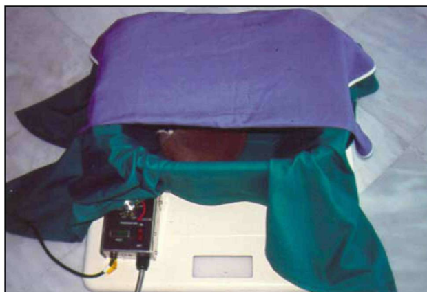
Εικόνα 1. Φωλιά νεογνού θερμαινόμενη με ηλεκτρική θερμοφόρα.

μοκρασίας της φωλιάς, ιδιαίτερα κατά τις πρώτες επτά ημέρες από τη γέννηση, πρέπει να γίνεται με ακρίβεια, επειδή τα νευρομυϊκά αντανακλαστικά των νεογνών δεν είναι αναπτυγμένα, με αποτέλεσμα να μην μπορούν να απομακρυνθούν από μία πολύ ζεστή περιοχή και συνεπώς να υπάρχει κίνδυνος εγκαύματος 11 .