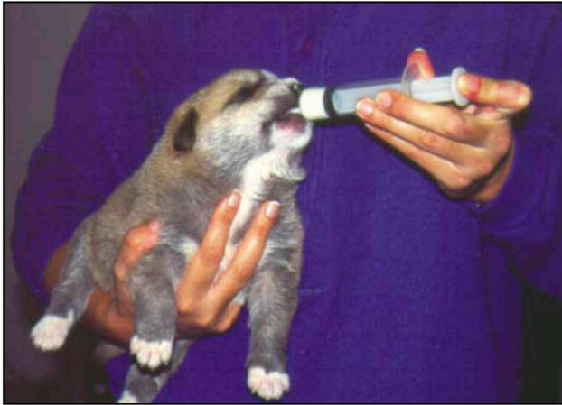
Εικόνα 3. Χορήγηση τροφής με σύριγγα