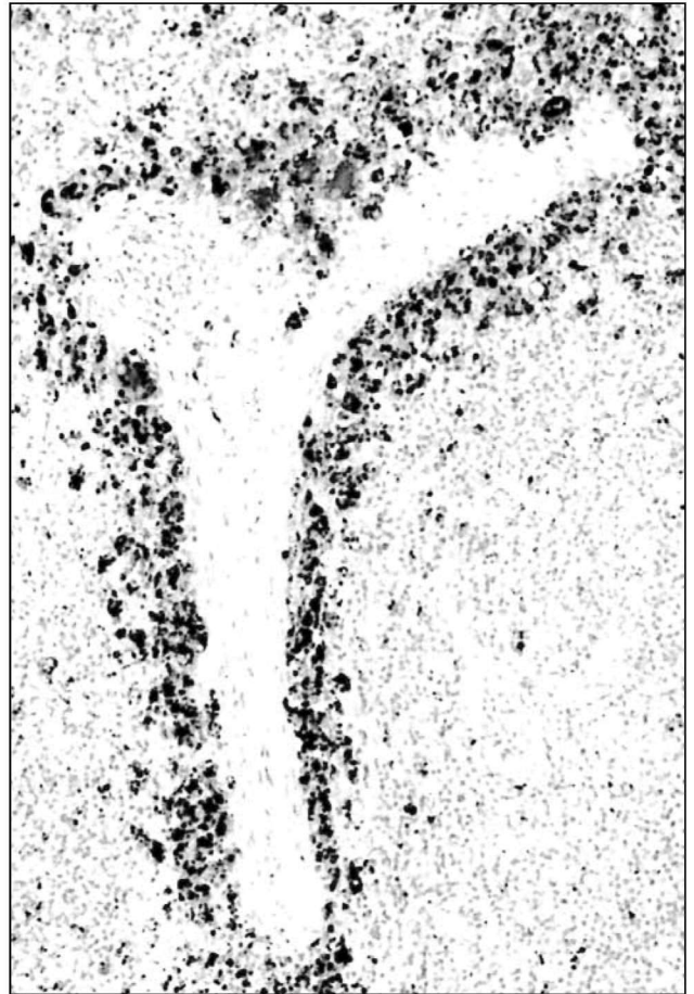
Εικόνα 3. Σπλήνας χοιριδίου με ΠΣΑΑΧ. Διαπιστώνεται άφθονο πυρηνικό οξύ του PCV2 στο κυτταρόπλασμα των μακροφάγων των κοιλωδών τριχοειδών. Τεχνική in situ μοριακού υβριδισμού.

Figure 3. Spleen from a pig with PMWS. There is abundant PCV2 nucleic acid in sinusoidal macrophages. In situ hybridization technique.