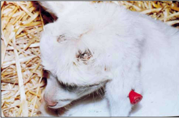
Εικόνα 1. Ερίφιο μετά την αποκεράτωση. Figure 1. Goat kid after thermal disbudding.

κατήφεια, ανορεξία, απαθές βλέμμα, αδυναμία στήριξης των άκρων, παραπληγία. Ένα ερίφιο εμφάνιζε τριγμό των οδόντων και ένα άλλο τύφλωση.