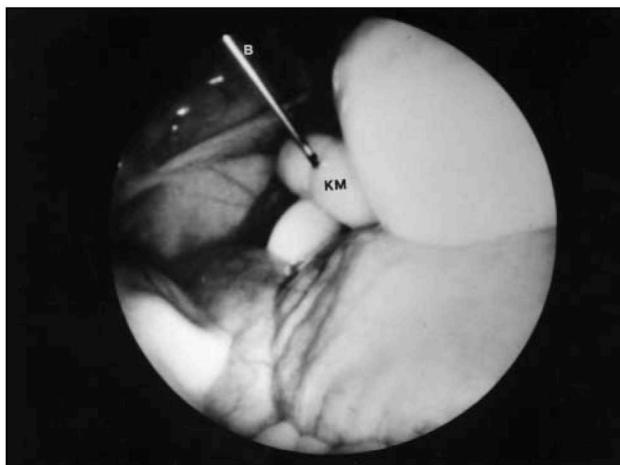
Εικόνα 2. Έγχυση του σπέρματος στον αυλό του κέρατος της μήτρας υπό παρατήρηση μέσω ενδοσκοπίου. Διακρίνονται, η βελόνα σπερματέγχυσης (Β) και το κέρασ της μήτρας (ΚΜ).

Enzersdorf, Αυστρία), η οποία ήταν συνδεδεμένη με σύριγγα 1 ml (εικ.1). Στον αυλό κάθε κέρατος γινόταν έγχυση 0,3 ml νωπού αραιωμένου σπέρματος (εικ. 2). Για να αποφευχθεί η έγχυση του σπέρματος στο ενδομήτριο, καθώς και η ολική διάτρηση του κέρατος η βελόνα ήταν σημαδεμένη σε απόσταση 0,5 cm από την αιχμή της.