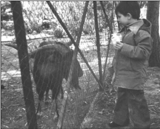
Φώτο 3. Τράγος “φουριάρικος”, Κρι-κρι x ντόπια.

ήμερων αιγών, αλλά δεν μπορούμε να αποκλείσουμε και τις άγριες, της οποίας τα παράγωγα μετά εξημερώθηκαν. Πιθανότατα να έγινε κατά τους αρχαίους χρόνους και σε περιοχή με κάποια αιγοτροφική υποδομή και όπου η αίγα βρισκόταν σε εκτίμηση. Τέτοια περιοχή ήταν αυτή της Ανατολικής Μεσογείου. Οι Ασσύριοι, Βαβυλώνιοι, Αιγύπτιοι, Έλληνες κ.λπ. είχαν νόμους που προστάτευαν την αίγα 37 . Απειρες απεικονίσεις ήμερων αιγών υπάρχουν στις περιοχές αυτές, που ανάγονται, μέχρι και την 4η χιλιετηρίδα π.Χ. στην Αίγυπτο 9 . Μια από τις τέσσερις φυλές που υπάρχουν στην Αθήνα προ του Σόλωνα ονομάζονται αιγικορείς, δηλαδή αιγοβοσκοί. Παράγωγα της διασταύρωσης αυτής μεταφέρθηκαν στην περιοχή των Αλπεων, όπου και διαμορφώθηκε η φυλή Αλπίν. Η μεταφορά αυτή έγινε δια μέσου των οδών μετακίνησης των ανθρωπίνων ομάδων προς την Ευρώπη. Δηλαδή την κοιλάδα του Δούναβη ποταμού 36 και των βορειών παραλίων της Μεσογείου 6 . Αίγαγρος, απ ό,τι γνωρίζουμε, στις Αλπεις δεν υπήρχε.