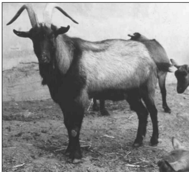
Φώτο 2. Ο τράγος φυλής Αλπίν.

στηρίζουν, ότι η άγρια αίγα των Γιούρων, Capra dorcas Reichenau, είναι το τελευταίο κατάλοιπο της άγριας Capra prisca 3,6 .