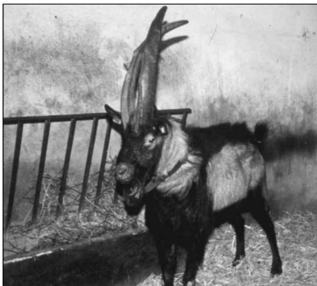
Φώτο 1. Ο τράγος 76367.