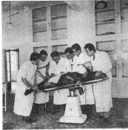
Πεμπτοετής φοιτητῆς ἐξασκούμενος εἰς τὴν αἰθούσαν τοκετῶν τῆς νέας Κλινικῆς.

Παρατίθενται φωτογραφίαι ληφθεῖσαι κατὰ τὴν ἐξάσκησιν τῶν φοιτητῶν ἐν τοῖς ἐργαστηρίοις τῆς Μαιευτικῆς Κλινικῆς.