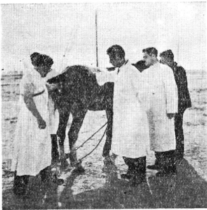
Ἐξάσκησης τῶν φοιτητῶν εἰς τὴν στειρότητα τῶν φορβάδων.