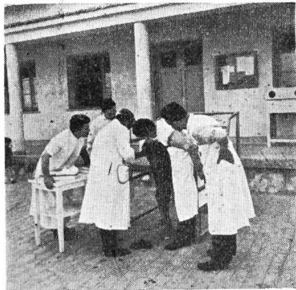
Ἐξάσκησης τῶν φοιτητῶν εἰς τὴν στειρότητα τῶν ἀγελάδων εἰς τὰ νέα κτίρια τῆς Μαιευτικῆς Κλινικῆς.

ρους. Ἦδη καταρτίζονται τὰ σχέδια συμπληρώσεως τῆς ὡς ἄνω Κλινικῆς καὶ ἀνεγέρσεως τῆς Παθολογικῆς Κλινικῆς, τῆς Κλινικῆς μικρῶν ζώων, τῆς Αἰθούσης νεκροτομῶν, Ἀμφιθεάτρου κλπ.