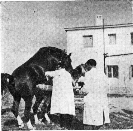
Ἐξάσκησης τῶν φοιτητῶν εἰς τὴν σπερματοληψίαν τῶν μονόπλων μὲ τὸν τεχνητὸν κόλπον τύπου Cambridge.

τοκετῶν, Ἐργαστήριον Ἀσκήσεως Φοιτητῶν, Ἐργαστήριον παθολογίας μαστοῦ, Ἐργαστήριον Τεχνητῆς Σπερματεγχύσεως, Ἐργαστήριον παθολογίας ἀναπαραγωγῆς, Αἴθουσαν Μουσείου καὶ λοιποὺς βοηθητικοὺς χώ-