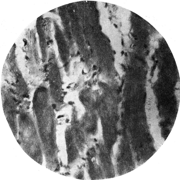
Μικροφωτογράφημα Νο 1.—Ἡ εἰκὼν παριστᾷ ἱστολογικὴν ἀλλοίωσιν ἐν ἣ παρατηρεῖται ἡ τελεία ἐξαφάνισις τῆς ἐγκαρσίου γραμμωτῆς κατασκευῆς τῆς μυϊκῆς ἰνός. Αἱ μυϊκαὶ ἴνες εἶναι κατακερματισμέναι καὶ ἐξοιδημέναι, οἱ πυρῆνες πυκνωτικοί. Ἦδη παρατηρεῖται ὑπερπλασία τῶν πυρῆνων τοῦ σαρκειλήματος καὶ πολλαπλασιασμός συνδετικογενῶν κυττάρων ἐντὸς τοῦ διαμέσου ἰστοῦ. Χρῶσις Αἱματοξυλίνη - Ἡωσίνη).

Ἐκ τῆς ἱστολογικῆς ἐξετάσεως τῶν ἀποσταλέντων παθολογικῶν ὑλικῶν διεπιστώθη ὅτι : Αἱ πλείσται τῶν μυϊκῶν ἰνῶν ἦσαν ἐκπεφυλισμέναι. Εἰς ταύτας παρατηρήθη τελεία σχεδὸν ἐξαφάνισις τῆς ἐγκαρσίου ὡς ἐπὶ τὸ πλεῖστον γραμμωτῆς κατασκευῆς τῆς ἰνός. (Μικροφωτογράφημα Νο 1).