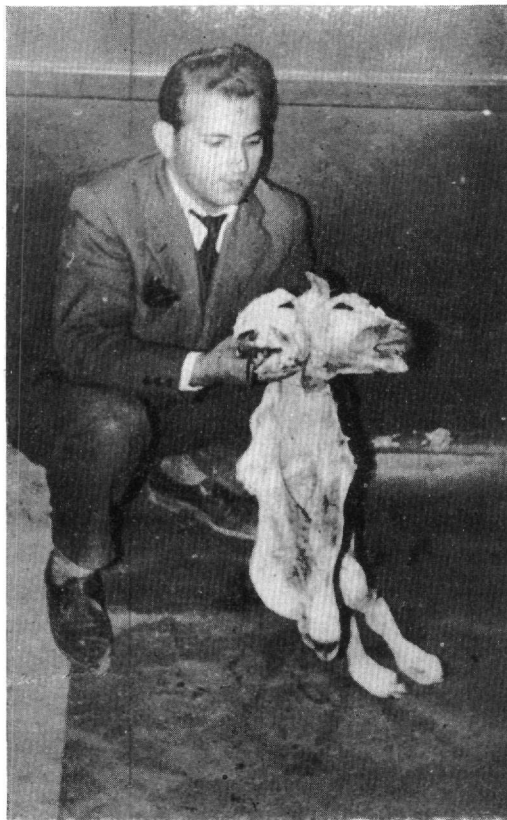
Εἰκὼν 1.—Δικέφαλον Τέρας ἐξαχθὲν κατόπιν δυστοκίας.

Αἱ δυσπλασίαι ὡς γνωστὸν ἀπὸ καθαρῶς μορφολογικῆς ἀπόψεως ἐξεταζόμεναι εἰς τὰ θηλαστικά δύνανται νὰ εἶναι μ ο ν ό σ ω μ ο ι χαρακτη-