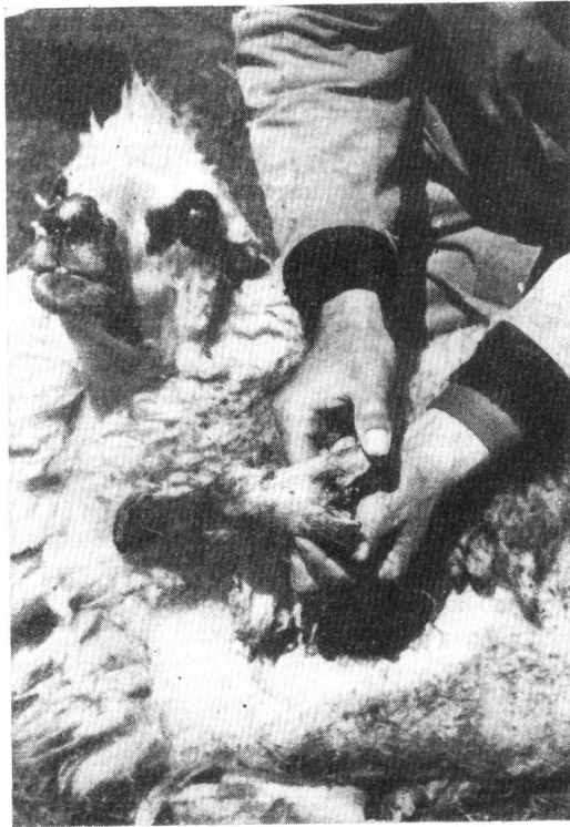
Εἰκὼν 1.—Πρόβατον προσβεβλημένον ἀπὸ τριετίαν μὲ βελτιώσεις, ἰάσεις καὶ ὑποτροπὰς. Διακρίνεται ἡ ἐξέλκωσις τοῦ μεσοδακτυλίου διαστήματος.

Ἡ νόσος προσβάλλει ὑπὸ ἐπιζωοτικὴν μορφήν μόνον τὰ Αἰγοπρόβατα. Ἐκδηλοῦται καθ' ὅλας τὰς ἐποχὰς τοῦ ἔτους, παρουσιάζουσα ἐξάρσεις κατὰ τὸ φθινόπωρον καὶ τὴν ἀνοιξιν. Ἔχει χρονίαν διαδρομὴν καὶ τάσιν πρὸς ὑπο-