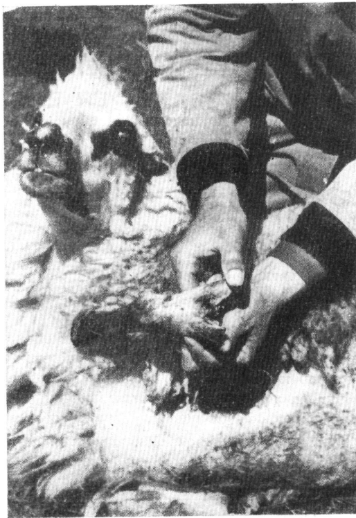
Εἰκὼν 1.—Πρόβατον προσβεβλημένον ἀπὸ τριετίαν μὲ βελτιώσεις, ἰάσεις καὶ ὑποτροπὰς. Διακρίνεται ἡ ἐξέλκωσις τοῦ μεσοδακτυλίου διαστήματος.

Ἡ νόσος προσβάλλει ὑπὸ ἐπιζωοτικὴν μορφήν μόνον τὰ Αἰγοπρόβατα. Ἐκδηλοῦται καθ' ὅλας τὰς ἐποχὰς τοῦ ἔτους, παρουσιάζουσα ἐξάρσεις κατὰ τὸ φθινόπωρον καὶ τὴν ἀνοιξιν. Ἔχει χρονίαν διαδρομὴν καὶ τάσιν πρὸς ὑπο-