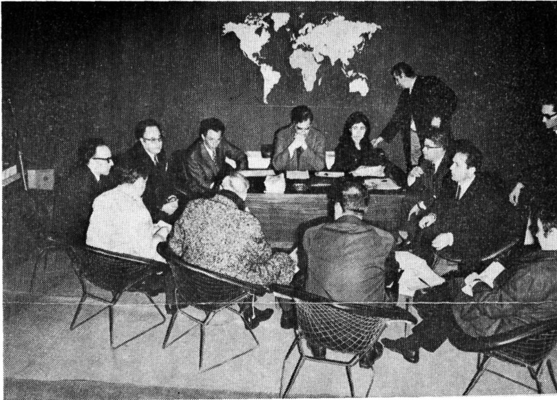
Σύσκεψις τῶν ἐκτροσώπων τῶν Διεθνῶν Ὄργανισμῶν μετὰ τῶν μελῶν τῆς ἐπιστημονικῆς ὁμάδος ἐργασίας τοῦ Υ.Β.Ε.

Τὴν Ἐκθεσιν ἐξ ἄλλου ἐπεσκέφθησαν ὁ Ὑπουργὸς τῶν Οἰκονομικῶν κ. Ἀ. Ἀνδρουτσόπουλος, οἱ Γενικοὶ Γρομματεῖς τῶν Ὑπουργείων Προεδρίας τῆς Κυβερνήσεως καὶ Βορ. Ἑλλάδος κ.κ. Κ. Παπαδόπουλος καὶ Ν. Καντώ-