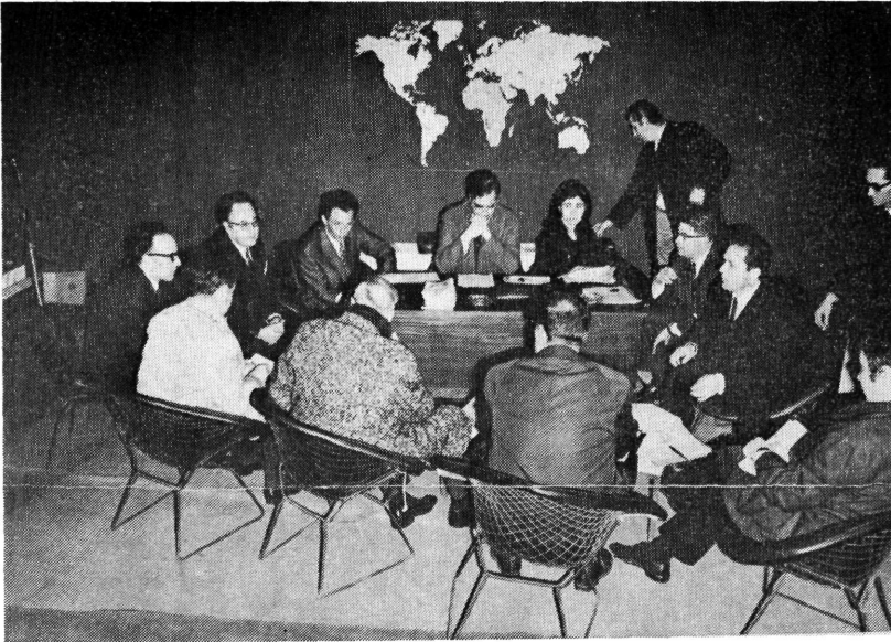
Σύσκεψις τῶν ἐκτροσώπων τῶν Διεθνῶν Ὄργανισμῶν μετὰ τῶν μελῶν τῆς ἐπιστημονικῆς ὁμάδος ἐργασίας τοῦ Υ.Β.Ε.