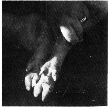
Φοτ. 1. Ἀλλοιώσεις ἄκρων χοίρου ποῦ μολύνθηκε ἐξ ἐπαφῆς μὲ τὸν ἰό τῆς Φ.Ν.Χ. Α) Ἄφθες στοὺς κύριους καὶ δευτερεύοντες δάκτυλους. Β) Οἱ ἴδιες ἄφθες διαρρηγμένες μὲ τὸ χέρι.

καταχωρήθηκε στὸ Κτηνιατρικὸ Ἰνστιτοῦτο Ἀφθώδους Πυρετοῦ μὲ τὸ κωδικό: ἰός Φ.Ν.Χ./ Ἑλλάς 79/1. Δεῖγμα τοῦ ἰοῦ αὐτοῦ, 2ης κυτταρικής διόδου, ἀπεστάλη στὸ Διεθνὲς Ἐργαστήριο Ἀναφορᾶς (Pirbright Ἀγγλία) γιὰ ἐπιβεβαίωση. Ὁ Δ/ντης τοῦ Ἰδρύματος Δρ. Brooksby μὲ ἐπιστολὴ ἀπὸ 7/9/1979 συμφωνεῖ μὲ τὴ διάγνωσή μας 19 .