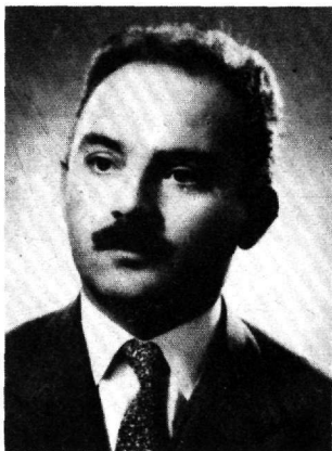
ΑΓΓΕΛΟΥ Π. ΑΝΔΡΙΟΠΟΥΛΟΥ

Ὁ ἀδόκητος θάνατος τοῦ ἐκλεκτοῦ καὶ λαμπροῦ ἐκπροσώπου τῆς Κτηνιατρικῆς Ἐπιστήμης μας, Ἀγγέλου Ἀνδριοπούλου, ποῦ πέθανε ξαφνικὰ στίς 4 Μαΐου 1981, ἦταν μιὰ βαρειά καὶ δυσαναπλήρωτη ἀπώλεια γιὰ τὴν Κτηνιατρικὴ Ὑπηρεσία τοῦ Ὑπουργείου Γεωργίας.