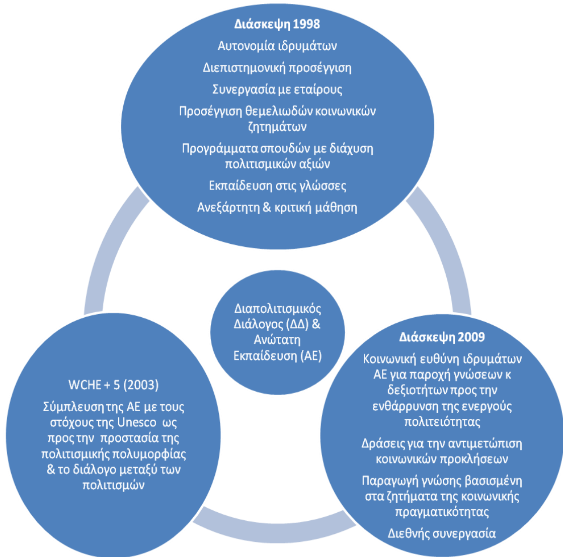
Σχήμα 1: Συνθήκες προώθησης του διαπολιτισμικού διαλόγου στην εικοσαετή ατζέντα της UNESCO για την Ανώτατη Εκπαίδευση (1998-2017)