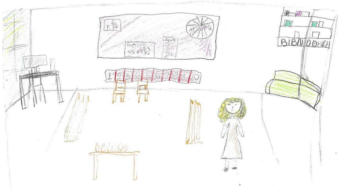
Εικόνα 4. Το συγκεκριμένο σχέδιο είναι το μοναδικό στο οποίο δεν απεικονίζονται παιδιά

των φοιτητριών δεν γίνεται καμία αναφορά στο φύλο και συνήθως χρησιμοποιούνται οι όροι «παιδιά» και «μαθητές». Το συγκεκριμένο εύρημα επιβεβαιώνεται και στην έρευνα των Woods et al. (2014) οι οποίοι επισημαίνουν ότι η μη αναφορά στο φύλο πιθανόν να υποδηλώνει έλλειψη της δέουσας προσοχής στη διαφορά. Σε 37 εικόνες (το 28%) απεικονίζονται μόνο οι φιγούρες των παιδιών, ενώ σε 9 (το 7%) μόνο το πρόσωπό τους. Στο 49% των σχεδίων ο αριθμός των παιδιών δεν ξεπερνά τα 5, ενώ σε ένα 29% των σχεδίων απεικονίζονται 6 έως 10 παιδιά και σε ένα αντίστοιχο ποσοστό περισσότερα από 10 παιδιά. Τα παιδιά συνήθως είναι περισσότερο στην τάξη και λιγότερο στον εξωτερικό χώρο, είτε όρθια και σε κίνηση είτε κάθονται σε καθίσματα ή στο πάτωμα.