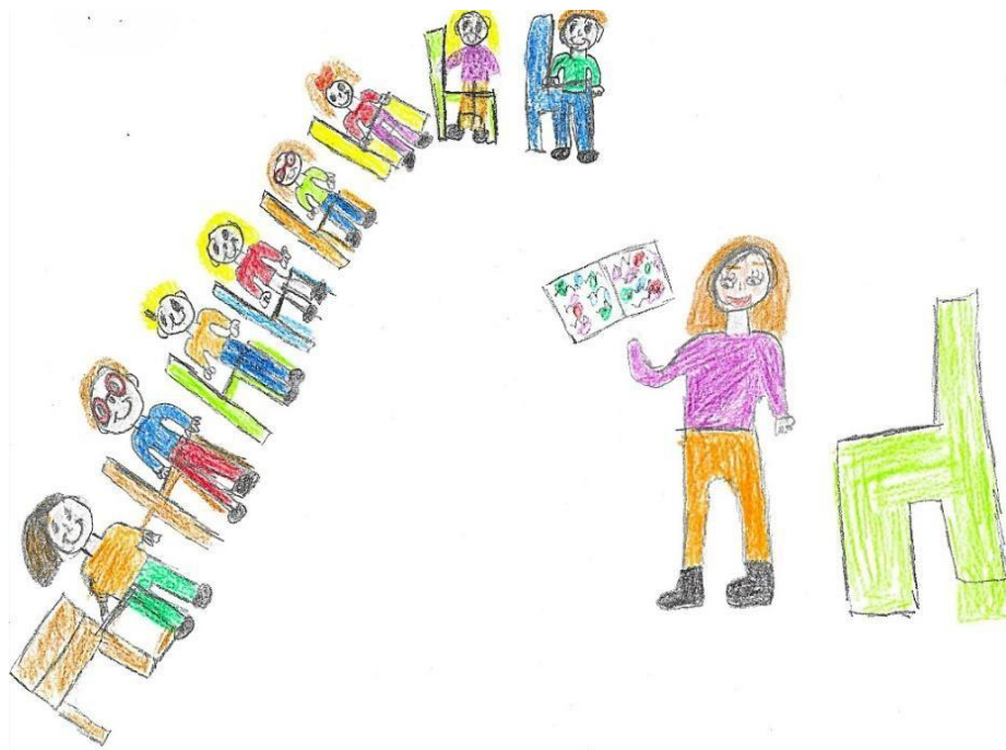
Εικόνα 7. Ο ρόλος εκπαιδευτικού και παιδιών στην εκπαιδευτική διαδικασία

Τα παιδιά απεικονίζονται να κάθονται παθητικά γύρω από τη νηπιαγωγό ή απέναντί της και να ακούνε το παραμύθι, να παρακολουθούν την παράσταση του κουκλοθέατρου που τους παρουσιάζει ή να απαντούν στις ερωτήσεις της όπως διευκρινίζεται στα γραπτά συνοδευτικά κείμενα (βλ. Εικ.7).