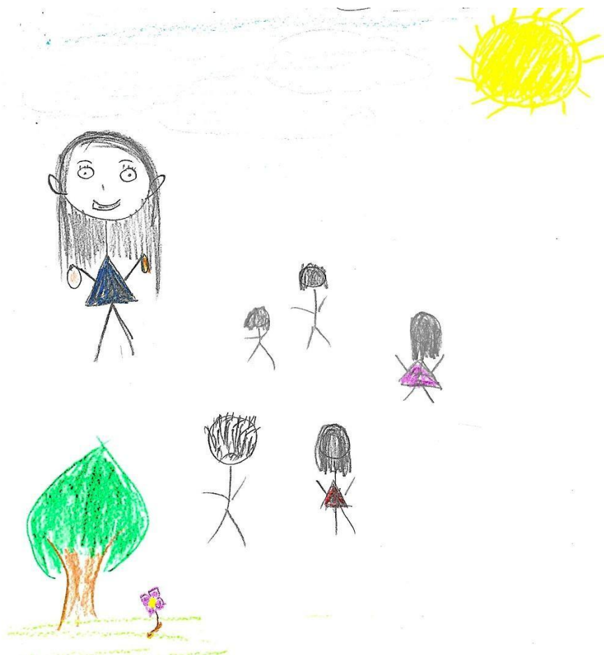
Εικόνα 3. «Η μελλοντική νηπιαγωγός που θέλω να γίνω είναι ευχάριστη, πρόσχαρη, ακούει με προσοχή τα παιδιά και γι' αυτό έχω σχεδιάσει μεγάλα αυτιά» (Σχ. 114, σχόλιο της φοιτήτριας που συνοδεύει το συγκεκριμένο σχέδιο).

περιβάλλον (Σχ. 13, 22, 29, 78, 79) όπου «όλοι/ες συνυπάρχουν δημιουργικά» (Σχ. 33) και «ακούει ο ένας την άποψη του άλλου» (Σχ. 92) ή «είναι φίλοι, δεν υπάρχουν στερεότυπα και προκαταλήψεις» (Σχ. 52) και όπου «κυριαρχεί η δημιουργικότητα και τα παιδιά είναι ελεύθερα να αναπτύξουν τη φαντασία τους» (Σχ. 71).