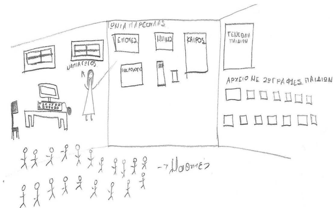
Εικόνα 6. Χαρακτηριστικό παράδειγμα παραδοσιακής εικόνας του εκπαιδευτικού