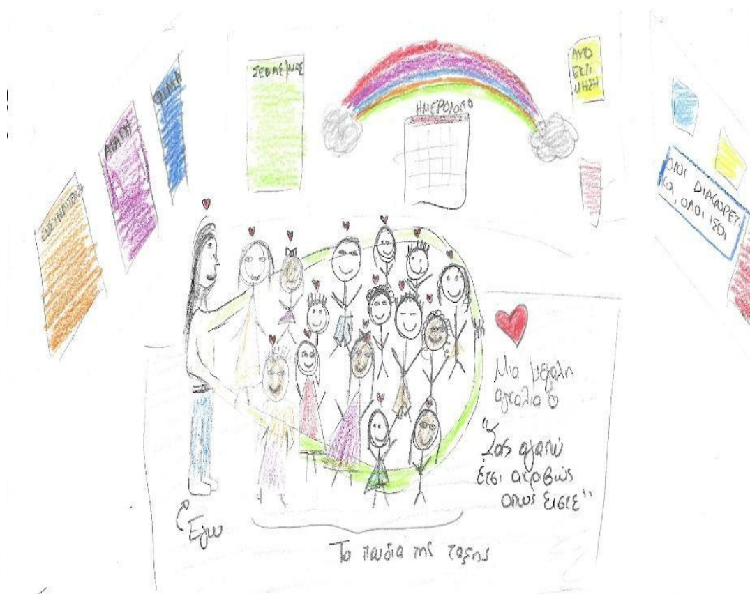
Εικόνα 5. Σχέδιο στο οποίο απεικονίζεται η διαφορετικότητα των παιδιών

να αγαπούν, να σέβονται τους άλλους και τον εαυτό τους ανεξάρτητα από τη θρησκεία, την καταγωγή, τα εξωτερικά, τα εσωτερικά χαρακτηριστικά και άλλες ομοιότητες ή διαφορές που μπορεί να έχουμε μεταξύ μας [...] Έτσι λοιπόν η αγκαλιά που απεικονίζεται στη ζωγραφιά μου συμβολίζει μια τάξη που όλοι νοιώθουν όμορφα. Αγαπούν, αγαπιούνται, αποδέχονται, γίνονται αποδεκτοί, σέβονται και τους σέβονται» (Σχ. 4)