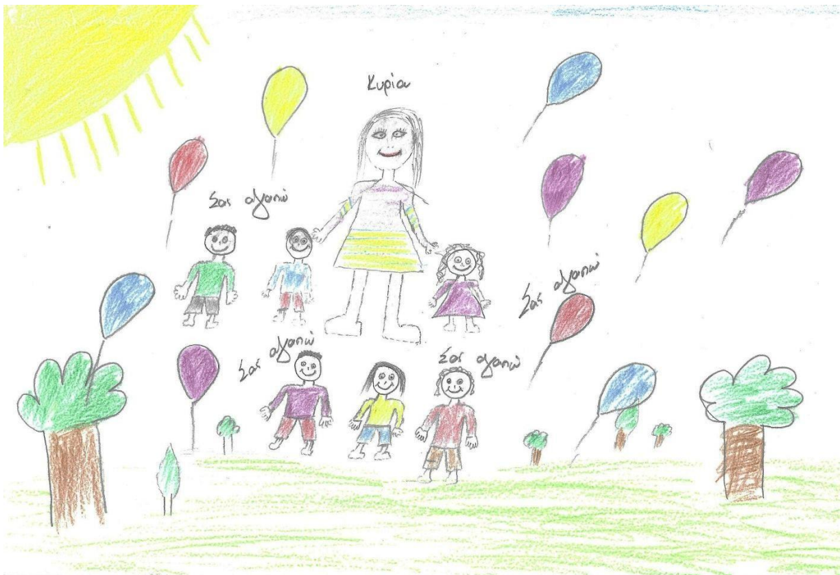
Εικόνα 2. Χαρακτηριστικό παράδειγμα σχεδίου στο οποίο αποτυπώνεται η θετική στάση και τα θετικά συναισθήματα του εκπαιδευτικού

Η πλειονότητα των εικόνων αναπαριστά τη νηπιαγωγό με θετική διάθεση (66,9%) που εκφράζεται κυρίως με το χαμόγελο. Τη θετική εικόνα συμπληρώνει η χρήση συμβόλων, όπως είναι π.χ. η καρδιά, οι μουσικές νότες, τα λουλούδια, τα μπαλόνια, τα χρώματα, ο ήλιος υποδηλώνοντας την επιδίωξη των φοιτητριών να δημιουργήσουν ένα υποστηρικτικό και ευχάριστο περιβάλλον για τα παιδιά (βλ. Εικ. 2). Παρά ταύτα, σε ένα αξιοσημείωτο ποσοστό των σχεδίων είτε απεικονίζονται ανέκφραστα πρόσωπα (το 21,8%) και πρόσωπα που μοιάζουν φοβισμένα και μελαγχολικά (ένα 2,3%), είτε δεν απεικονίζεται η έκφραση του προσώπου (το 9%). Σε κάθε περίπτωση, η μη έκφραση θετικών συναισθημάτων στα σχέδια αυτά δεν αποτυπώνεται στα γραπτά σχόλια των φοιτητριών.