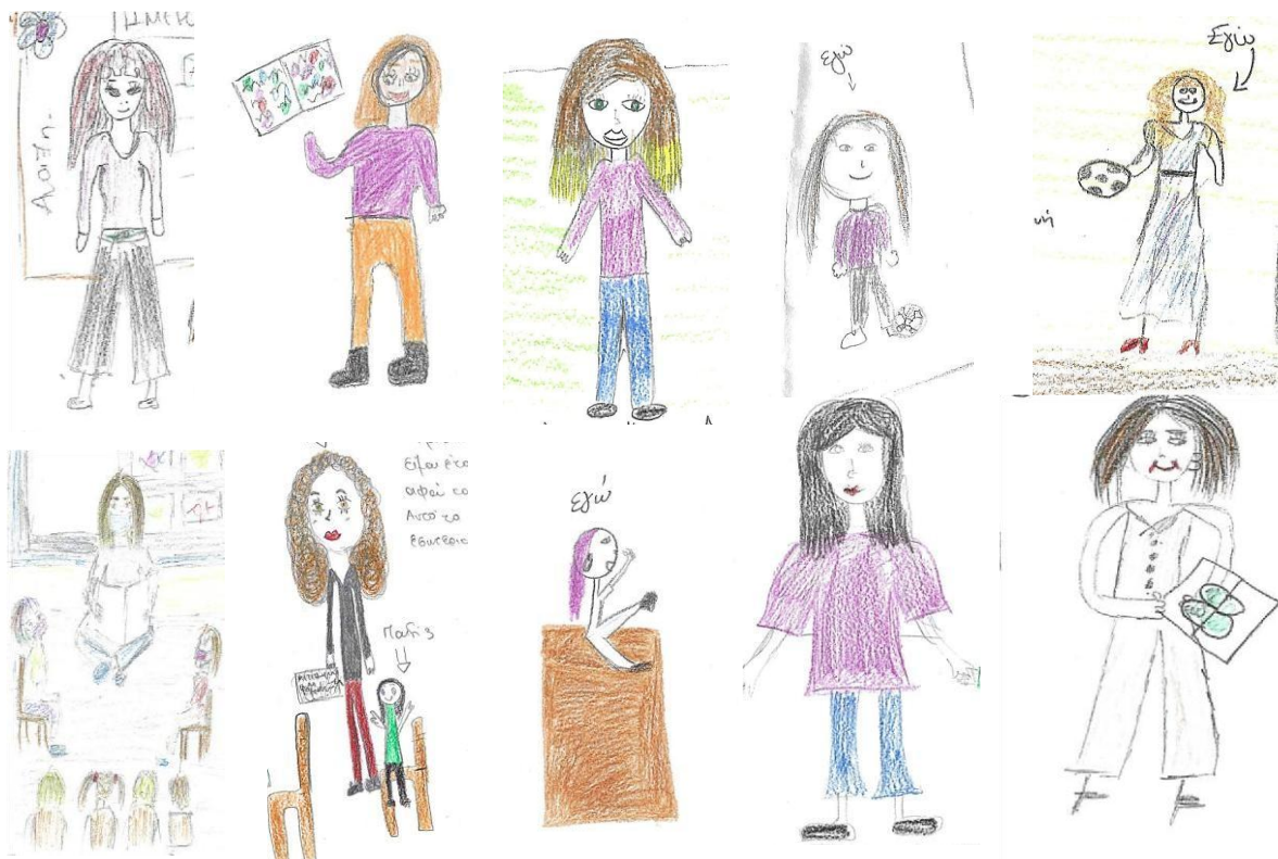
Εικόνα 1. Η εξωτερική εμφάνιση της νηπιαγωγού όπως απεικονίζεται στα σχέδια που δημιούργησαν οι φοιτήτριες

Η εικόνα του γυναικείου φύλου στα σχέδια των φοιτητριών ήταν κυρίαρχη. Σχεδόν σε όλες τις ζωγραφικές τους αναπαραστάσεις απεικονίζονται η νηπιαγωγός και τα παιδιά. Εξάιρεση αποτελούν τρεις εικόνες, στις οποίες είτε δεν υπάρχουν παιδιά είτε απεικονίζεται μόνο το χέρι της νηπιαγωγού είτε το σκηνικό εμπλουτίζεται με την παρουσία συναδέλφου νηπιαγωγού. Η φιγούρα της νηπιαγωγού απεικονίζεται σε όλα τα σχέδια ολόσωμη με εξαίρεση τρία (3) στα οποία φαίνεται μόνο το χέρι ή το πάνω μέρος του σώματός της. Σχεδόν σε όλα τα σχέδια η νηπιαγωγός έχει πολύ μεγαλύτερο ύψος από τα παιδιά ενώ σε πέντε (5) από αυτά το ύψος της δεν διαφέρει από αυτό των παιδιών. Στις περισσότερες ζωγραφικές αναπαραστάσεις η νηπιαγωγός απεικονίζεται με καθημερινό ντύσιμο και άνετα ρούχα (π.χ. παντελόνι και μπλούζα) (βλ. Εικ. 1). Σε δέκα (10) από αυτές το ντύσιμο είναι πιο κλασικό (π.χ. φόρεμα) και συνδυάζεται με κοσμήματα (κολιέ και σκουλαρίκια) ή/και τακούνια. Τα μαλλιά συνήθως είναι μακριά και ελεύθερα. Σε ορισμένα σχέδια η νηπιαγωγός φοράει γυαλιά ή μάσκα, ενδεικτικό της περιόδου που έγινε η έρευνα όπου τα μέτρα πρόληψης για την πανδημία COVID-19 εξακολουθούσαν να είναι αυστηρά. Συνήθως η νηπιαγωγός τοποθετείται στο κέντρο του σχεδίου, απεικονίζεται περισσότερο στην τάξη και λιγότερο στον εξωτερικό χώρο και σε όρθια στάση.