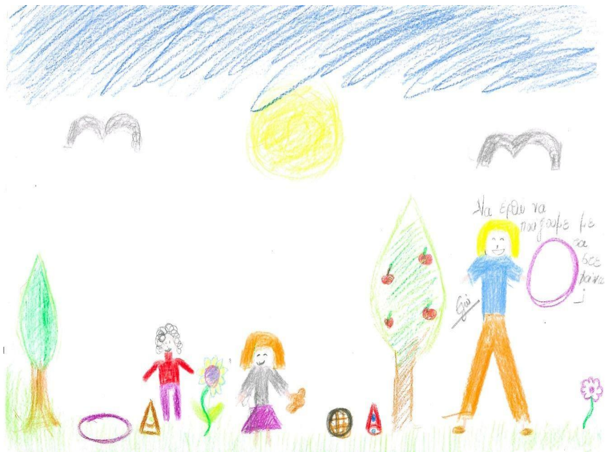
Εικόνα 8. Ο εκπαιδευτικός ως ισότιμο μέλος της ομάδας

Μια τρίτη κατηγορία αντιστοιχεί στο 21.8% του συνολικού αριθμού των εικόνων που δημιούργησαν οι φοιτήτριες απεικονίζοντας τη νηπιαγωγό να συμμετέχει σε δραστηριότητες ως ισότιμο μέλος μιας ομάδας (π.χ. συμμετέχει με τα παιδιά σε κινητικά ομαδικά παιχνίδια στην αυλή, χορεύει και τραγουδά είτε στον εσωτερικό χώρο είτε στον εξωτερικό χώρο του νηπιαγωγείου, παρατηρεί μαζί τους τα φυτά, ζωγραφίζει μαζί με τα παιδιά ή συμμετέχει σε μουσική δραστηριότητα) (βλ. Εικ. 8). Οι περισσότερες από αυτές τις δραστηριότητες εξελίσσονται στον εξωτερικό χώρο του νηπιαγωγείου κατά τη διάρκεια του διαλείμματος και το περιεχόμενό τους συνήθως αφορά τις τέχνες (π.χ. ζωγραφική, χορός, μουσική) και τη φυσική αγωγή (π.χ. κινητικό παιχνίδι).