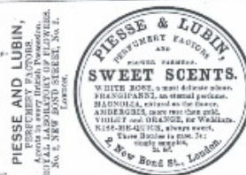
Εἰκ. 4: Δείγμα στήλης Εἰδοποιήσεις, τεύχ. 18, σ. 472 του Βρεττανικοῦ Ἀστέρρα

Οἱ υπόλοιπες στήλες καὶ ενότητες εντοπίζονται στο κάθε φύλλο σε διαφορετικὰ σημεῖα, πιθανόν ἀνάλογα με τὴ σημαντικότητά τους, τὴν ἑκτασή τους καὶ τὸ σκοπὸ που εξυπηρετοῦσαν. Χαρακτηριστικὸ παράδειγμα αποτελοῦν τὰ κείμενα που πλαισιώνονται ἀπὸ εἰκόνες καὶ αφοροῦν κυρίως σε θέματα λαογραφίας, γεωγραφίας, πολιτισμοῦ καὶ καλῶν τεχνῶν, τὰ ὁποῖα καταχωροῦνται διάσπαρτα ἐντὸς τῆς εφημερίδας, διακόπτοντας τὴ ροὴ τῶν πολιτικῶν, δικαστικῶν καὶ ἐμπορικῶν εἰδήσεων. Ἀπὸ αἰσθητικῆς πλευράς, ἡ διαφοροποίηση τῶν θεμάτων ἐπιτυγχάνεται ἀπὸ τὴν ἀπόδοση τῶν τίτλων σε κείμενα με τὸ εἶδος τῆς γραμματοσειράς που χρησιμοποιεῖται καὶ με τὸ μέγεθος τῶν χαρακτήρων.