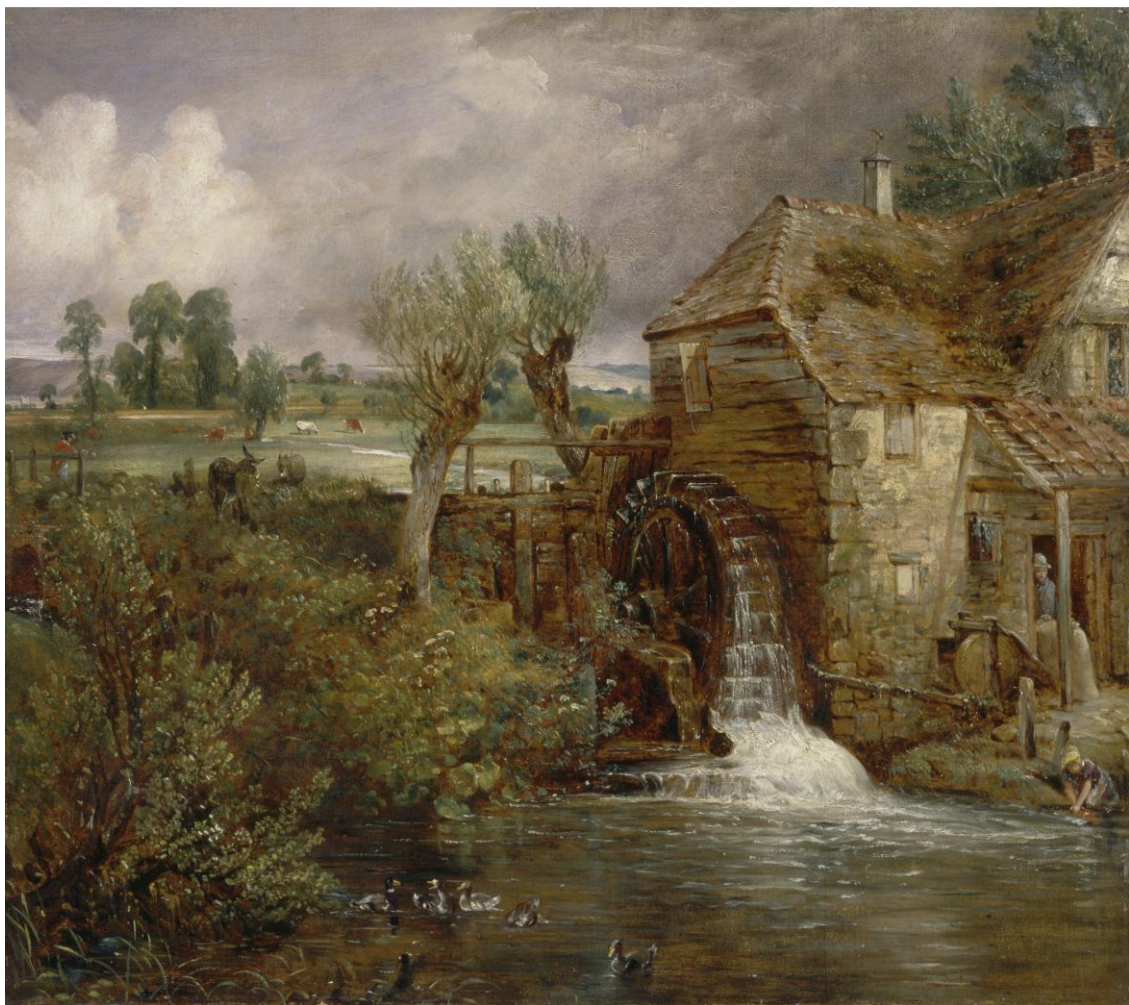
Parham's Mill, Gillingham (1826), John Constable(1776-1837). Oil on canvas. 19 3/4 x 23 3/4 inches (50.2 x 60.3 cm) Yale Center for British Art, Paul Mellon Collection http://collections.britishart.yale.edu/vufind/Record/1670671

Το στάδιο αυτό χωρίζεται σε δύο μέρη. Στο πρώτο, οι εκπαιδευόμενοι παρατηρώντας το συσχετισμό των έργων τέχνης με τα κριτικά ερωτήματα, κλήθηκαν να επιλέξουν ποιο από τα τρία θα θελαν να επεξεργαστούν αναλυτικότερα στην επόμενη φάση. Επέλεξαν τον πίνακα του John Constable, γιατί τον συνέδεσαν άμεσα με το κύριο θέμα του προγράμματος.