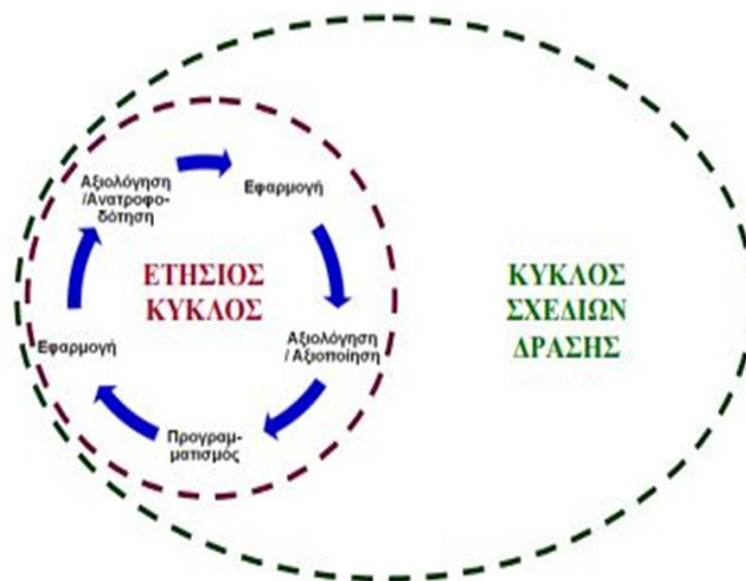
Σχήμα 3: οι δύο κύκλοι της αυτοαξιολόγησης ( http://aee.iep.edu.gr )

Τα τελευταία όμως χρόνια η αυτοαξιολόγηση διεθνώς φαίνεται ότι κινείται σε δύο κύκλους: ο ένας είναι ο κύκλος της ετήσιας λειτουργίας της σχολικής μονάδας και ο άλλος ο κύκλος των Σχεδίων Δράσης (Πασιάς, Λάμνιας, Ματθαίου κ.ά. 2012: 16).