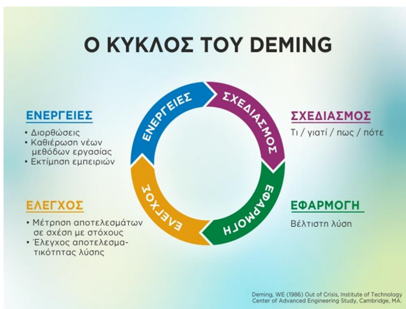
Σχήμα 2: ο κύκλος της ποιότητας του Deming ( https://e-journal.gr )

Τα τελευταία όμως χρόνια η αυτοαξιολόγηση διεθνώς φαίνεται ότι κινείται σε δύο κύκλους: ο ένας είναι ο κύκλος της ετήσιας λειτουργίας της σχολικής μονάδας και ο άλλος ο κύκλος των Σχεδίων Δράσης (Πασιάς, Λάμνιας, Ματθαίου κ.ά. 2012: 16).