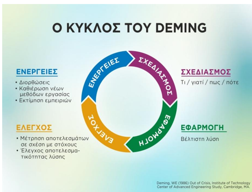
Σχήμα 2: ο κύκλος της ποιότητας του Deming ( https://e-journal.gr )

Τα τελευταία όμως χρόνια η αυτοαξιολόγηση διεθνώς φαίνεται ότι κινείται σε δύο κύκλους: ο ένας είναι ο κύκλος της ετήσιας λειτουργίας της σχολικής μονάδας και ο άλλος ο κύκλος των Σχεδίων Δράσης (Πασιάς, Λάμνιας, Ματθαίου κ.ά. 2012: 16).