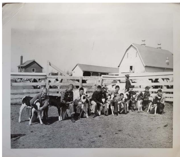
Εικόνα 10. Μια ομάδα πολιτών του Boys' Town στις φάρμες του Boys' Town.