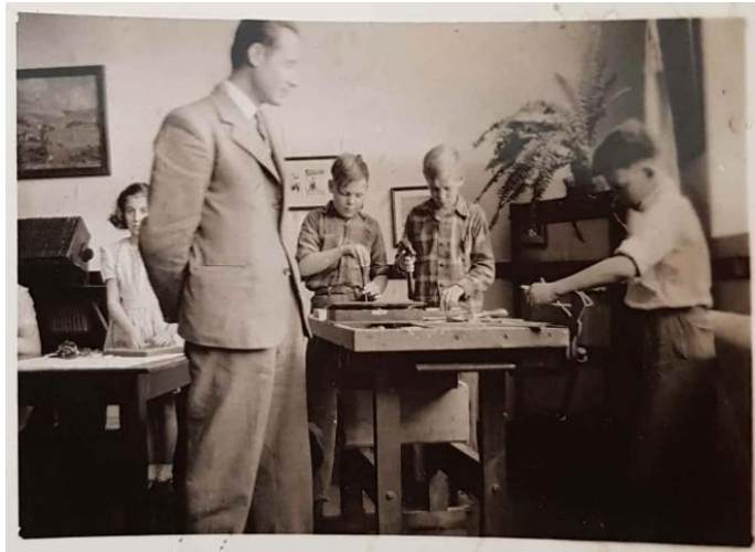
Εικόνα 6. Ξυλουργικές εργασίες εις Σωφρονιστήριο ανηλίκων εν Κεντάκη τής Αμερικής, 06 Φεβρουαρίου 1947