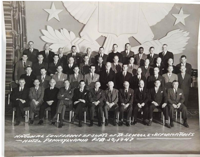
Εικόνα 9. National Conference of Superintendents of Training Schools and Reformatories held at the Hotel Pennsylvania on February 20, 1947.

(Annual Conference for Superintendents of Training and Reformatory Schools)