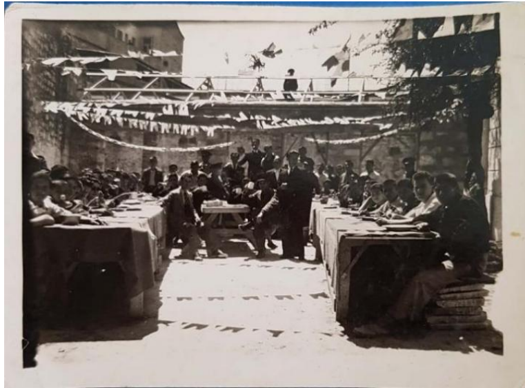
Εικόνα 2. Πάσχα, 1946. Σωφρονιστήρια Ανηλίκων Πατρών.

Από το 1946 ως το 1952 περιόδευσε σε σωφρονιστικά ιδρύματα του εξωτερικού και συγκεκριμένα της Αγγλίας και της Αμερικής. Διακρίθηκε για την καινοτόμο και ανθρωπίνη προσέγγισή του στην αντιμετώπιση των νεαρών κρατουμένων και αυτή του η συμπεριφορά έθεσε τις βάσεις για τα μετέπειτα ταξίδια του. Οι ημερολογιακές του αποτυπώσεις αποτελούν την αφήγηση σημαδιακών εμπειριών που καθόρισαν την πορεία της ζωής του τα επόμενα χρόνια. Έτσι, όταν ο Οργανισμός Περιθάλψης και Αποκατάστασης των Ηνωμένων Εθνών , ή UNRRA (United Nations Rehabilitation and Relief Administration) , όπως είναι ευρύτερα γνωστός, αντιλήφθηκε το έργο του, ως διακρινόμενο από παιδαγωγική συμπεριφορά πρωτοποριακή για τα σωφρονιστικά ιδρύματα, του χορήγησε υποτροφία για το Λονδίνο. Εκεί επισκέπτηκε αντίστοιχα αναμορφωτικά ιδρύματα και έπειτα αναχώρησε για την Αμερική με τον ίδιο σκοπό. Η αναγνώριση του έργου του από τη Διοίκηση Αποκατάστασης και Αρωγής των Ηνωμένων Εθνών υπογραμμίζει το διεθνές ενδιαφέρον και την υποστήριξη καινοτόμων προσεγγίσεων και η υποτροφία που χορηγείται από την UNRRA υπογραμμίζει την αξία που αποδίδεται στη διαπολιτισμική μάθηση και την ανταλλαγή για τη βελτίωση των συστημάτων δικαιοσύνης ανηλίκων.