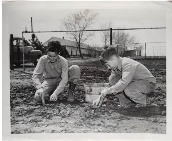
Εικόνα 11. Οι νικηφόροι κηπουροί του Boys' Town φαίνονται απασχολημένοι με τη δουλειά στο Boys' Town.