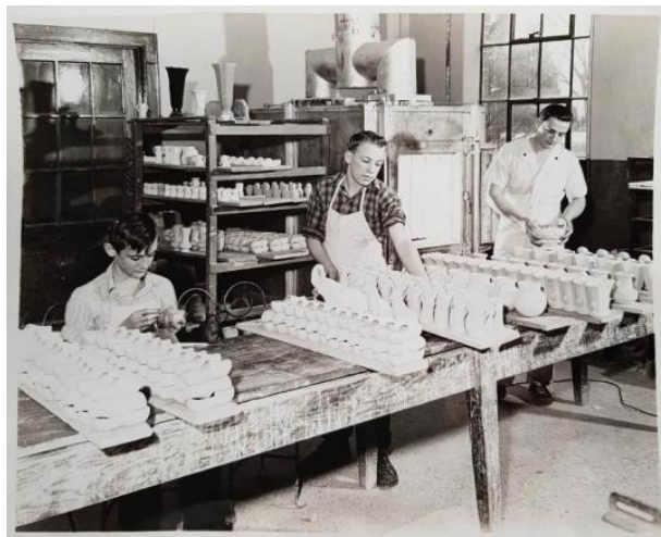
Εικόνα 13. Αγγειοπλαστική στο Boys' Town.