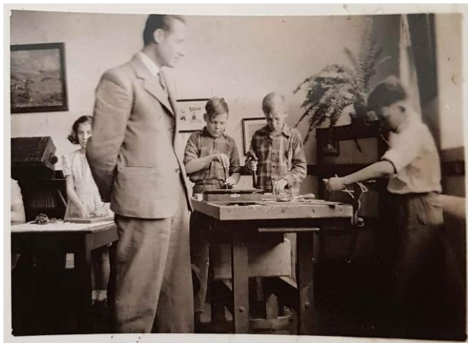
Εικόνα 6. Ξυλουργικές εργασίες εις Σωφρονιστήριο ανηλίκων εν Κεντάκη τής Αμερικής, 06 Φεβρουαρίου 1947