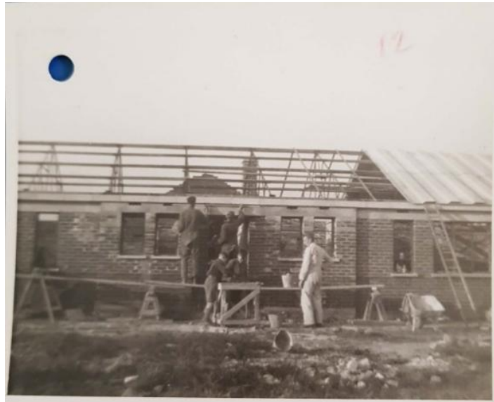
Εικόνα 4. Αγροτικόν σωφρονιστήριον Λίβερπουλ. Ανήλικοι κρατούμενοι κτίζουν μόνοι τους τὰ βοηθητικά κτίρια περίξ τῶν κεντρικῶν του σπητῶν.

Στις 19 Σεπτεμβρίου 1946 φθάνει στο Piccadilly της Νέας Υόρκης, όπως αποδεικνύει το διαβατήριό του. Στις 11 Οκτωβρίου βρισκόταν στο Λίβερπουλ 14 και στις 12 Οκτωβρίου ταξίδεψε αεροπορικά από εκεί για το νησί Μαν της Αγγλίας 15 .