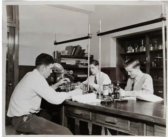
Εικόνα 14. Στο διάσημο Boys' Town της Νεμπράσκα, τα μέλη της Χορωδίας του Boys Town του Πατέρα Flanagan, που προγραμματίζονται για εμφανίσεις σε εθνικό επίπεδο υπό την αιγίδα της Columbia Concerts, Inc., εκπαιδεύονται σε διάφορα επαγγέλματα καθώς και στη μουσική. Εδώ, μια ομάδα παιδιών της χορωδίας εργάζεται σκληρά στο Εργαστήριο Φυσικής του Boys' Town.