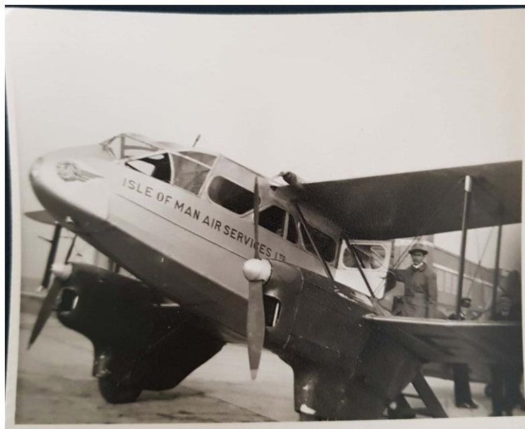
Εικόνα 3. Αεροδρόμιον Liverpool, 12-10-1946. Ήλιος

Οἱ μικροὶ κρατούμενοι, οἱ ὁποῖοι διαισθάνονται τὸ μέγεθος τῆς σοβαρότητος τῆς Ἀγγλικῆς χειρονομίας ἢ ὁποία ἐγένετο χάριν αὐτῶν [...] περιμένουν νὰ μεταφυτεύσω ἀπὸ τὴν Ἀγγλικὴν χώραν ἕνα δένδρον ἀειθαλές, καρποφόρον κ' στιβαρόν. Ἡ τιμὴ νὰ τὸ μεταφυτεύσω ἐδόθη εἰς ἐμοῦ.