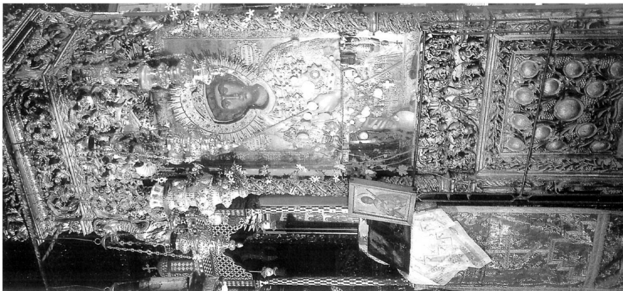
Εικ. 2. Το προσβλη- τάριο του 1794 με την εικόνα του αγίου Γεωργίου Αχειροποι- ήτου.