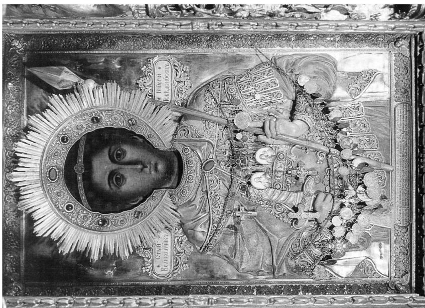
Εικ. 6. Άγιος Γεώργιος εκ Μολδαβίας.