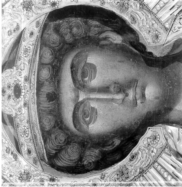
Εικ. 3. Άγιος Γεώργιος Αχειροποιήτος (λεπτομέρεια).