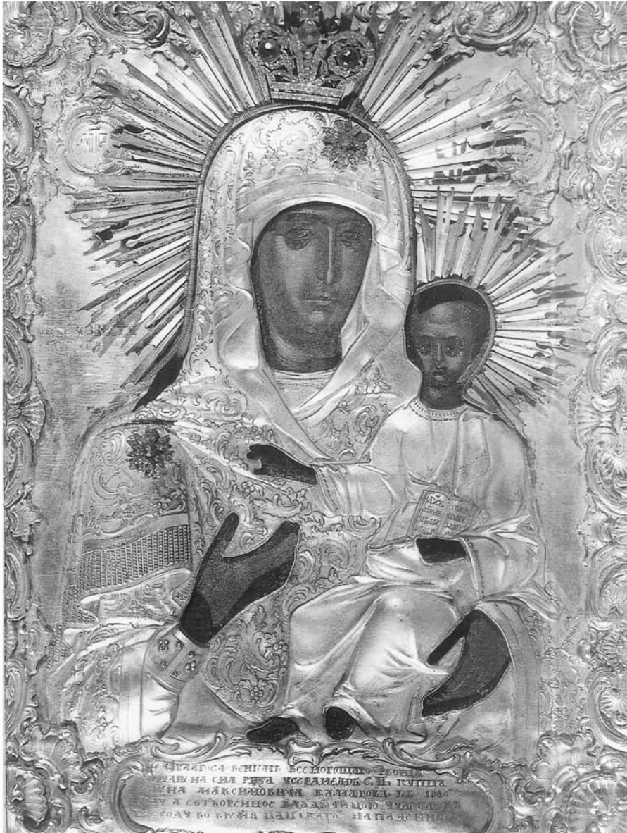
Εικ. 8. Παναγία Προαγγελομένη.