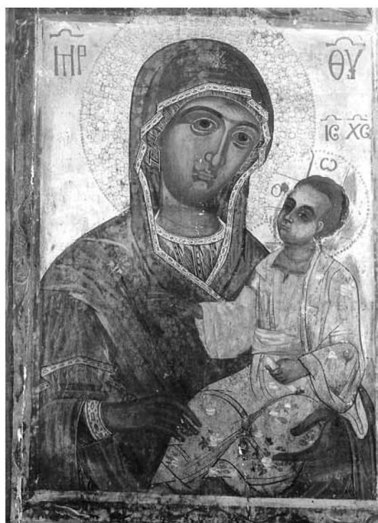
Εικ. 10. Παναγία Εσφαγμέ- νη.