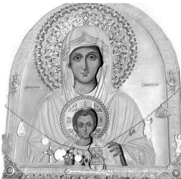
Εικ. 9. Παναγία Επακού- ουσα.