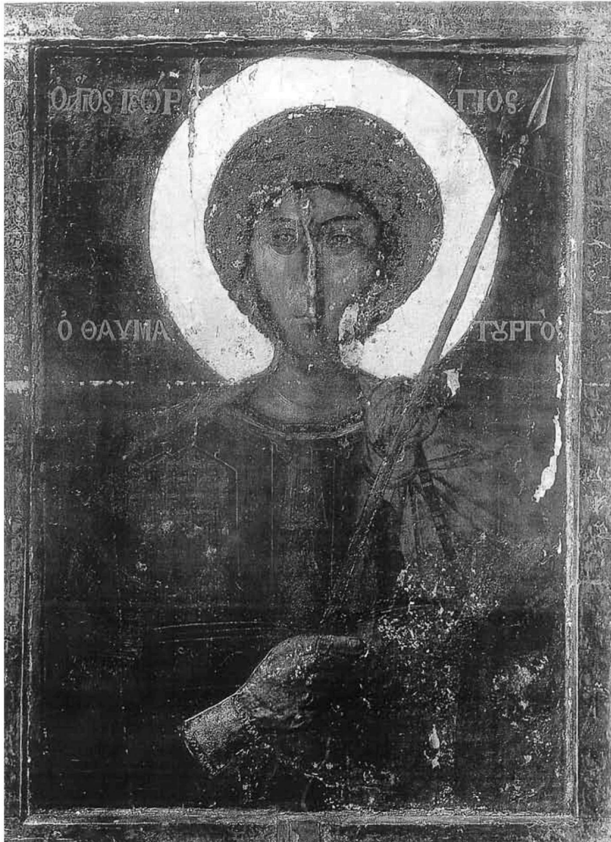
Εικ. 5. Άγιος Γεώργιος εξ Αραβίας χωρίς την επένδυση.