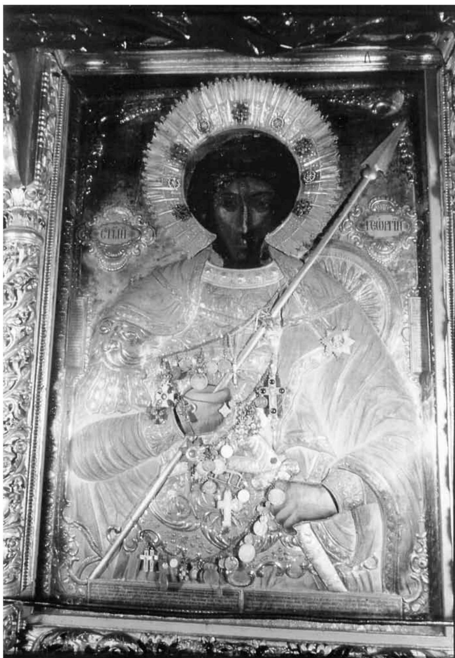
Εικ. 4. Άγιος Γεώργιος εξ Αραβίας.