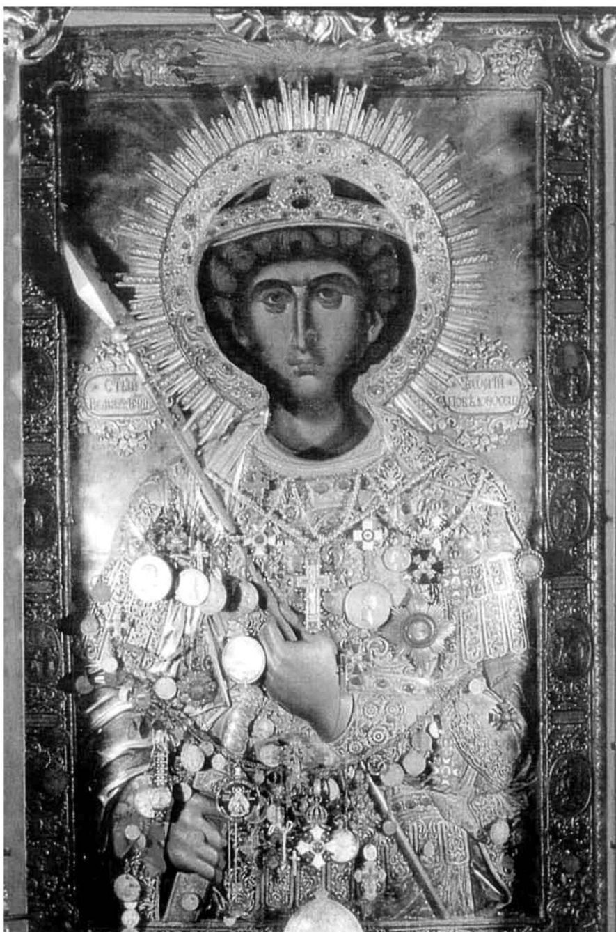
Εικ. 1. Άγιος Γεώργιος Αχειροποίητος.