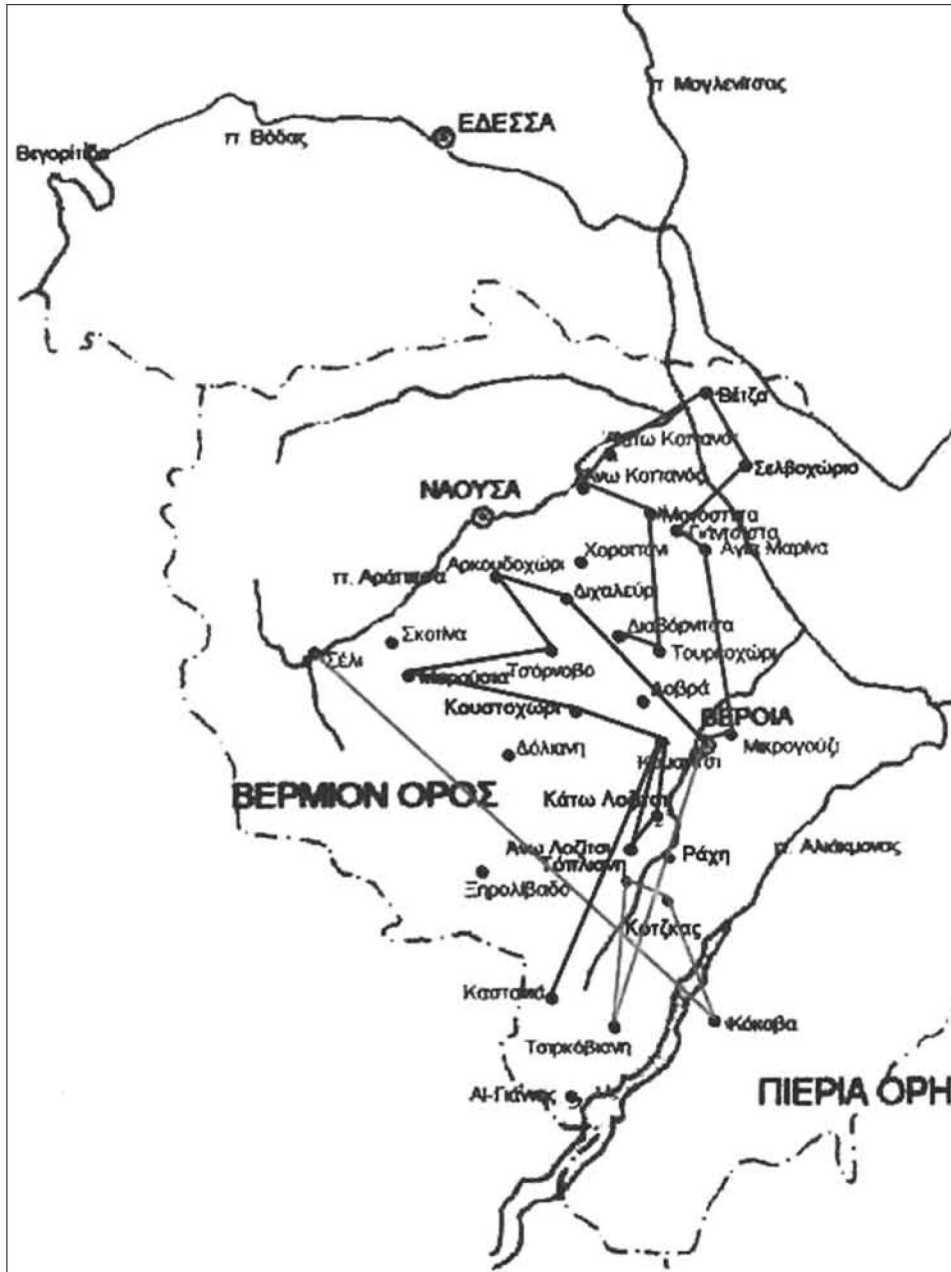
Εἰγ. 5. Οἱ τρεῖς φάσεις τῆς περιοδείας τοῦ Δανιὴλ.