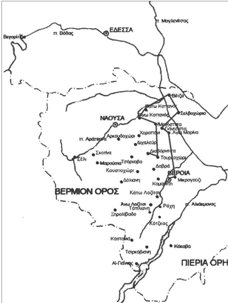
Εἰκ. 2. Α' φάση τῆς περιουδείας τοῦ Δανιήλ.