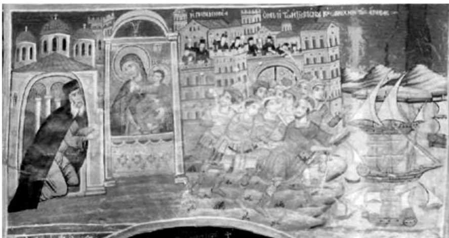
Εικ. 14. Μονή Βατοπαιδίου. Παρεκκλήσι Αγίου Δημητρίου. Αντίγραφο της Παναγίας Παραμυθίας. 1791.