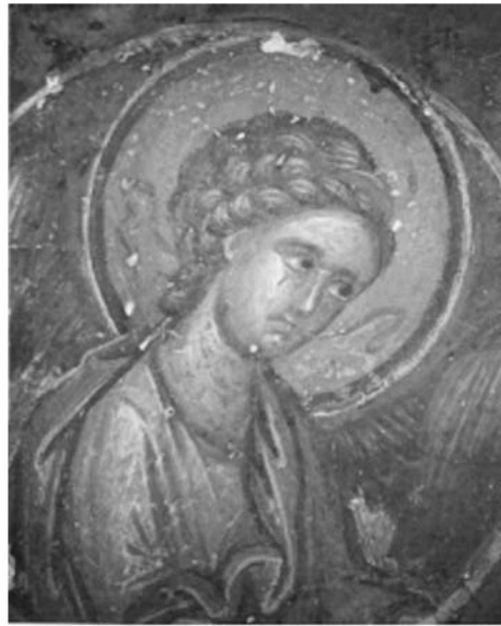
Εικ. 26. Μονή Βατοπαιδίου, η Παναγία η Αντιφωνήτρια. Λεπτομέρεια, ο άγγελος.