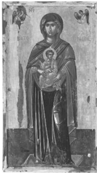
Εικ. 11. Πρωτάτο. Παναγία η Βατοπεδινή. Δεύτερο μισό 16ου αι.