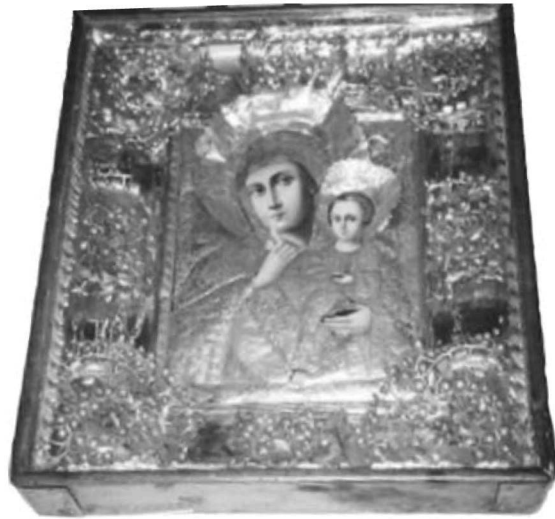
Εικ. 20. Βουλγαρία. Σόφια, ναός Αγίας Σοφίας. Η Παναγία Παραμυθία. 19ος-20ός αι.