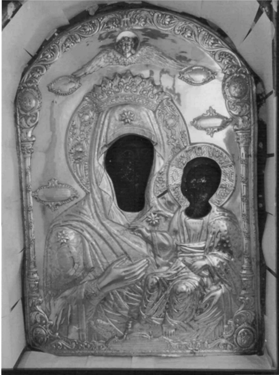
Εικ. 24. Μονή Βατοπαιδίου, η Παναγία η Αντιφωνήτρια.