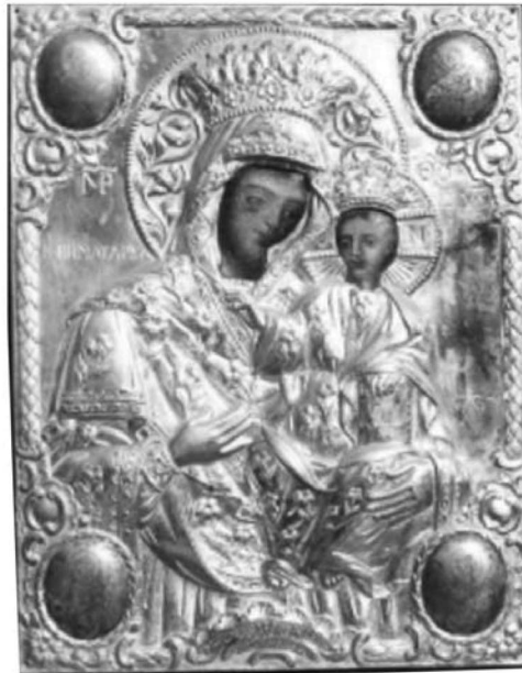
Εικ. 9. Μονή Βατοπαιδίου. Αντίγραφο της Παναγίας Βηματάρισσας. 1835.