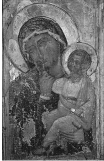
Εικ. 22. Κύπρος, Μονή του Αγίου Ιωάννη του Χρυσσοστόμου του Κουτζοβέντη. 14ος αι.