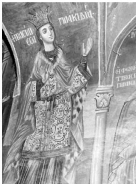
Εικ. 28. Μονή Βατοπαιδίου. Αντίγραφο της Παναγίας Αντιφωνήτριας. Λεπτομέρεια, η βασίλισσα Πλακιδιά. 19ος αι.