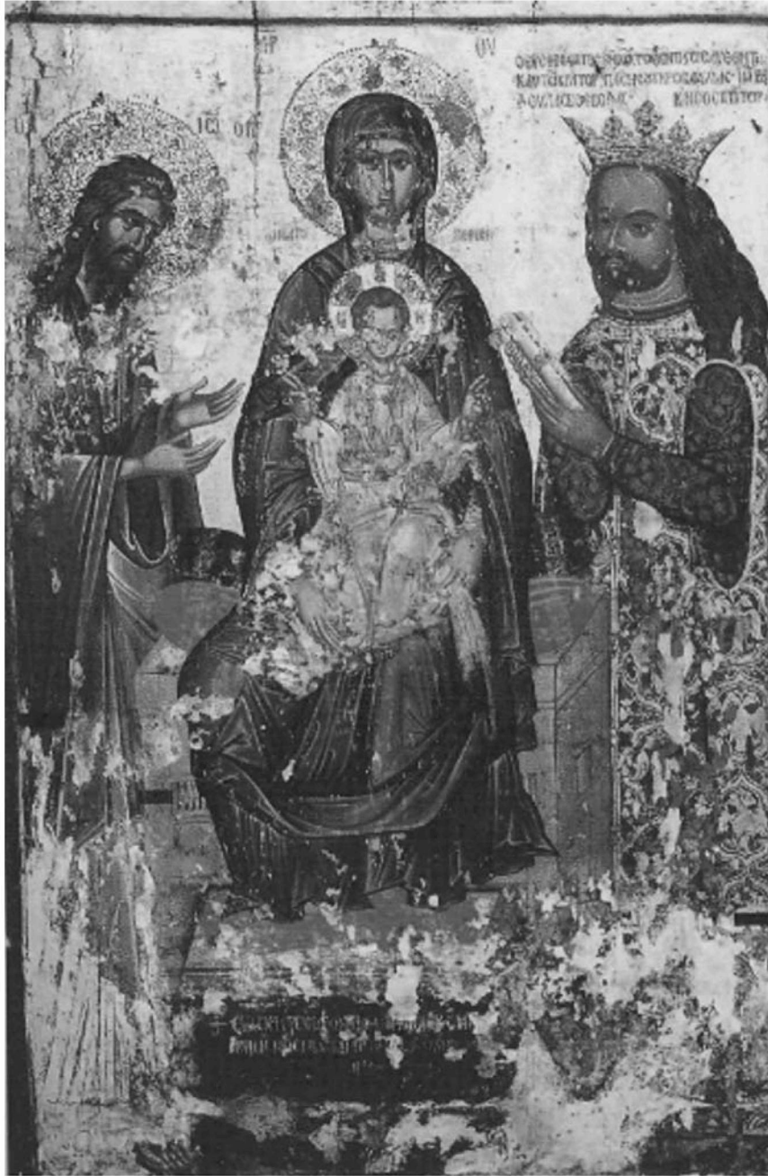
Εικ. 12. FYROM, Μοναστήρι (Bitola), ναός Αγίου Δημητρίου. Η Παναγία «Βατοπεδινή». 1502.