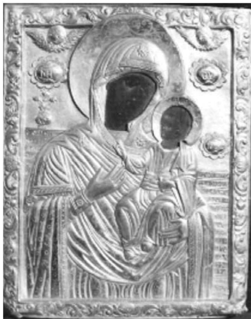
Εικ. 5. Μονή Βατοπαιδίου. Αντίγραφο της Παναγίας Βηματάρισσας. 1772.