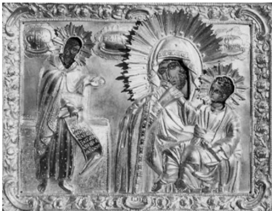
Εικ. 15. Μονή Βατοπαιδίου. Αντίγραφο της Παναγίας Παραμυθίας. 17ος αι.