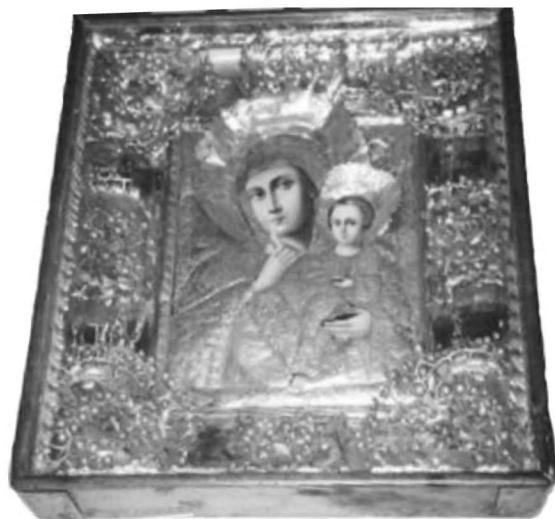
Εικ. 20. Βουλγαρία. Σόφια, ναός Αγίας Σοφίας. Η Παναγία Παραμυθία. 19ος-20ός αι.