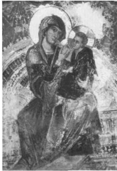
Εικ. 23. Κρήτη, Μονή Οδηγήτριας του Καιουργίου. Αρχές 14ου αι.