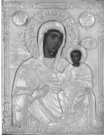
Εικ. 8. Μονή Βατοπαιδίου. Αντίγραφο Παναγίας Βηματάρισσας. 1812.