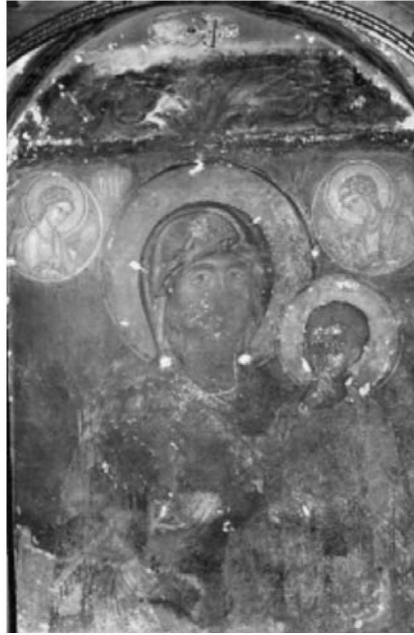
Εικ. 25. Μονή Βατοπαιδίου, η Παναγία η Αντιφωνήτρια χωρίς επένδυση.