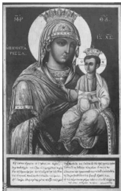
Εικ. 10. Μονή Βατοπαιδίου. Παρεκκλήσιο Αγίου Δημητρίου. Αντίγραφο της Παναγίας Βηματάρισσας. 1856.