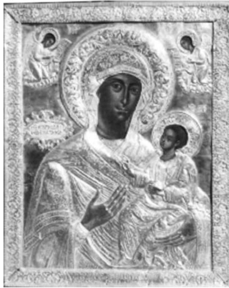
Εικ. 6. Μονή Βατοπαιδίου. Αντίγραφο της Παναγίας Βηματάρισσας. 1781.