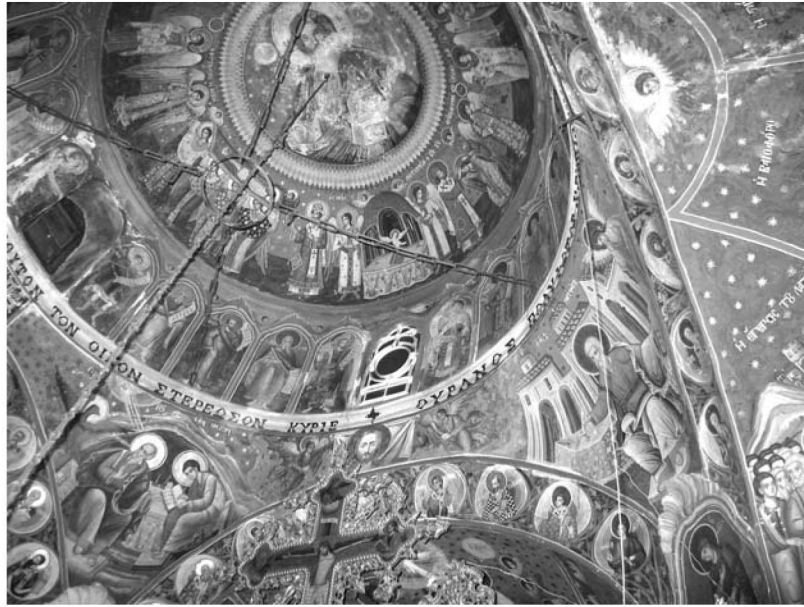
Εἰκ. 10. Παρεκκλήσι Ἁγίου Ἰωάννου τοῦ Θεολόγου. Ἐσωτερικό. Τοιχογραφίες στὸν τροῦλο καὶ γύρω ἀπ' αὐτόν. 1777.