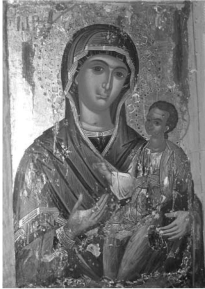
Εἰκ. 1. Παρεκκλήσι Κοιμήσεως Θεοτόκου Κελίου Ἁγίου Νείλου. Φορητὴ εἰκόνα τῆς Θεοτόκου Ὁδηγητριάς.