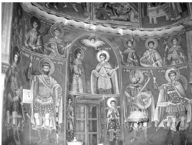
Είκ. 13. Παρεκκλήσι Άγιου Ιωάννου του Θεολόγου. Έσωτερικό. Βόρειος τοίχος. Τοιχογραφία Άγιων Μαρτύρων. 1777.