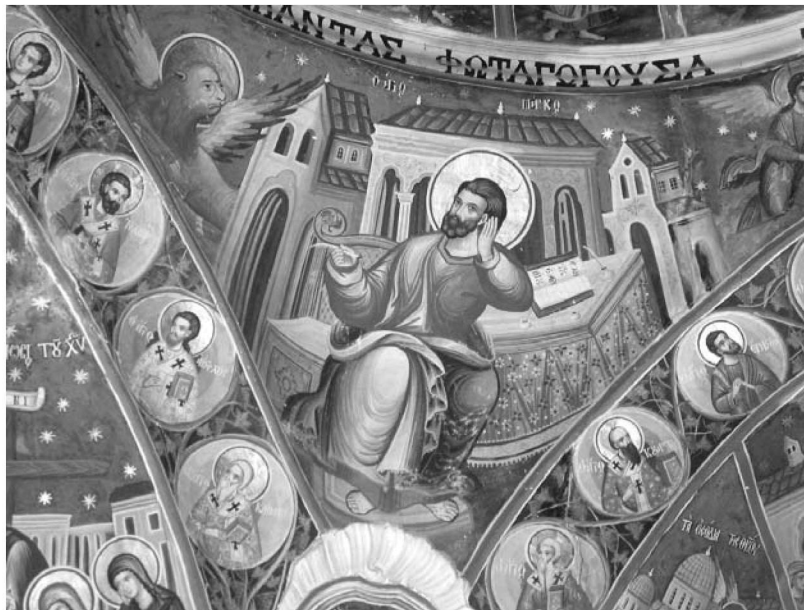
Εἰκ. 11. Παρεκκλήσι Ἁγίου Ἰωάννου τοῦ Θεολόγου. Ἐσωτερικό. Ὁ Εὐαγγελιστὴς Μάρκος καὶ Ἅγιοι Ἀπόστολοι ἐκ τῶν Ἑβδομήκοντα. Τοιχογραφία στὸ ΒΔ λοφίο τοῦ τροῦλου. 1777.