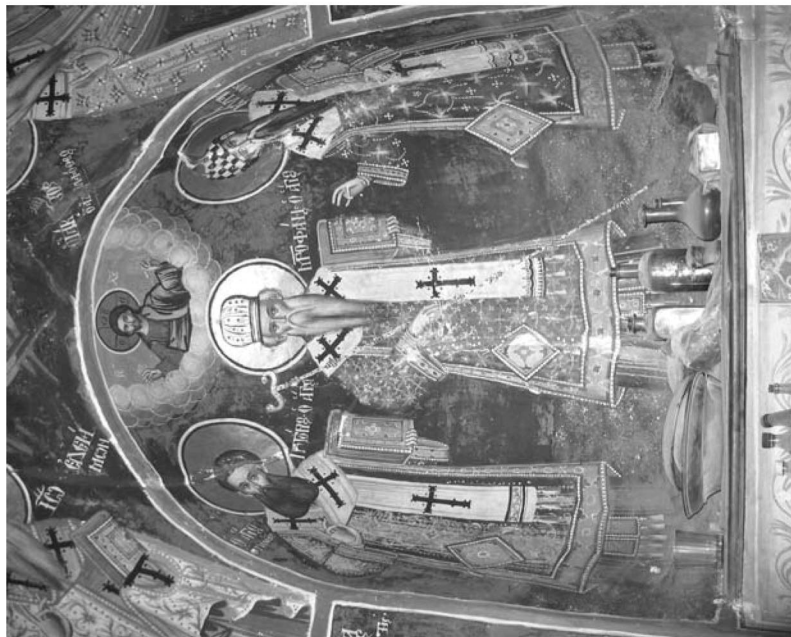
Εικ. 20. Παρεκκλήσι Αγίου Ιωάννου του Θεολόγου. Ἑσωτερικό. Βόρεια πλευρά. Τοιχογραφία τῶν ἁγίων Γρηγορίου Παλαμά, Μητροπολίτου Κωνσταντινουπόλεως καὶ Κυβέλλου Ἀλεξανδρείας. 1777.