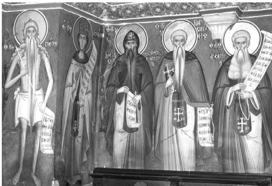
Εικ. 8. Παρεκκλήσι Αγίου Ιωάννου του Θεολόγου. Έσωτερικό. Δυτικούς τοίχους. Τοιχογραφία με Όσιους. 1777.