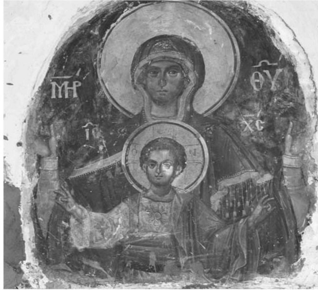
Εἰκ. 21. Παρεκκλήσι Ἁγίου Μαξίμου. Ἐσωτερικό. Ἱερὸ Βῆμα. Τοιχογραφία τῆς Πλατυτέρας τῶν Οὐρανῶν.