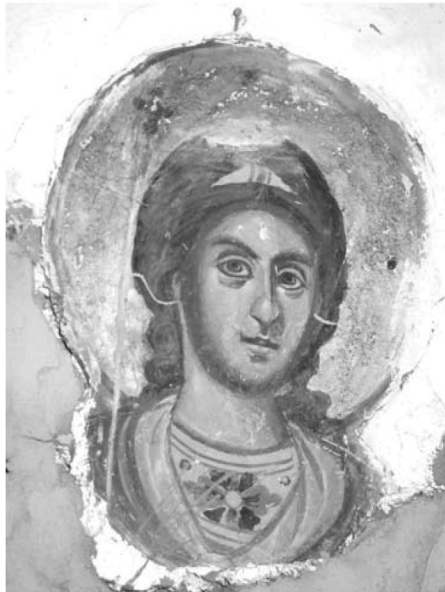
Εἰκ. 22. Παρεκκλήσι Ἁγίου Μαξίμου. Ἐσωτερικό. Ἱερὸ Βῆμα. Τοιχογραφία (σπάραγμα) ἀγγέλου Α΄.