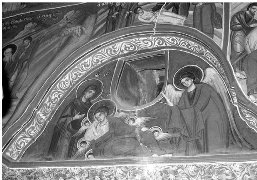
Εικ. 9. Παρεκκλήσι Αγίου Ιωάννου του Θεολόγου. Έσωτερικό. Κυρίως ναός. Τοιχογραφία πάνω από τη δυτική πύλη με τον Αναπεσόντα Κύριο. 1777.