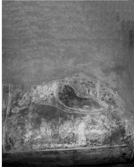
Εἰκ. 2. Παρεκκλήσι Ὑπαπαντῆς τοῦ Σωτήρος Κελίου Ἁγίου Νείλου. Ἐσωτερικό. Τοιχογραφία τῆς Γεννήσεως τοῦ Χριστοῦ.