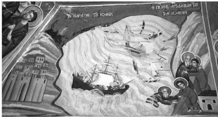
Εἰκ. 7. Παρεκκλήσι Ἁγίου Ἰωάννου τοῦ Θεολόγου. Ἐσωτερικό. Λιτή. Τοιχογραφία με τὸ ναγάιο τοῦ Ἰωάννου. 1777.