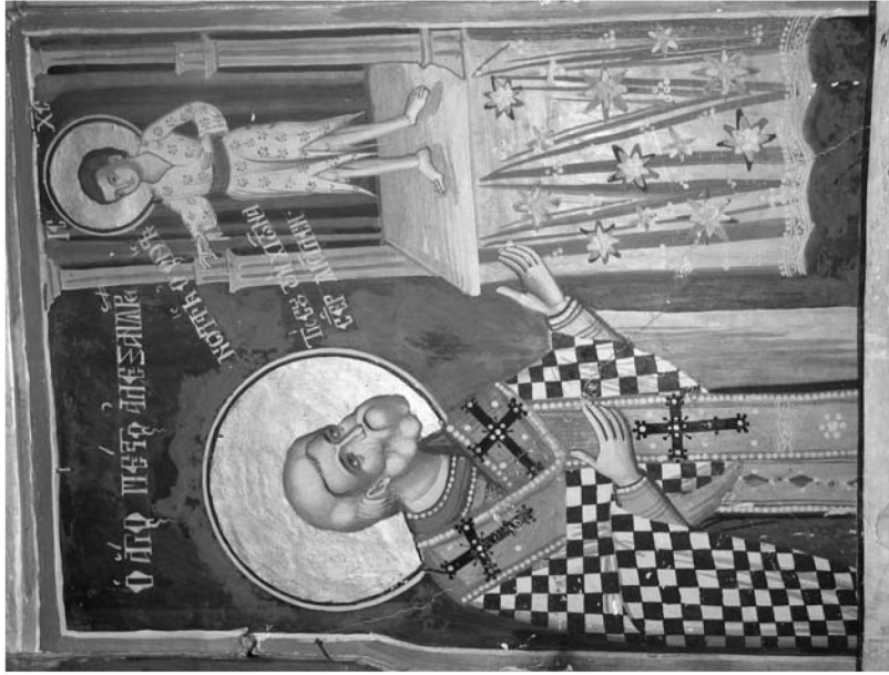
Εἰκ. 18. Παρεκκλήσι Ἁγίου Ἰωάννου τοῦ Θεολόγου. Ἐσωτερικό. Ἱερό Βῆμα. Βόρεια πλευρά. Τοιχογραφία μέ τὸ ὄραμα τοῦ ἁγίου Πέτρου Ἀλεξανδρείας. 1777.