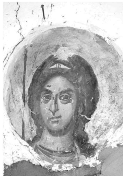
Εἰκ. 23. Παρεκκλήσι Ἁγίου Μαξίμου. Ἐσωτερικό. Ἱερὸ Βῆμα. Τοιχογραφία (σπάραγμα) ἀγγέλου Β΄.