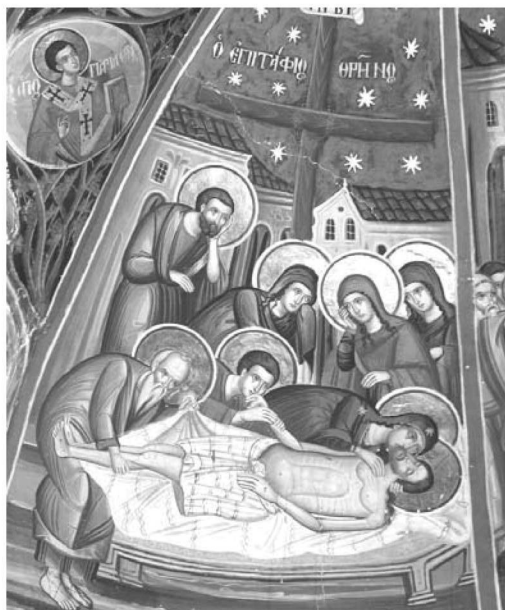
Είκ. 12. Παρεκκλήσι Άγιου Ιωάννου του Θεολόγου. Έσωτερικό. Βόρειο τόξο. Τοιχογραφία του Έπιταφίου Θρήνου. 1777.