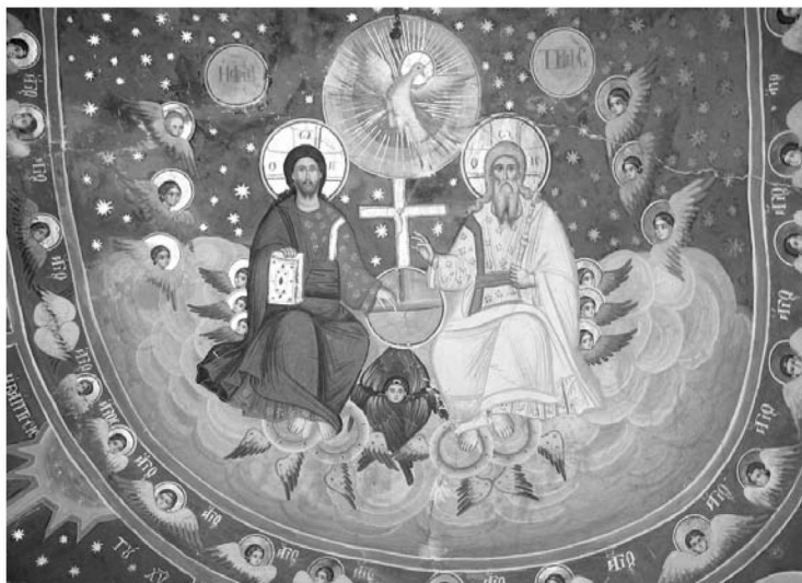
Είκ. 15. Παρεκκλήσι Άγιου Ιωάννου του Θεολόγου. Έσωτερικό. Ίερό Βήμα. Όροφή. Τοιχογραφία της Άγίας Τριάδος, 1777.