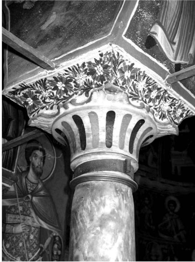
Εἰκ. 6. Παρεκκλήσι Ἁγίου Ἰωάννου τοῦ Θεολόγου. Ἐσωτερικό. Ἐπιζωγραφισμένος κίονας.