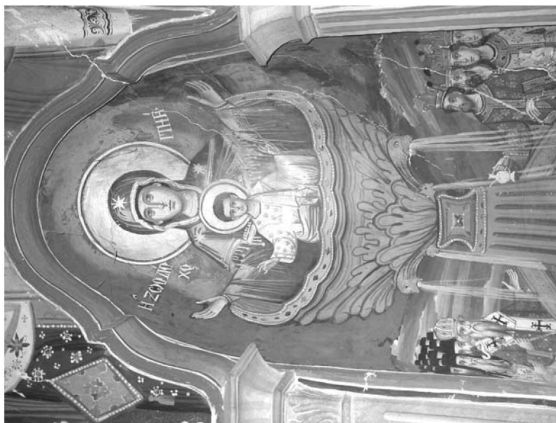
Εικ. 19. Παρεκκλήσι Αγίου Ιωάννου του Θεολόγου. Ἑσωτερικό. Ἰερό Βῆμα. Κόγχη διακονικῶν. Τοιχογραφία τῆς Ζωοδόχου Πηγῆς. 1777.