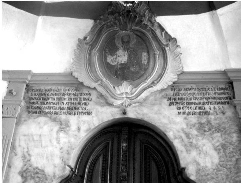
Είκ. 4. Παρεκκλήσι Άγιου Ίωάννου του Θεολόγου. Δυτική είσοδος (έξωτερικά). Υπέρθυρη κτιτορική έπιγραφή. 1766.