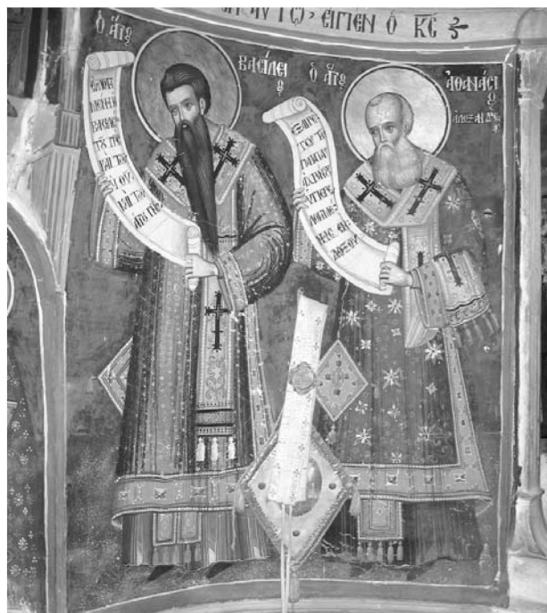
Είκ. 16. Παρεκκλήσι Άγιου Ιωάννου του Θεολόγου. Έσωτερικό. Ίερό Βήμα. Τοιχογραφία με τούς συλλειτουργούντες ιεράρχες άγιους Βασίλειο και Άθανάσιο Άλεξανδρείας, 1777.