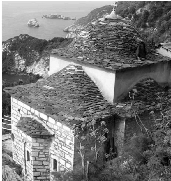
Εἰκ. 3. Παρεκκλήσι Ἁγίου Ἰωάννου τοῦ Θεολόγου. Ἐξωτερικὴ ἄποψη ἀπὸ ΒΑ.