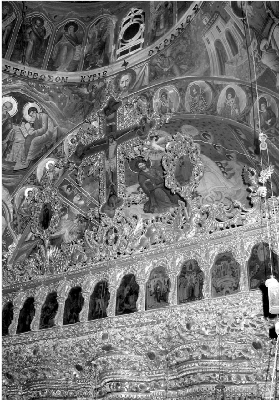
Εἰκ. 14. Παρεκκλήσι Ἁγίου Ἰωάννου τοῦ Θεολόγου. Ἐσωτερικό. Τμήμα τοῦ ξυλόγλυπτον τέμπλον μετὸν Ἐστανρωμένο, τὰ λυπηρά καὶ τμήμα τοῦ Δωδεκακάστου.