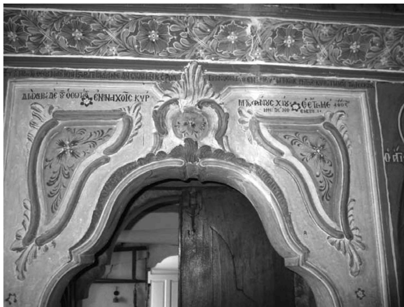
Είκ. 5. Παρεκκλήσι Άγιου Ίωάννου του Θεολόγου. Έσωτερικό. Δυτική είσοδος. Υπέρθυρη κτιτορική έπιγραφή. 1777.