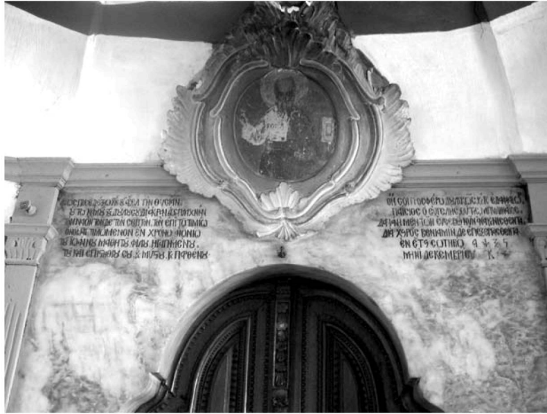
Εἰκ. 4. Παρεκκλήσι Ἁγίου Ἰωάννου τοῦ Θεολόγου. Δυτικὴ εἴσοδος (ἐξωτερικά). Ὑπέρθυρη κτιτορικὴ ἐπιγραφή. 1766.