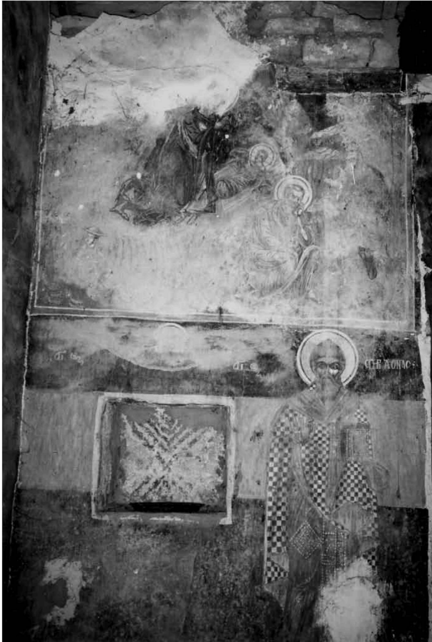
Εικ. 6. Η Γέννηση του Χριστού και ο άγιος Σπυρίδων στον νότιο τοίχο του Ιερού. The Nativity of Christ and St. Spyridon on the south wall of the Sanctuary.