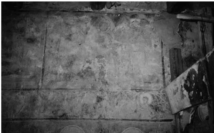
Εικ. 12. Η Εις Άδον Κάθοδος στον βόρειο τοίχο του κυρίως ναού (ανώτερη ζώνη) και τμήμα της μεσαίας ζώνης με τις προτομές αγίων. The Resurrection on the north wall of the naos (upper zone) and part of the middle zone with busts of saints.