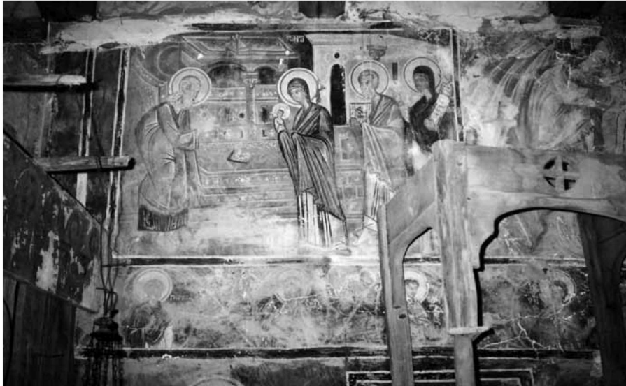
Εικ. 7. Η Υπαπαντή στον νότιο τοίχο του κυρίως ναού (ανώτερη ζώνη) και τμήμα της μεσαίας ζώνης με τις προτομές αγίων. The Presentation of Christ in the Temple on the south wall of the naos (upper zone) and part of the middle zone with busts of saints.