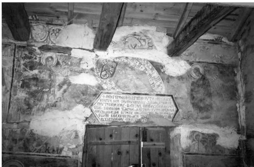
Εικ. 2. Η κτιτορική επιγραφή επάνω από τη νότια είσοδο και ο Χριστός Αναπεσών. The donors' inscription above the south entrance and the Christ Anapeson (Sleeping Emmanuel).