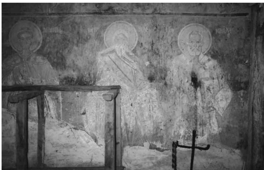
Εικ. 15. Ο άγιος Δημήτριος, ο προφήτης Ηλίας και ο άγιος Νικόλαος στην κατώτερη ζώνη, στον βόρειο τοίχο του κυρίως ναού. St. Demetrius, Prophet Elijah and St. Nicholas on the lower register on the north wall of the naos.