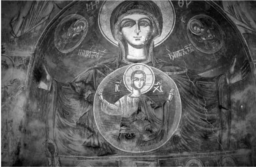
Εικ. 3. Η Πλατυτέρα στο τεταρτοσφαίριο της κόγχης του Ιερού. The Platytera in the conch of the apse of the Sanctuary.