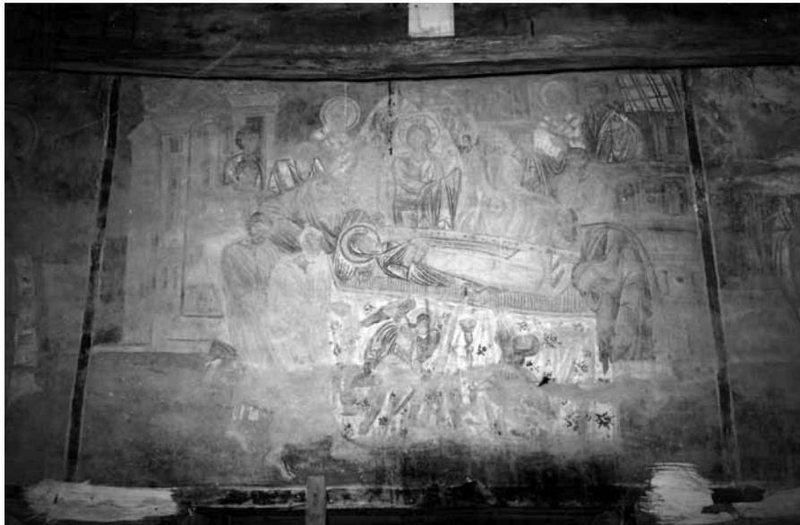
Εικ. 14. Η Κοίμηση στον δυτικό τοίχο του κυρίως ναού. The Dormition on the west wall of the naos.