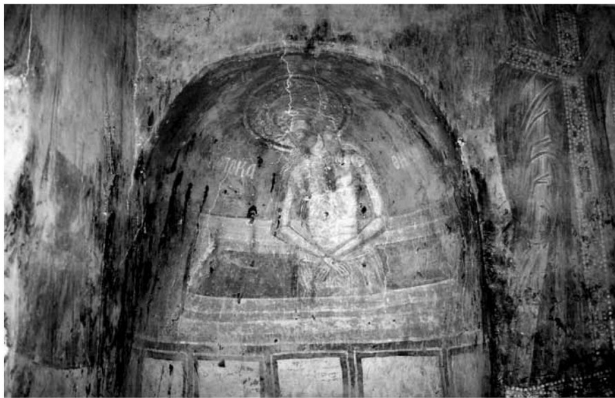
Εικ. 4. Ο Χριστός – Ακρα Ταπείνωση στην κόγχη της Πρόθεσης και τμήμα από τον άγγελο του Ευαγγελισμού. The Christ – Akra Tapeinosis in the conch of the Prothesis and part of the Archangel of the Annunciation.