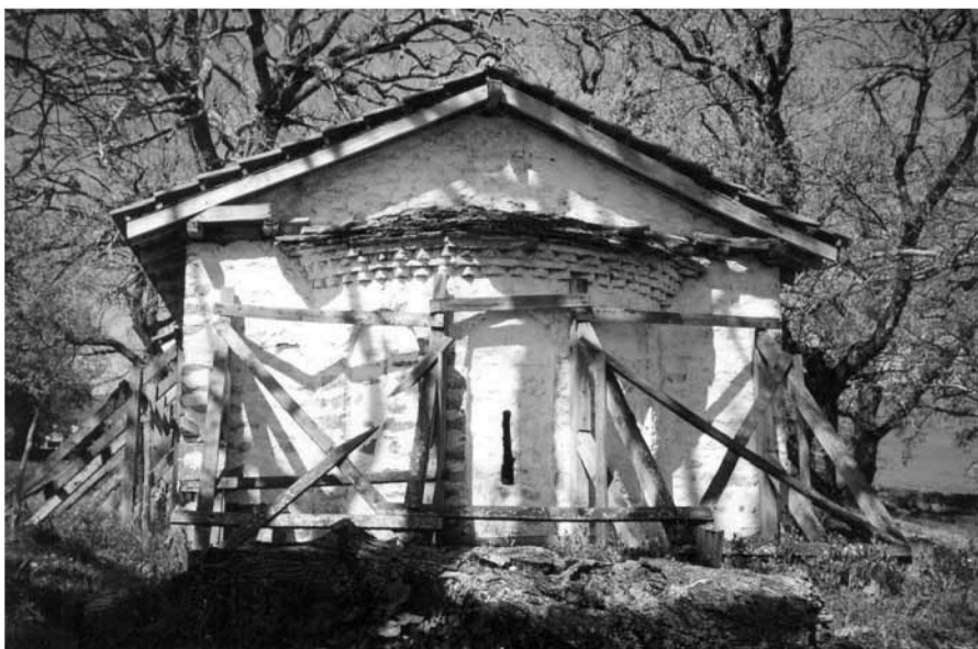
Εικ. 1. Άποψη της ανατολικής πλευράς του ναού. View of the east side of the church.