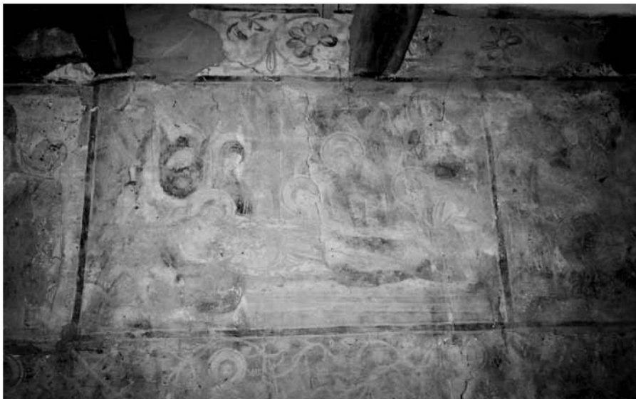
Εικ. 11. Ο Επιτάφιος Θρήνος στον βόρειο τοίχο του κυρίως ναού (ανώτερη ζώνη) και τμήμα της μεσαίας ζώνης με τις προτομές αγίων. The Epitaphios Threnos on the north wall of the naos (upper zone) and part of the middle zone with busts of saints.