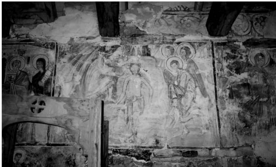
Εικ. 8. Η Βάπτιση στον νότιο τοίχο του κυρίως ναού και τμήμα της μεσαίας ζώνης με τις προτομές αγίων. The Baptism on the south wall of the naos and part of the middle zone with busts of saints.