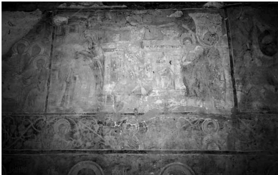
Εικ. 10. Η Σταύρωση στον βόρειο τοίχο του κυρίως ναού (ανώτερη ζώνη) και τμήμα της μεσαίας ζώνης με τις προτομές αγίων. The Crucifixion on the north wall of the naos (upper zone) and part of the middle zone with busts of saints.