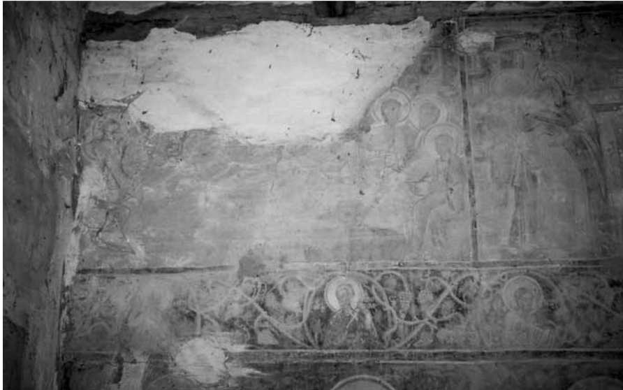
Εικ. 9. Ο Μυστικός Δείπνος στον βόρειο τοίχο του κυρίως ναού και τμήμα της μεσαίας ζώνης με τις προτομές αγίων. The Last Supper on the north wall of the naos and part of the middle zone with busts of saints.