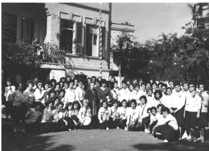
Εικ. 4. Αναμνηστική φωτογραφία στην αυλή της σχολής (1964). A commemorative photograph from the yard of the institution (1964).