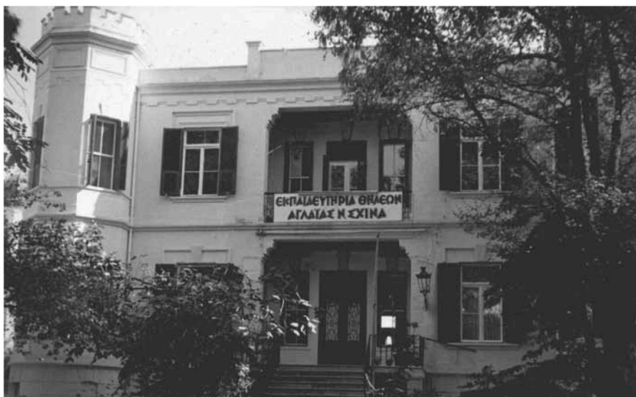
Εικ. 1. Τα Εκπαιδευτήρια Αγλαΐας Σχινά. The Educational Institutions of Aglaia Schina.