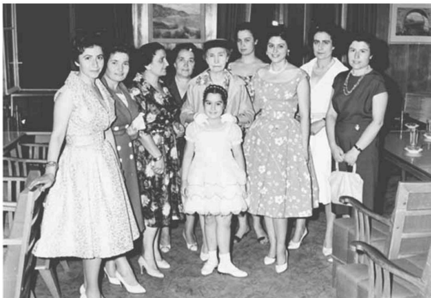
Εικ. 9. Αναμνηστική φωτογραφία με τον Σύλλογο Αποφοίτων των Εκπαιδευτηρίων Αγλαΐας Σχινά. A commemorative photograph with the Union of Graduates of the Educational Institutions of Aglaia Schina.