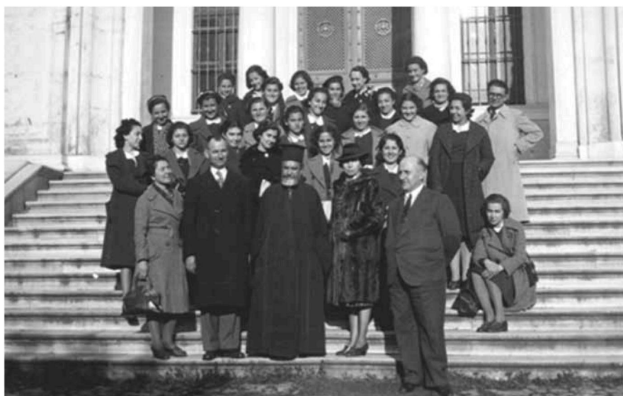
Εικ. 8. Μαθήτριες και καθηγητές της σχολής Αγλαΐας Σχινά στην είσοδο της Θεολογικής Σχολής Χάλκης με τον Σχολάρχη Μητροπολίτη Φιλαδελφείας Αιμιλιανό (1939). Female students and teachers of the school of Aglaia Schina in the entrance of the Theologian School in Chalki, with the Headmaster Metropolitan of Philadelphia Aimilianos (1939).