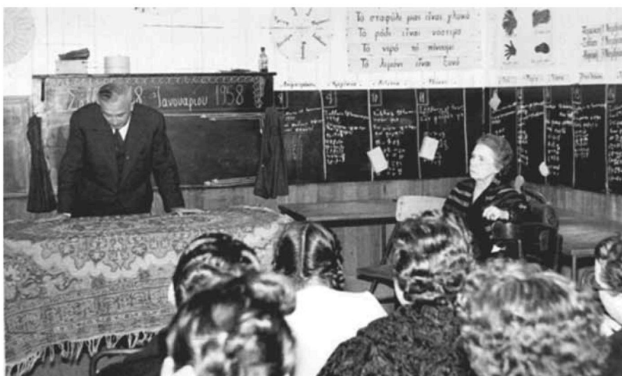
Εικ. 6. Την ώρα του μαθήματος. During the lesson.