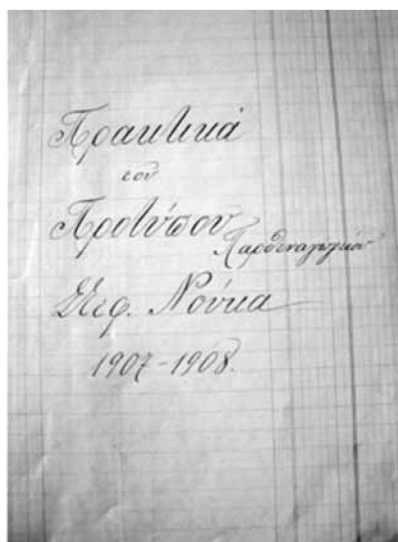
Εικ. 10. Η πρώτη σελίδα του νπ' αριθμόν 5 κώδικα. The first page of the code number 5.