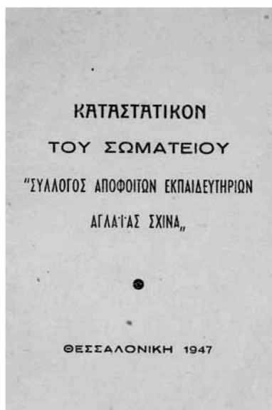
Εἰκ. 20. Καταστατικὸ τοῦ Συλλόγου Αποφοίτων Αγλαΐας Σχινά, τοῦ ἔτους 1947. Articles of the association «Union of Graduates of the Educational Institutions of Aglaia Schina» in the year 1947.