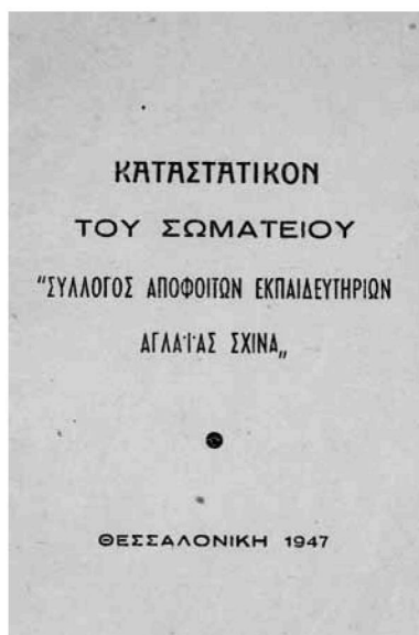
Εἰκ. 20. Καταστατικὸ τοῦ Συλλόγου Αποφοίτων Αγλαΐας Σχινά, τοῦ ἔτους 1947. Articles of the association «Union of Graduates of the Educational Institutions of Aglaia Schina» in the year 1947.