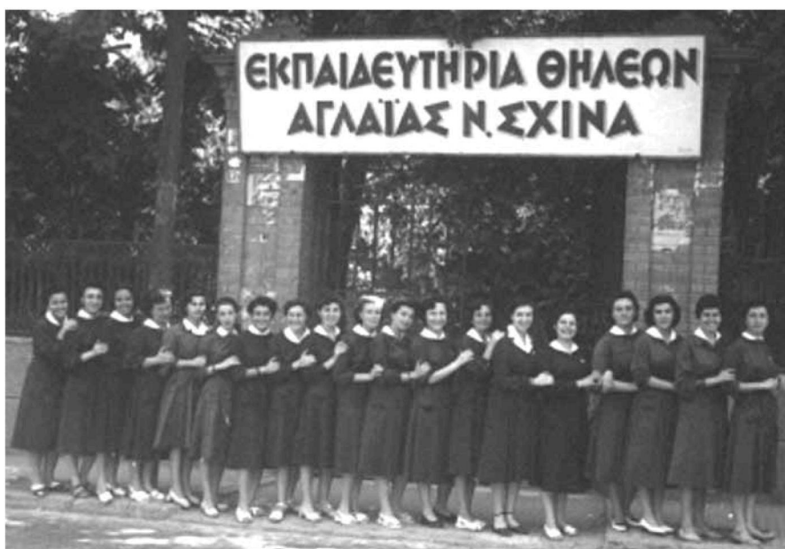
Εικ. 5. Μαθήτριες των Εκπαιδευτηρίων Αγλαΐας Σχινά στην είσοδο της σχολής. Female students of the Educational Institutions of Aglaia Schina in the entrance of the school.