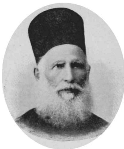
Εικ. 2. Ο Στέφανος Νούκας (Κ. Σκόκος, «Εθνικόν Ημερολόγιον», εν Αθήναις 1910, σ. 115). Stephanos Noukas (K. Skokos, «National Diary», in Athens 1910, p. 115).