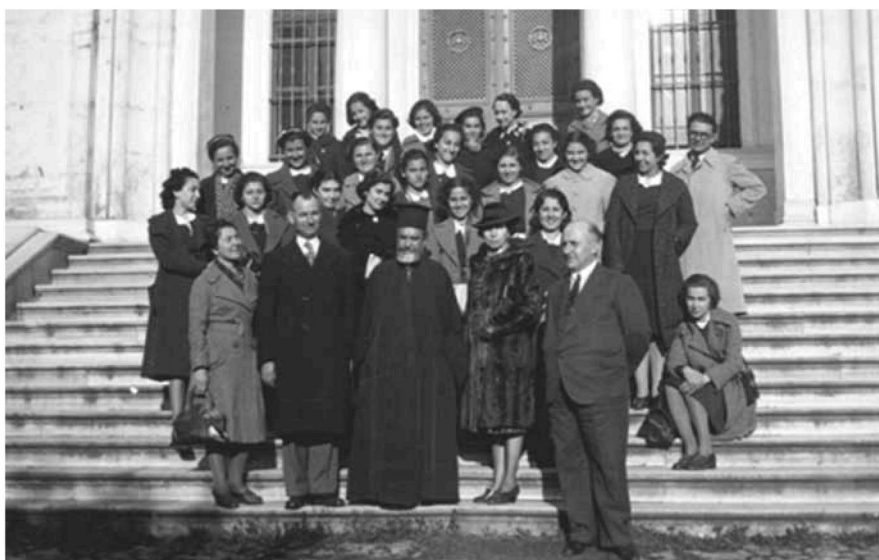
Εικ. 8. Μαθήτριες και καθηγητές της σχολής Αγλαΐας Σχινά στην είσοδο της Θεολογικής Σχολής Χάλκης με τον Σχολάρχη Μητροπολίτη Φιλαδελφείας Αιμιλιανό (1939). Female students and teachers of the school of Aglaia Schina in the entrance of the Theologian School in Chalki, with the Headmaster Metropolitan of Philadelphia Aimilianos (1939).