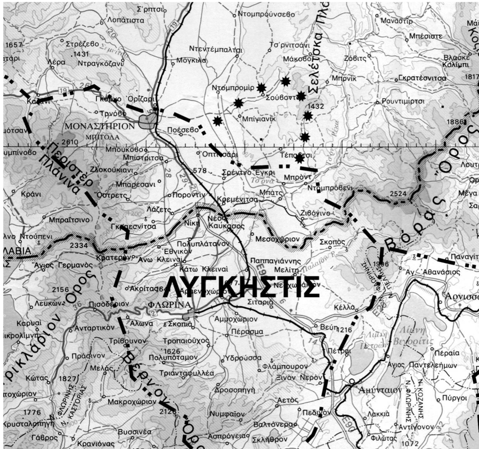
ΧΑΡΤΗΣ 4: ΚΑΙΜΑΚΑ 1 : 500.000