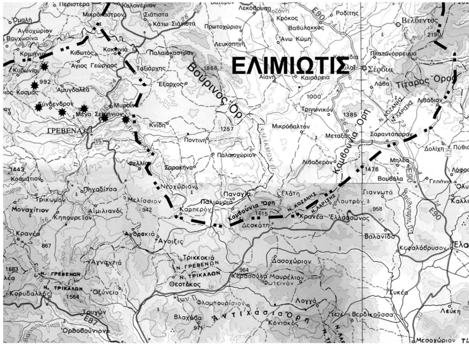
ΧΑΡΤΗΣ 2: ΚΑΛΙΜΑΚΑ 1 : 500.000