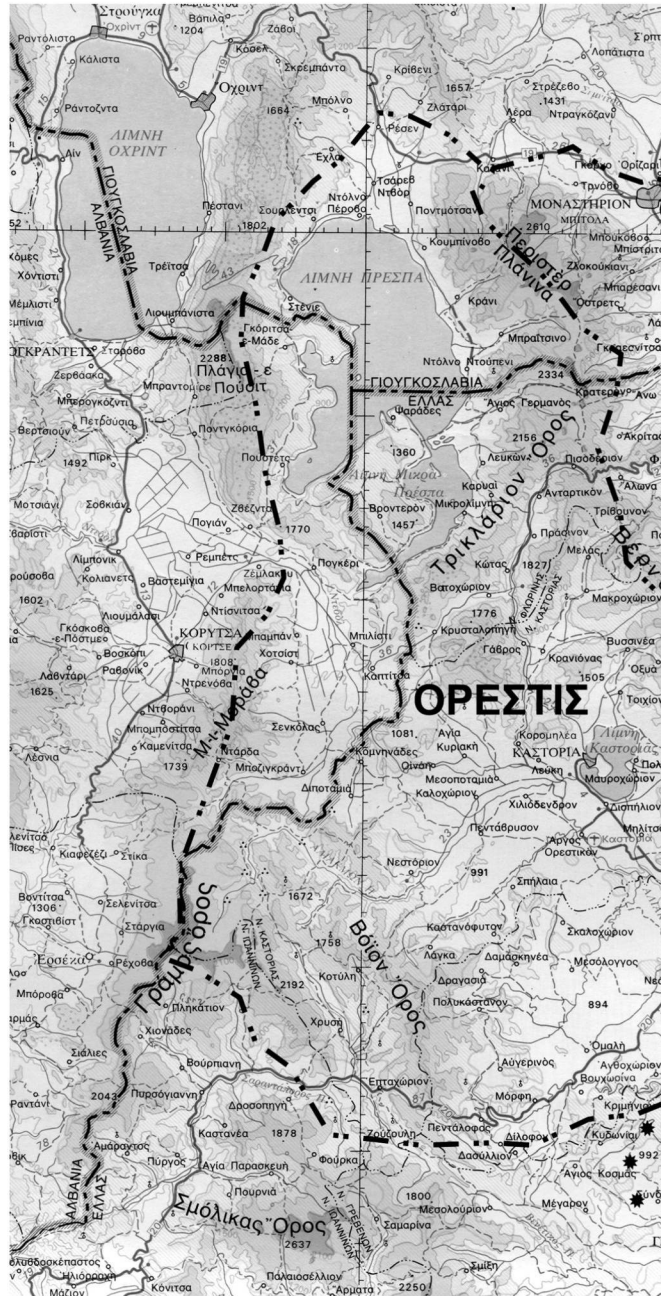
ΧΑΡΤΗΣ 3: ΚΛΙΜΑΚΑ 1 : 500.000