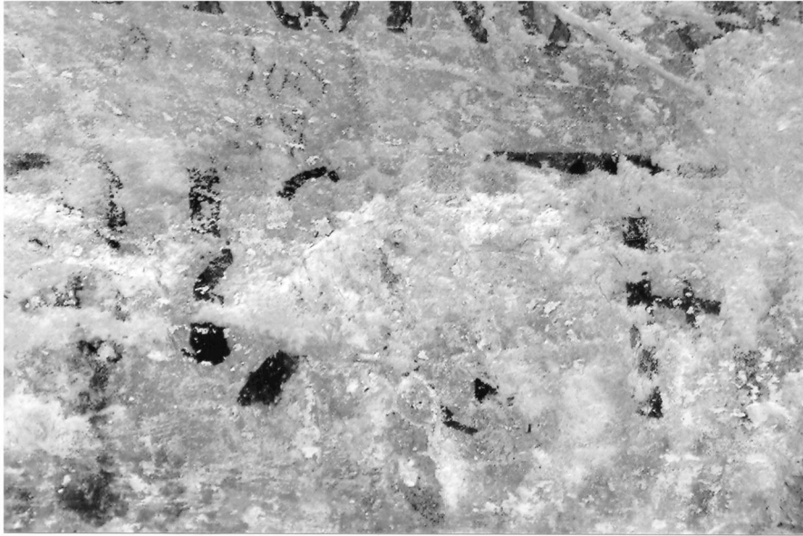
Εικ. 3. Σέρβια Κοζάνης. Ναός Αγίων Αναργύρων, κτητορική επιγραφή (λεπτομέρεια). Fig. 3. Serbia (Kozani). Saints Anargyroi church, the votive inscription (detail).