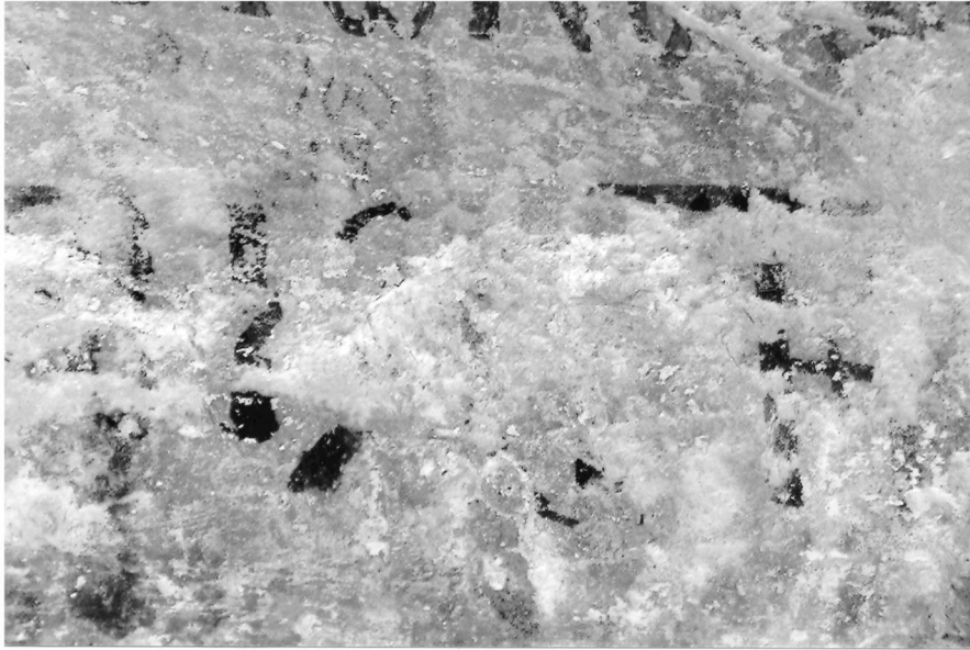
Εικ. 3. Σέρβια Κοζάνης. Ναός Αγίων Αναργύρων, κτητορική επιγραφή (λεπτομέρεια). Fig. 3. Serbia (Kozani). Saints Anargyroi church, the votive inscription (detail).