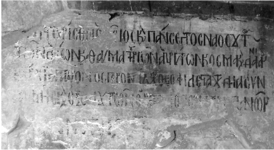
Εικ. 1. Σέρβια Κοζάνης. Ναός Αγίων Αναργύρων, κτητορική επιγραφή. Fig. 1. Serbia (Kozani). Saints Anargyroi church, the votive inscription.