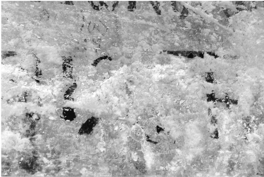
Εικ. 3. Σέρβια Κοζάνης. Ναός Αγίων Αναργύρων, κτητορική επιγραφή (λεπτομέρεια). Fig. 3. Serbia (Kozani). Saints Anargyroi church, the votive inscription (detail).