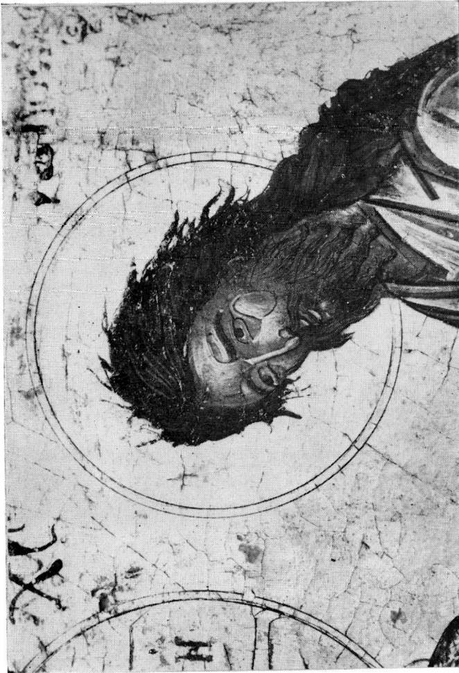
Εικόνα Δέσσης (λεπτομ. με Ιωάννη Πρόδρομο). Αρχαιολογικό Μουσείο Καβάλας