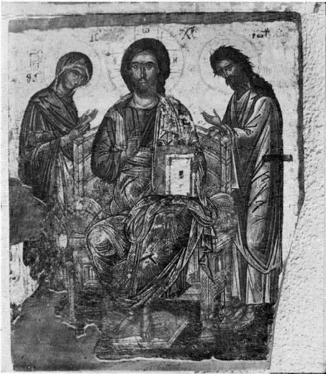
Εικόνα Δέησης. Αρχαιολογικό Μουσείο Καβάλας