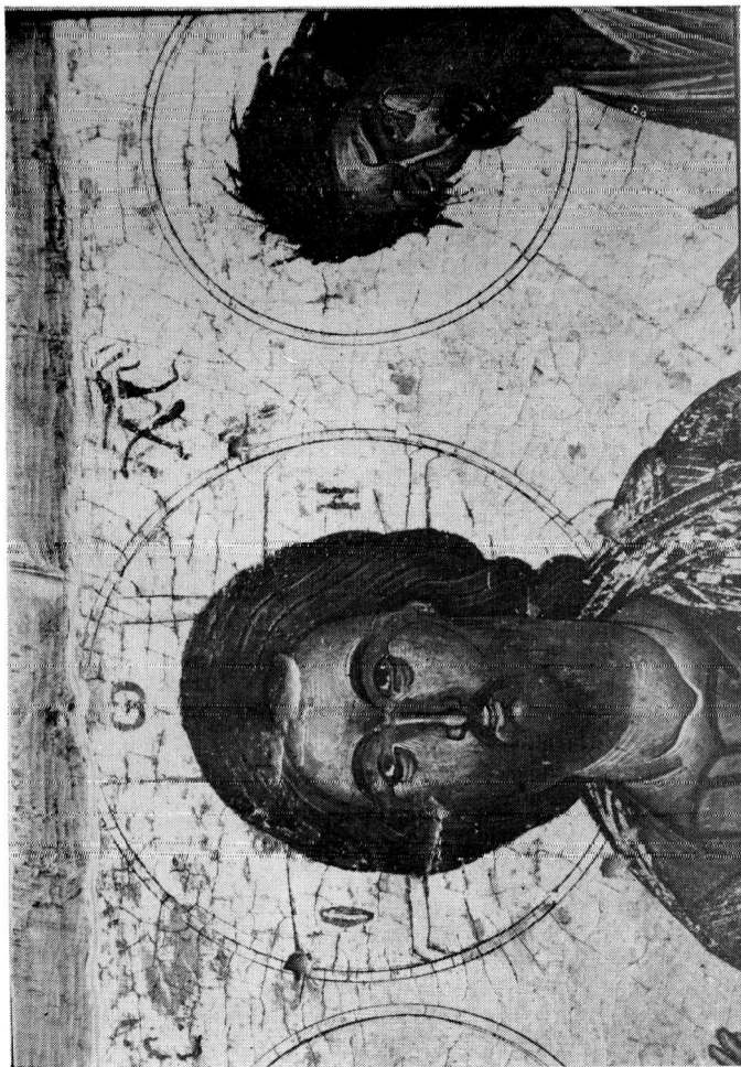
Εικόνα Δέησης (Λεπτομ. με Χριστό). Αρχαιολογικό Μουσείο Καβάλας