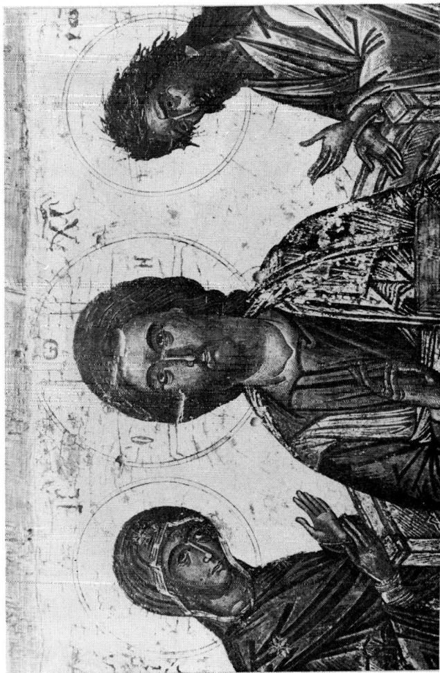
Εικόνα Δέησης (λεπτομ. 1). Αρχαιολογικό Μουσείο Κυβιάδας