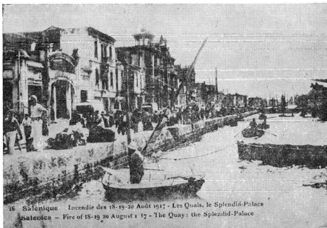
4. Τὸ ἴδιο τμῆμα τῆς πόλης μετὰ τὴν πυρκαϊῶν

θόλου 1 , ἀλλὰ μιὰ ἄλλη τοῦ ἐπόμενου ἔτους. Ἀσφαλῶς κάνει λάθος στή χρονολογία. Μεταφράζω τὸ σχετικὸ ἀπόσπασμα: «Σήμερα γύρω στὶς 3 τὸ πρωὶ ξέσπασε μιὰ μεγάλη πυρκαϊὰ στὸ κέντρο τῆς Θεσσαλονίκης καὶ πάνω ἀπὸ 100 σπίτια καὶ πολλὰ καταστήματα ἔγιναν παρανάλωμα τῶν φλογῶν. Ἄν δὲν εἶχε κυριαρχήσει μιὰ ἀπόλυτη νηνεμία, ἡ οἰκοδομῆ