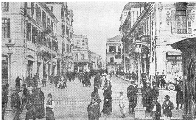
2. Ἡ παλιὰ πλατεία Ἐλευθερίας πρὶν ἀπὸ τὴν πυρκαϊά