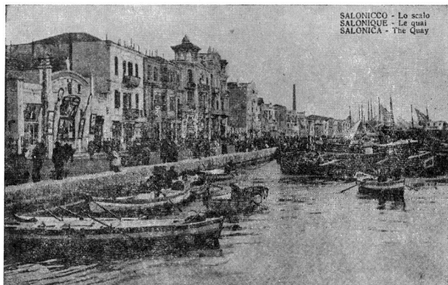
3. Ἡ λεωφόρος Νίκης πρὶν ἀπὸ τὴν πυρκαϊὰ στὸ νοτιοδυτικὸ τμήμα τῆς, κοντὰ στὴν πλατεία Ἐλευθερίας

Ἡ πυρκαϊὰ τοῦ Αὐγούστου τοῦ 1917 εἶναι ἀσφαλῶς ἡ μεγαλύτερη ἀπ' ὄσες εἶχαν συμβεῖ στοὺς παρελθόν, οἱ ὁποῖες ἔβρισκαν βέβαια εὐφλεκτο ὑλικὸ στοὺς ξύλινους σκελετοὺς τῶν σπιτιῶν, στοὺς τσατμάδες 1 . Ἡ τελευταία ὁμως τοῦ 1917 κατέστρεψε τὰ ὄρατα καὶ γραφικὰ κτίρια τῆς παραλίας, τὰ ὁποῖα μνημονεὺει ὁ Abastado. Μιὰ μικρὴ ἰδέα τῶν κτιρίων αὐτῶν πρὶν καὶ μετὰ τὴν πυρκαϊὰ μᾶς δίνει ἡ συγκριτικὴ ἐξέταση δύο φωτογραφιῶν τῆς νοτιοδυτικῆς παραλίας, τὶς ὁποῖες παρουσιάζω παρακάτω (εἰκ. 3 καὶ 4).