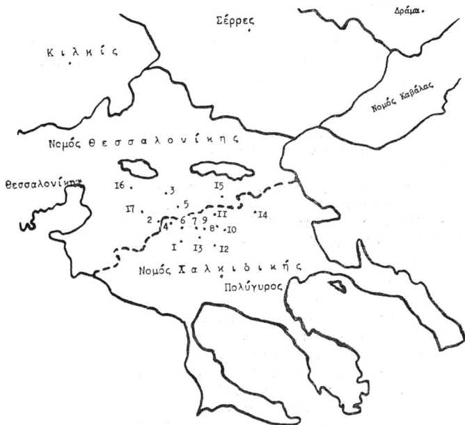
Χάρτης τῆς Ἱερᾶς Ἐπισκοπῆς Ἁρδαμερίου

3. Κατὰ κανόνα οἱ κάτοικοι εἶναι φτωχοὶ καὶ ἐργάζονται ὄλοι οἰκογενειακῶς σὲ γεωργικὰ καλλιέργειες. Οἱ γυναῖκες ὑφαίνουν οἱ ἴδιες τὰ υφάσματα γιὰ τὶς ἀνάγκες τῆς οἰκογένειας. Τὰ σπῖτια, τὰ ἐπιπλα καὶ τὰ σκευῆ εἶναι ἀπλὰ καὶ ἡ τροφὴ λιτὴ. Ὑπάρχει διαφθορά, γιὰτὶ ἄλλοτε οἱ κοτζαμπάσηδες καὶ οἱ ἀζάδες διαφθεῖρουν τοὺς ὑπάλληλους τῆς Κυβερνήσεως καὶ ἄλλοτε ἀντιστρόφως οἱ ὑπάλληλοι διαφθεῖρουν τοὺς πρώτους μὲ ἀποτέλεσμα νὰ ξοδεύονται τὰ κοινὰ χρήματα γιὰ τὴν ἐξυπηρέτησιν ἰδιοτελῶν σκοπῶν.