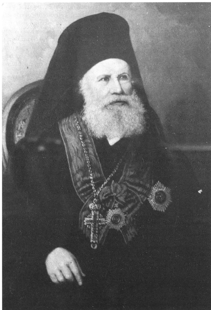
Εικ. 1. Ο πατριάρχης Αλεξανδρείας Καλλίνικος.