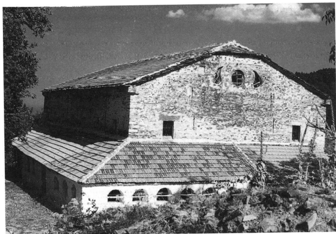
Εικ. 2. Ο ναός Κοιμήσεως Θεοτόκου Άνω Σκοτίνας.