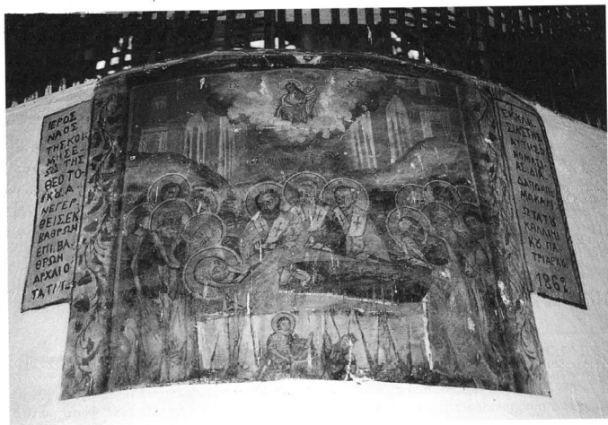
Εικ. 3. Ιερός ναός Κοιμήσεως Θεοτόκου. Κτητορική επιγραφή.