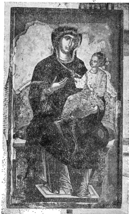
Εικ. 1. Παναγία ένθρονη βρεφοκρατούσα

1. Παναγία ένθρονη βρεφοκρατούσα διαστάσεων 0,745×0,415 (εικ. 1). Στο κάτω αρι-