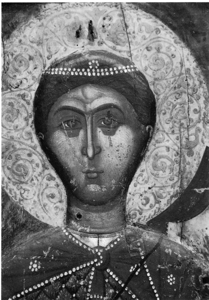
Εικ. 2. Η κεφαλή του αγίου Δημητρίου (λεπτομέρεια της εικ. 1).