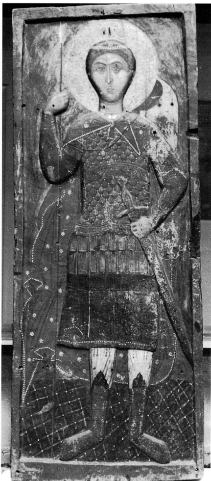
Εικ. 1. Βυζαντινό Μουσείο Καστοριάς. Η ξυλόγλυπτη εικόνα του αγίου Δημητρίου.