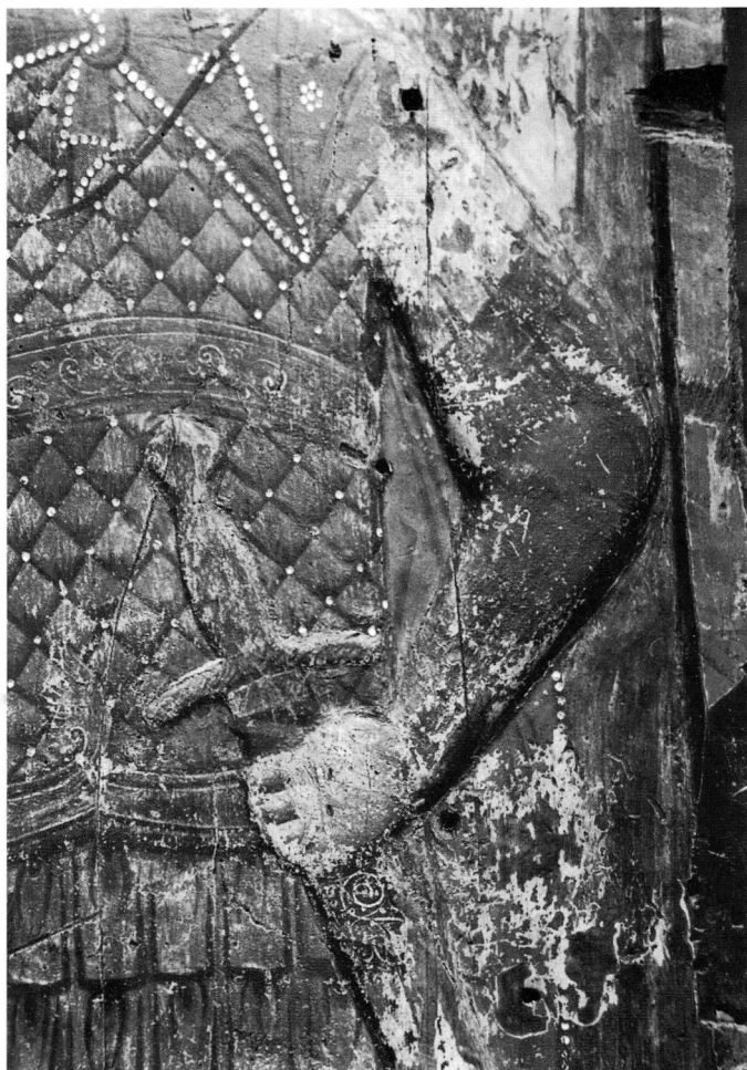
Εικ. 3. Τμήμα από τη στρατιωτική περιβολή του αγίου Δημητρίου (λεπτομέρεια της εικ. 1).