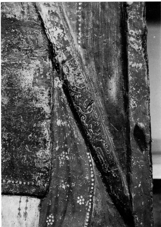
Εικ. 4. Τμήμα από τη στρατιωτική περιβολή του αγίου Δημητρίου (λεπτομέρεια της εικ. 1).