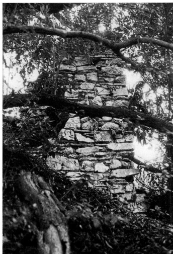
Εικ. 5. Προσθήκη της νότιας πλευράς. Αποψη από τα Δ. (1990).