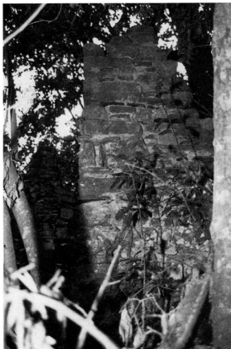
Εικ. 6. Προσθήκη της νότιας πλευράς. Αποψη από τα Ν. (1990).