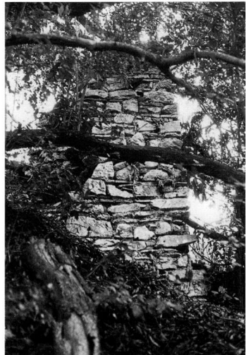
Εικ. 5. Προσθήκη της νότιας πλευράς. Αποψη από τα Δ. (1990).