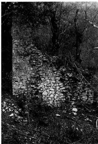
Εικ. 7. Η ανατολική πλευρά του πύργου όπως σωζόταν το 1990.