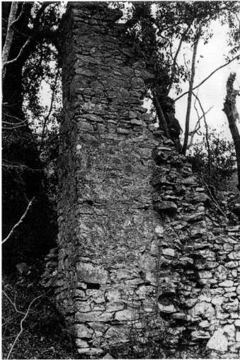
Εικ. 4. Αποψη της ΝΑ. γωνίας με τις ημικατεστραμμένες αβαθείς αντηρίδες (1990).