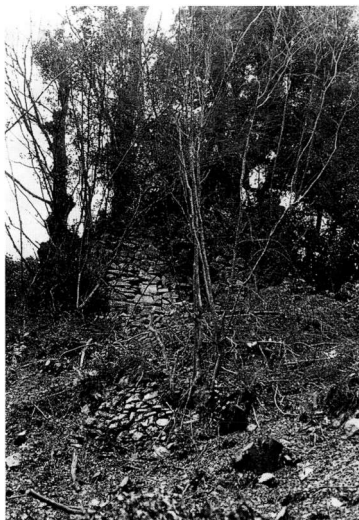
Εικ. 2. Η δυτική όψη του πύργου με τα γύρω ερείπια. Άποψη από το μονοπάτι Μ. Ζωγράφου - Μ. Χελανδαρίου (1990).