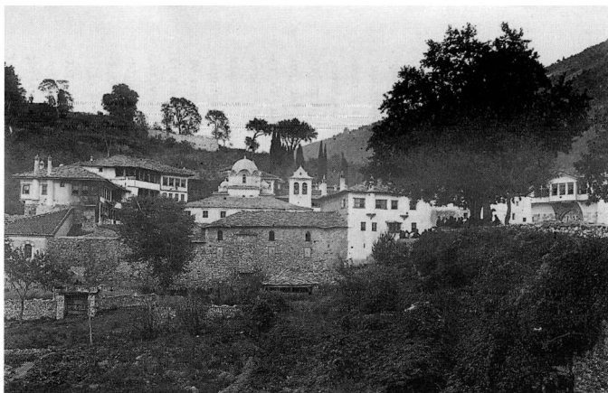
Εικ. 1. Η μονή Εικοσμοφονίας στις αρχές του 20ού αιώνα.