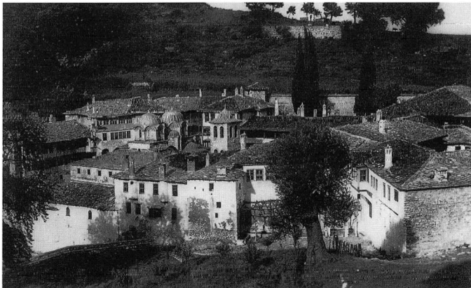
Εικ. 1. Η μονή Εικοσμοφονίας πριν από την πυρόλυσή της.