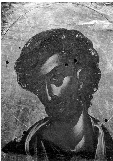
Εικ. 4. Μονή Ζάβορδας. Ο άπόστολος Λουκάς, λεπτομέρεια από τμήμα έπιστυλίου με θέμα τή Μεγάλη Δέηση.