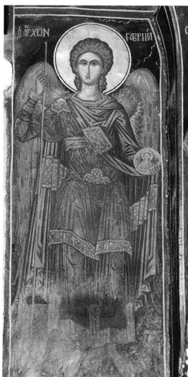
Εικ. 3. Μονή Μεγίστης Λαύρας. Ο άρχων Γαβριήλ από τό παρεκκλήσιο του άγιου Νικολάου (1560).