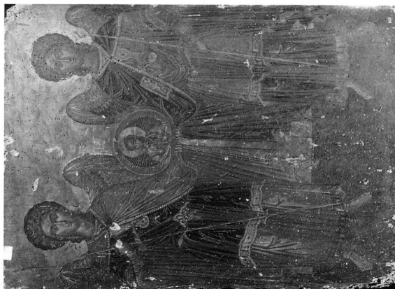
Εικ. 1. Μονή Μεγίστης Λαύρας. Εικόνα Συνάξεως των Ἀρχαγγέλων.