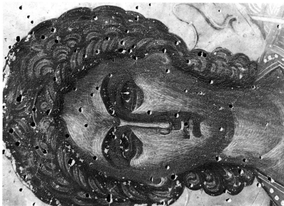
Εικ. 2. Μονή Μεγίστης Λαύρας. Εικόνα Συνάξεως των Ἀρχαγγέλων (λεπτομέρεια).