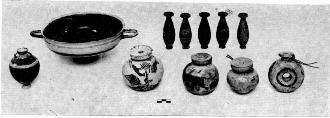
a. Die Vasen vom Grab Nr. 28