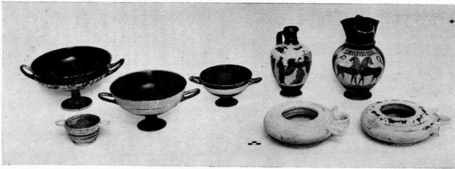
b. Die Vasen vom Grab Nr. 65