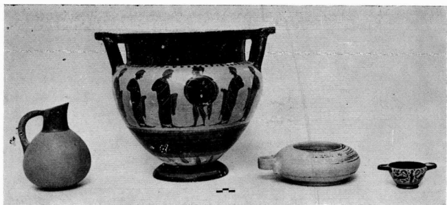
b. Die Vasen vom Grab Nr. 66