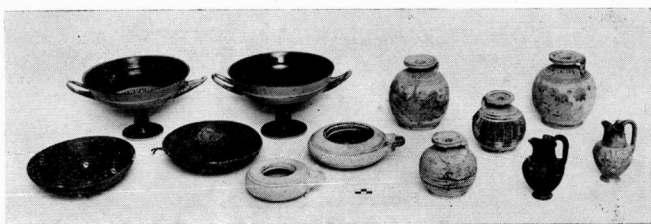
a. Die Vasen vom Grab Nr. 25