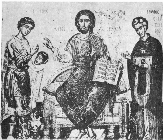
Εικ. 2. Φορητή εικόνα μονής Αγ. Παύλου