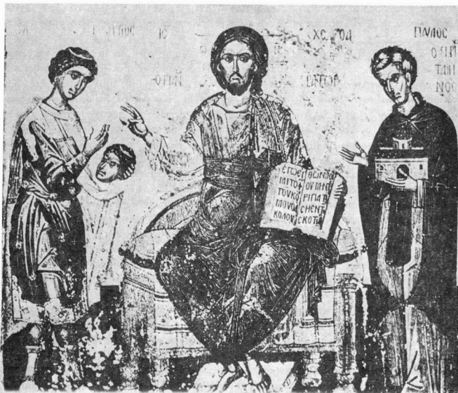
Εικ. 2. Φορητή εικόνα μονής Αγ. Παύλου