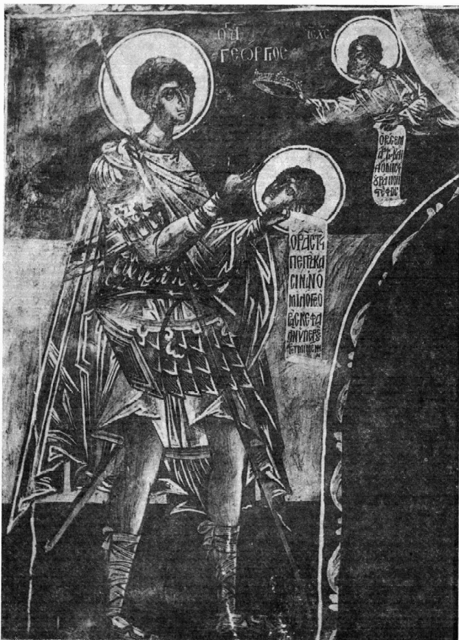
Εικ. 1. Τοιχογραφία μονής Ξενοφώντος

μένα τα εξής: «ΟΡΩ ΣΕ ΜΑΡΤΥΣ ΚΑΙ ΔΙΔΩΜΙ ΣΟΙ ΟΥΡΑΝΤΟΝ ΣΤΕΦΟΣ». Η εικονογραφική αυτή διάταξη θυμίζει μια άλλη ζωγραφισμένη ανάγλυφη αμφιπρόσωση