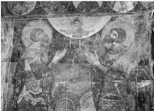
Εικ. 8. Αγ. Γεώργιος του βουνού. Οι Άγιοι Θεόδωροι.

γραφική του Αγ. Νικολάου της ενορίας Αγ. Λουκά, των Ταξιαρχών της Μητροπόλεως (1359-60), του Αγ. Αθανασίου του Μουζάκη (1383-84), καθώς και με τη ζωγραφική των ναών στο Τρεςκανάβ της Γιουγκοσλαβικής Μακεδονίας και στη Βορτζε της Αλβανίας.