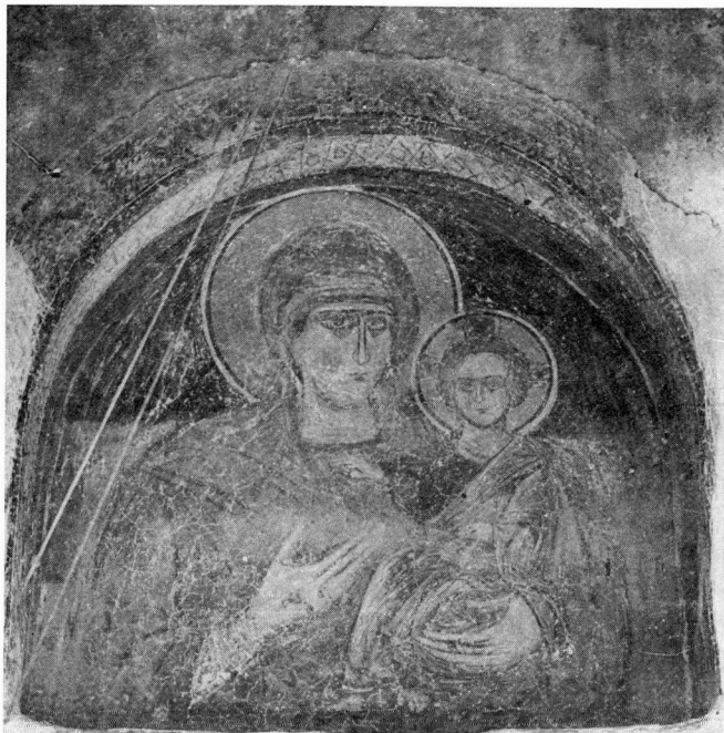
Εικ. 1. Ταξιάρχης Γυμνασίου. Παναγία Οδηγήτρια.

Στο εσωτερικό του ναού, που βρίσκεται δυτικά της Παναγίας Κουμπελίδικης, διαπιστώθηκαν τρία στρώματα τοιχογραφιών. Το πρώτο στρώμα εκτείνεται στον ανατολικό, στο δυτικό και στο βόρειο τοίχο. Από το στρώμα αυτό διακρίνεται η Σταύρωση και η Αποκαθήλωση στο δυτικό τοίχο. Το στρώμα αυτό, που είναι σύγχρονο με το χρόνο ανεγέρσεως του ναού χρονολογείται πιθανότατα με βάση τα στοιχεία, εικονογραφικά και τεχνοτροπικά, που είναι ορατά στον 10ο-11ο αιώνα.