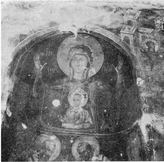
Εικ. 7. Ιωάννης ο Προδρόμος.

πρώτη φάση ζωγραφικής περιορίζεται στον κυρίως ναό και εκτείνεται σ' όλους τους τοίχους (εικ. 8). Εικονογραφικά στοιχεία και τέχνοτροπικά χαρακτηριστικά εντάσσουν τις τοιχογραφίες αυτές στο τρίτο τέταρτο του 14ου αιώνα 1 και τις συνδέουν με τη ζω-