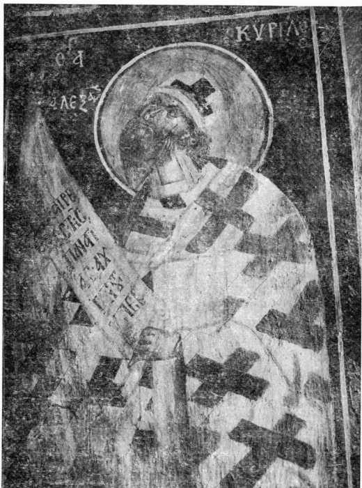
Εικ. 3. Άγιος Νικόλαος ο Πετρίτης. Ο Άγ. Κύριλλος ο Αλεξανδρείας.

ναός αρχικά ετιμάτο στη μνήμη του Αγ. Γεωργίου. Αυτό συνάγεται από την παράσταση του Αγ. Γεωργίου, που φέρει την επωνυμία Διασορίτης, και ο οποίος απεικονίζεται έμβρονος μέσα σε γραπτό, τοξωτό, κιονοστήριχο πλαίσιο στο νότιο τοίχο, μπροστά ακριβώς από τέμπλο, σε θέση δηλαδή, όπου κατά κανόνα εικονίζεται ο προστάτης άγιος του ναού 1 .