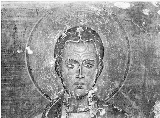
Εικ. 2. Άγιος Στυλιανός. Ο Άγ. Δαμιανός (λεπτομέρεια).

περίοδο ανήκει και η Παναγία Οδηγήτρια (εικ. 1), που εικονίζεται στην κόγχη, πάνω από την είσοδο προς τον κυρίως ναό. Τέλος, το τρίτο στρώμα, που χρονολογείται στον 17ο αιώνα, σώζεται στο νότιο τοίχο και εκτείνεται σε τρεις ζώνες 1 .