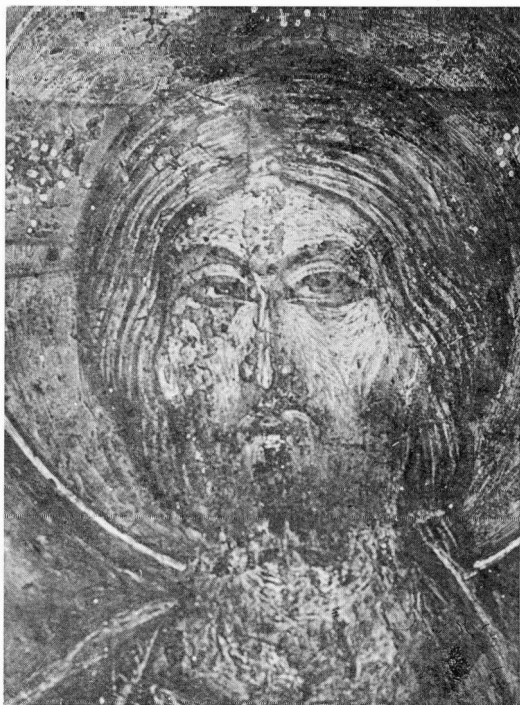
Εικ. 5. Παναγία Φανερωμένη. Ο Χριστός Ζωοδότης (λεπτομέρεια).

τίας εισόδου, οι τοιχογραφίες αυτές χρονολογούνται στα 1401. Στην ίδια περίοδο κατατάσσονται και οι τοιχογραφίες των εξωτερικών επιφανειών του ναού. Οι τοιχογραφίες αυτές ακολουθούν το αντικλασικό ρεύμα της ζωγραφικής της ύστερης περιόδου των Παλαιολόγων 1 .