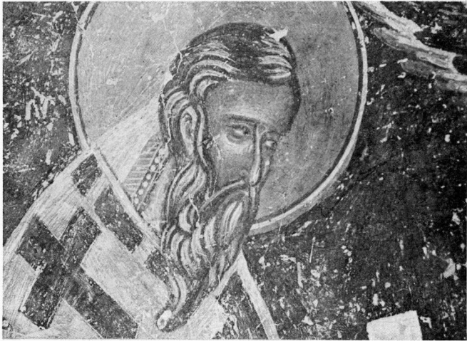
Εικ. 6. 'Αγ. Τρεις. Ο 'Αγ. Βασίλειος (λεπτομέρεια).