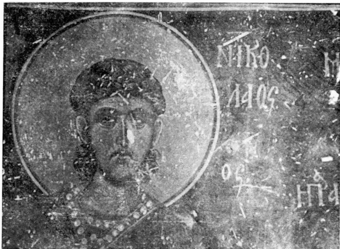
Εικ. 4. 'Αγ. Νικόλαος ενορίας Αγ. Λουκά. 'Αγ. Νικόλαος ο νέος (λεπτομέρεια).

νοικία Μητροπόλεως 1 . Διατηρεί στο ιερό ενδιαφέρουσες τοιχογραφίες του τρίτου, τέταρτου του 14ου αιώνα (εικ. 3), οι οποίες σε μεγάλο μέρος έχουν επιζωγραφηθεί 2 . Οι τοιχογραφίες αυτές παρουσιάζουν κοινά τεχνοτροπικά στοιχεία με τις τοιχογραφίες του Αγ. Γεωργίου του βουνού, του Αγ. Νικολάου ενορίας Αγ. Λουκά και του Ταξιάρχη της Μητροπόλεως (1359-1360). Στο βόρειο και δυτικό τείχος του ναού σώζονται τοιχογραφίες ολοσώμων αγίων μέσα σε πλούσιο αρχιτεκτονικό, νεοκλασσικίζον πλαίσιο. Οι τοιχογραφίες αυτές, έργο του Ναούμ Μαχαιρά, χρονολογούνται στο τέλος του 19ου αιώνα.