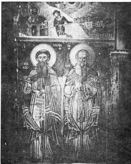
Εικ. 9. Άγ. Γεώργιος του βουνού. Ο Άγ. Γρηγόριος ο Παλαμάς και ο Άγ. Αθανάσιος, ο μέγας.

Στο ναό σώζεται ακόμα αξιόλογο ξυλόγλυπτο αναλόγιο του 16ου-17ου αιώνα 1 .