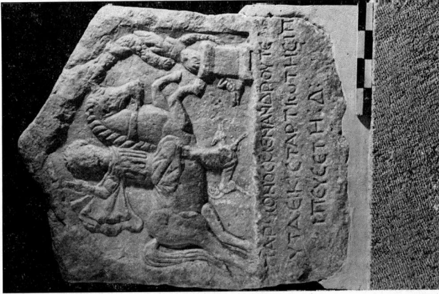
β. Ενεπίγραφοι ανέγλυφοι στηλή αο. 105 Μοναστείου Φλώρινας.