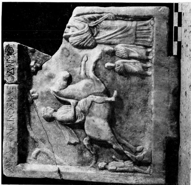
β. Ενεπύραφρη ανάρλωνη στίγη Συλλογής Τσοτύλου.