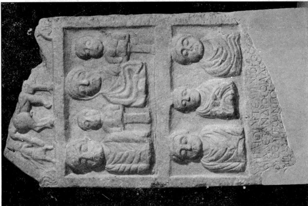
α. Ενεπίγραφοι ανέγλυφοι στηλή αο. 14 Μοναστείου Φλώρινας.