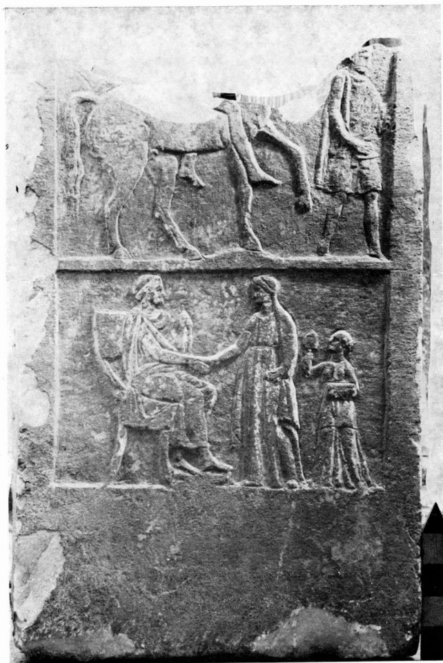
Ανάγλυφη στήλη αρ. 939 Αρχαιολογικής Συλλογής Κοζάνης.