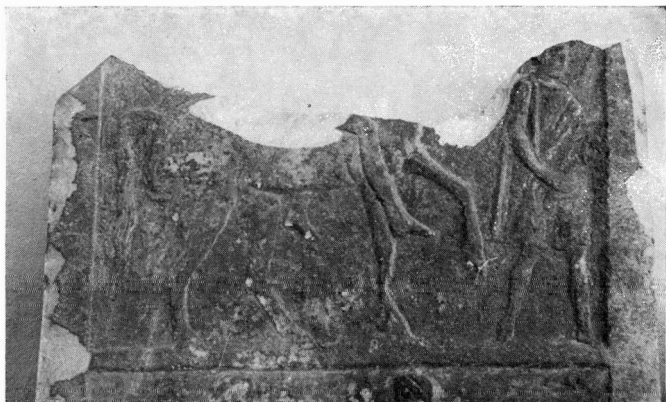
α. Πάνω διάχωρο ανάγλυφης στήλης αρ. 939 Αρχαιολογικής Συλλογής Κοζάνης.