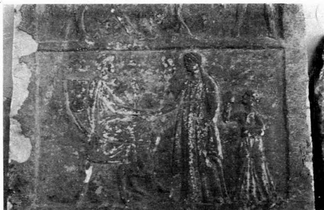
β. Κάτω διάχωρο ανάγλυφης στήλης αρ. 939 Αρχαιολογικής Συλλογής Κοζάνης.