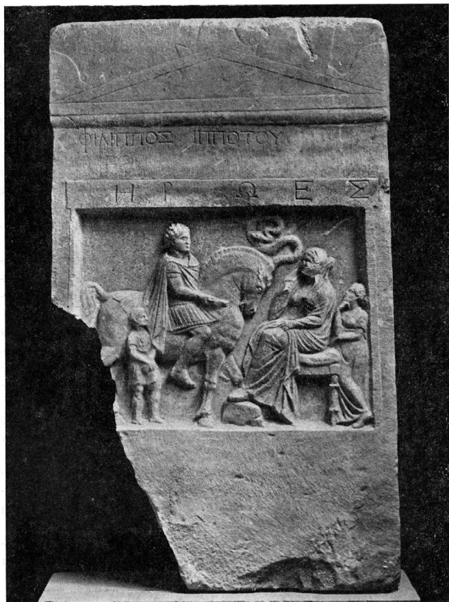
Εικ. 1. Η επιτάφια στήλη από τον Κολινδρό.

διακρίνονται ίχνη από ντισιλίδικο και λάμα, ενώ στα ρούχα και τα επιμέρους στοιχεία γλωσσάκι και κοπανάκι. Η πίσω επιφάνεια της στήλης είναι πρόχειρα δουλεμένη με το βελόνι και διαμορφώνεται σε τρία βαθμιδωτά επίπε-