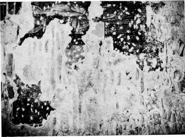
α. Παλιά Μητρόπολη Εδέσσης. Η παράσταση των κλητόρων.