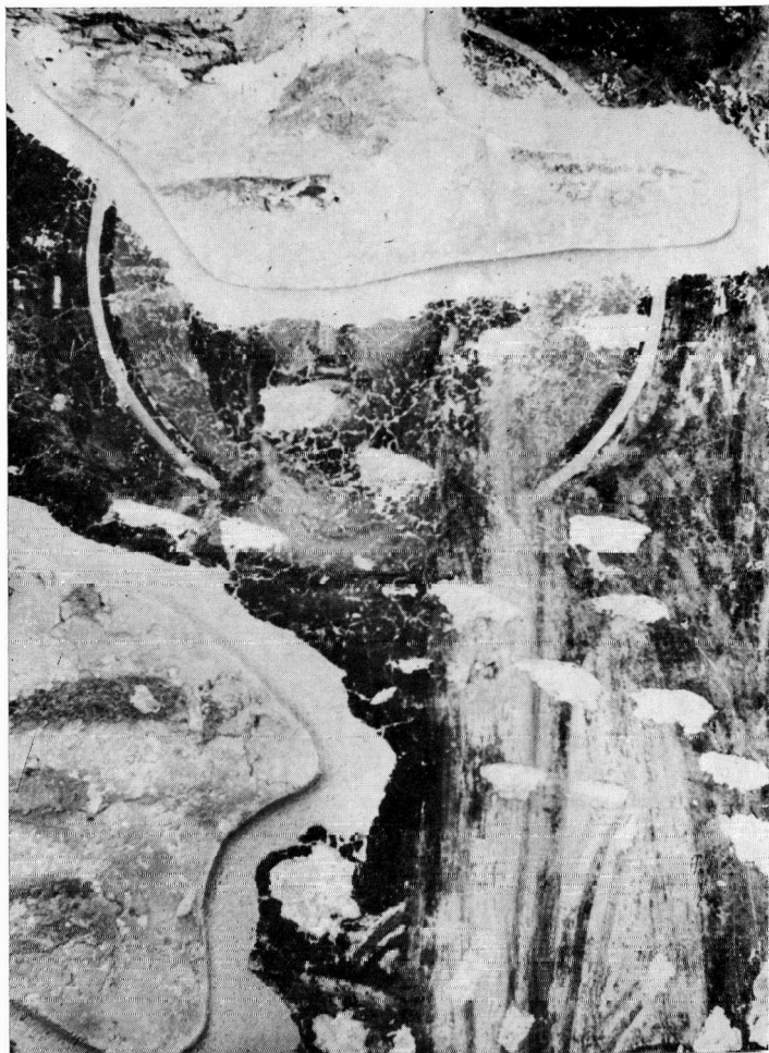
Παλιά Μητρόπολη. Ο Χριστός από την παράσταση των κτητόρων. Λεπτομέρειες.