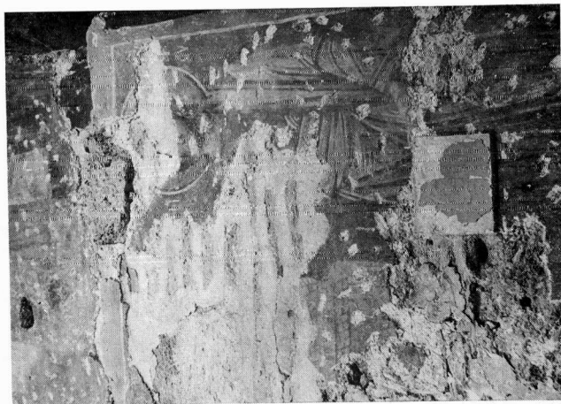
β. Παλιά Μητέριολη Εδέσσης. Ο Χριστός από την παράσταση των κητόρων.